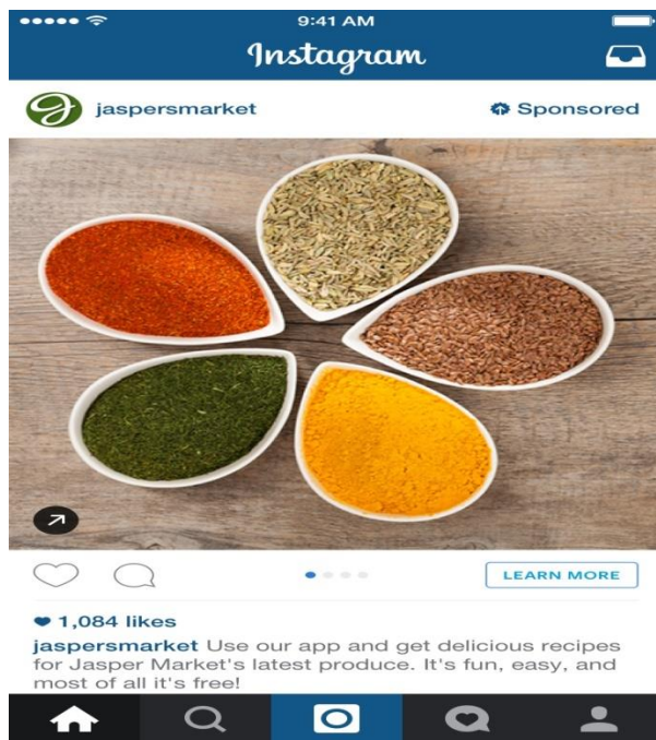
Slika 5 primjer oglašavanja na Instagramu

toga 57% bile su žene. Od tada do siječnja 2017. godine broj korisnika se udvostručio. Po podacima agencije Arbona iz kolovoza 2019. Instagram u Hrvatskoj koristi više od 1,1 milijun ljudi.