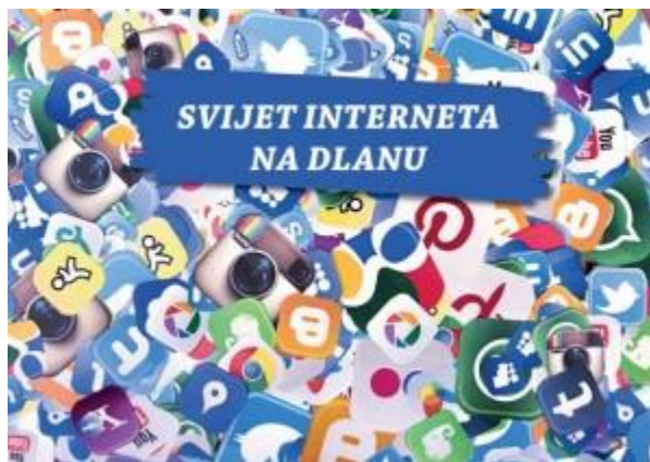
Slika 7. Brošura „Svijet interneta na dlanu“