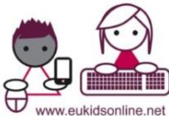
Slika 10. EU Kids Online

Koordinator istraživanja bilo je Društvo za komunikacijsku i medijsku kulturu, a glavni partneri su bili Agencija za elektroničke medije i Hrvatski Telekom. Ostali partneri bili su OŠ Većeslava Holjevca (Grad Zagreb), Hrvatska regulatorna agencija za mrežne djelatnosti te Centar za nestalu i zlostavljaju djecu. Projekt su podržali i Ministarstvo znanosti i obrazovanja, Ministarstvo za demografiju, obitelj, mlade i socijalnu politiku i Grad Zagreb, Ured za obrazovanje, kulturu i sport.