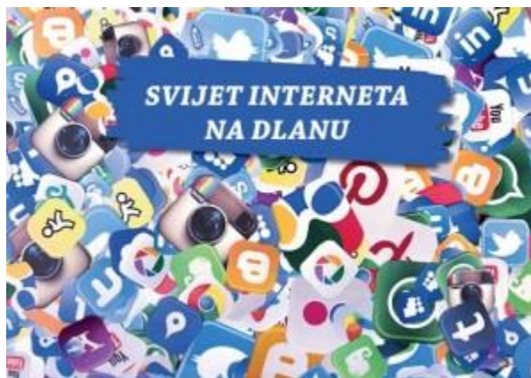
Slika 7. Brošura „Svijet interneta na dlanu“