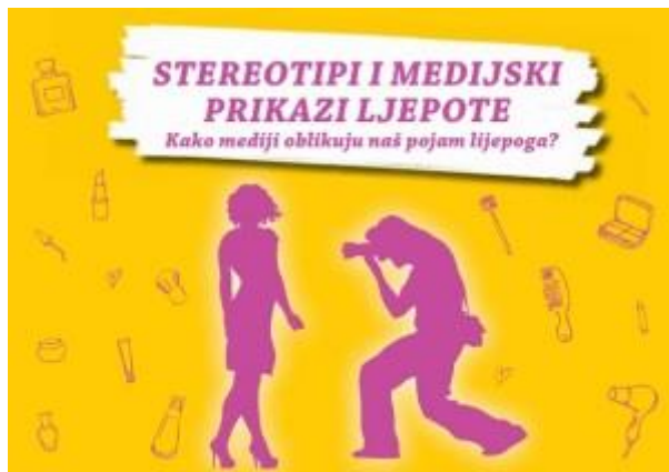
Slika 4. Brošura „Stereotipi i medijski prikazi ljepote: kako mediji oblikuju naš pojam lijepoga?

se vežu određeni načini ponašanja. Tako su recimo Afroamerikanci često prikazani kao ljudi nižeg društvenog statusa čija se djeca povezuju sa sportom ili glazbom. Latinoamerikanci se često povezuju sa nekim kriminalnim radnjama i ljepotom.