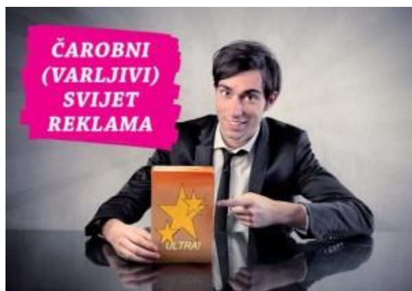
Slika 8. Brošura „Čarobni (varljivi) svijet reklama“