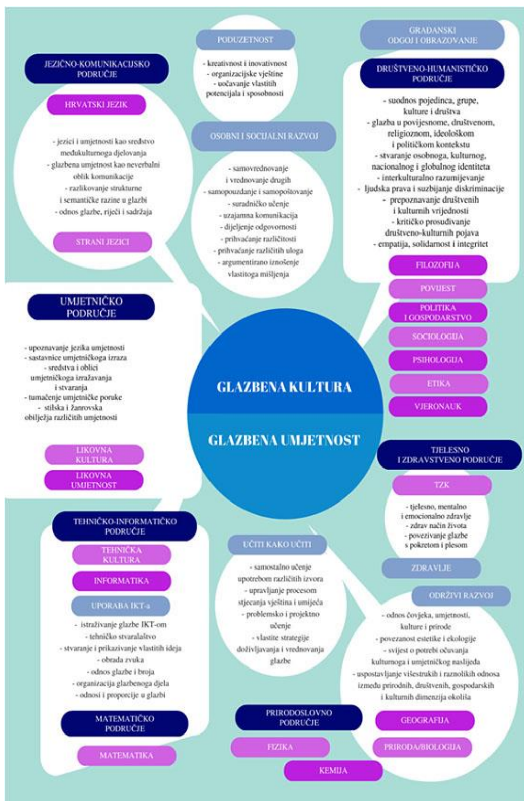
Slika 2. Povezanost GK/GU s drugim predmetima i međupredmetnim temama (MZO, 2019)