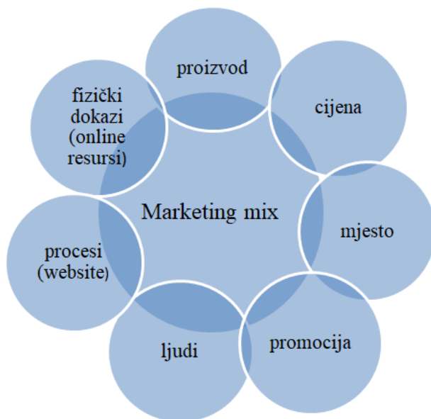
Slika 2. 7P e-marketing mixa