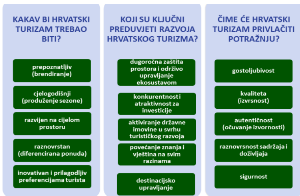
Slika 1. Sustav vrijednosti nove vizije hrvatskog turizma