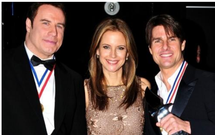
Slika 3: Najpoznatiji slavni scijentolozi John Travolta i Tom Cruise

Kao zadnju navodim Jennu Elfman, glumicu koja je u scijentologiji od svoje 18. godine i za taj kult ima samo riječi hvale.