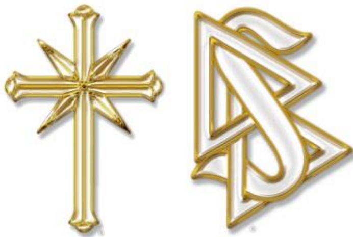
Slika 2: Simboli scijentologije

„Iako dijantetika i scijentologija nemaju kršćansko obilježje, ipak se uz naziv Crkve stavio i znak križa uz tumačenje da vertikalna greda križa upućuje na nastojanja prema višoj duhovnosti, a horizontalna greda da se stojeći u svijetu, mora pomoći ljudima zahvaćenim bolešću, ratovima i svakovrsnom bijedom.“ (Kolarić,2017)