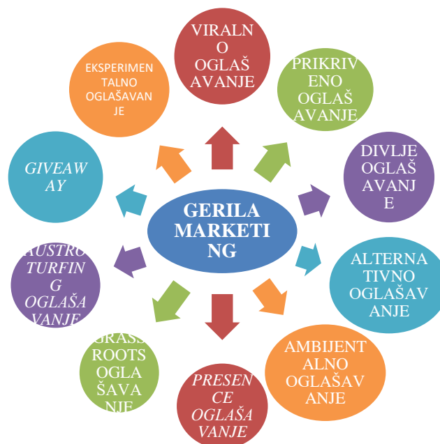
Slika 1: Gerila marketing