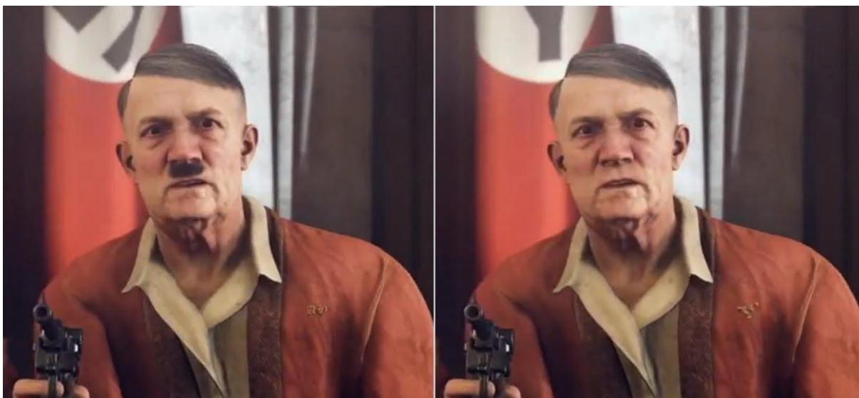
Slika 3. Prikaz Hitlera u njemačkoj verziji (desno) te u drugim verzijama (lijevo) videoigre Wolfenstein II: New Colossus