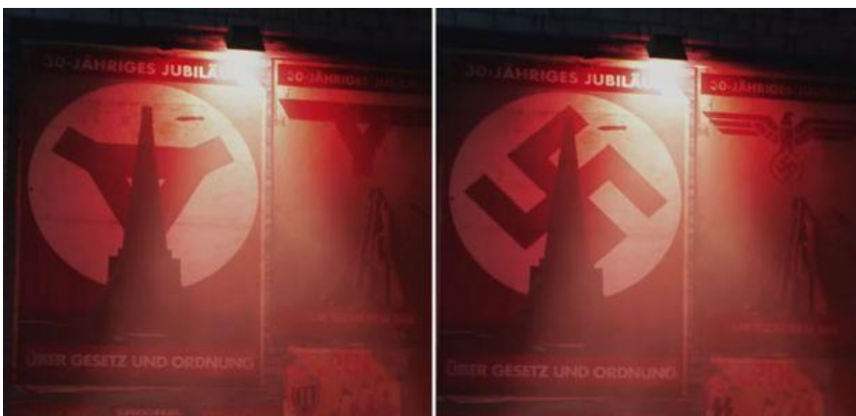
Slika 4. Wolfenstein Youngblood – zamjena nacističkih simbola s logotipom igre ili manje uvredljivim simbolima