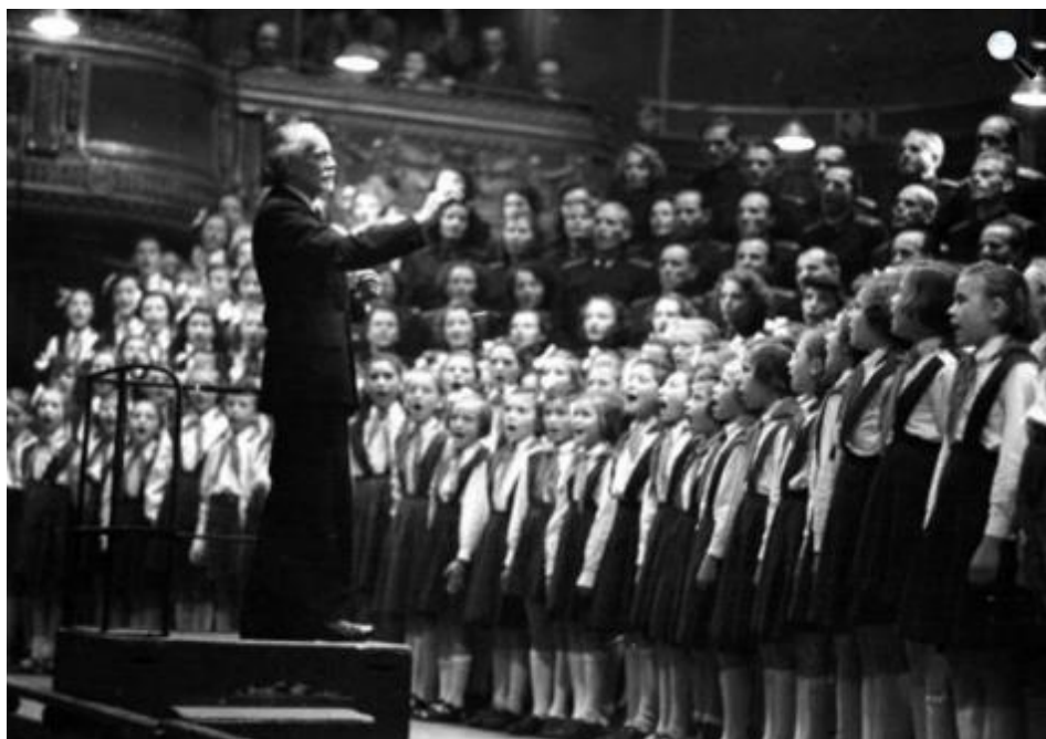
Zoltán Kodály dirigira izvedbom zborova na Muzičkoj Akademiji u Budimpešti, 1954. 3