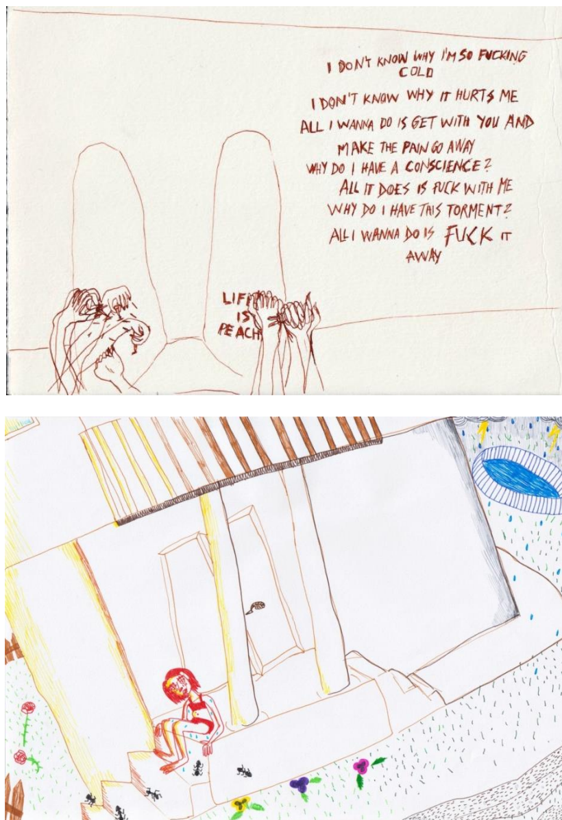
Slika 5: Iz serije Iza mene , tuš i lajneri, 2018.

Kada sam upisala diplomski studij Ilustracija, posvetila sam se razvitku linijskog crteža. Medij ilustracije omogućio mi je da priču ispričam u jednom crtežu (slika broj 5).