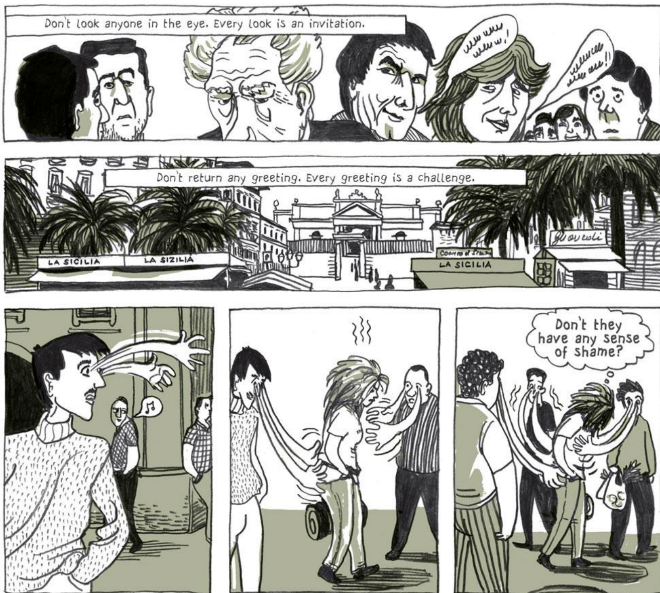
Slika 6: Ulli Lust, Danas je posljednji dan ostatka tvog života , 2009.