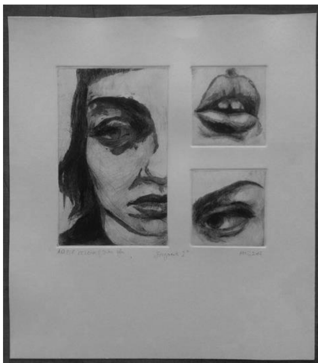
Slika 4: Fragmenti 2 , rezervaš i suha igla, 36 x 32 cm, 2017.

U grafici sam započela sa serijom linoreza koji su bili introspektivne slike moje unutrašnjosti. Bila je to kompilacija škrabotina, teksta i figurativnih motiva. Zbog svih mogućnosti grafike, odlučila sam odraditi završni rad u rezervašu i suhoj igli, nazvan Fragmenti autoportreta , pod mentorstvom doc. dr. art. Ines Matijević Cakić. Tada sam prvi puta implementirala strip kadriranje u svome radu (slika broj 4).