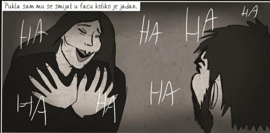
Slika 9: Sad smo kvit , tabla 26, 2020.

Pukla sam mu se smijat u facu koliko je jadan.