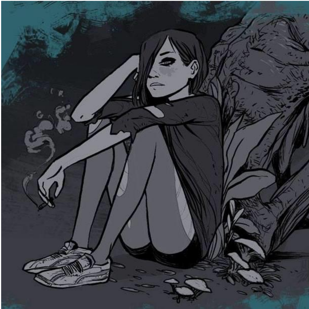
Slika 7: Marko Dješka, Crna Željka , 2017.

Projekt koji je mene najviše zainteresirao je lik Crne Željke . Crna Željka se pojavljuje u dva kratka stripa: Crni Božić i Crni gavran . Dugometražni strip o njenom liku je još uvijek u izradi. Njezin lik mi je zanimljiv zbog alternativne supkulture koju predstavlja, podsjeća me na moje tinejdžerske dane koje opisujem u svome stripu.