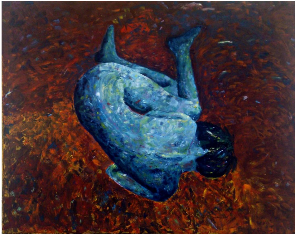
Slika 2: Autoakt , ulje na platnu, 150 x 150 cm, 2014.

Autoportret istražujem već niz godina, počevši od mog pohađanja Škole primijenjene umjetnosti i dizajna u Osijeku. Dok smo iz povijesti umjetnosti učili o austrijskom ekspresionizmu, shvatila sam da kroz boju, ekspresivan crtež i moj lik mogu izraziti svoje unutrašnje stanje. U tom smjeru je išao moj maturalni rad pod mentorstvom Nedeljka Čubeka, autoakt koji se nalazio u kaosu dvaju komplementarnih boja, u pozi fetusa (slika broj 2).