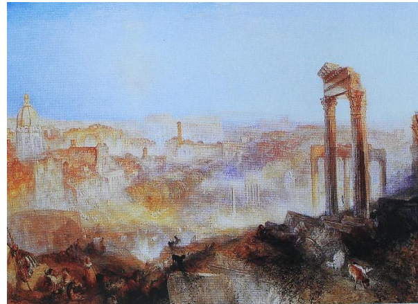
Slika 7 Moderni Rim – Campo Vaccino , 1839., ulje na platnu, 91.8 × 122.6 cm