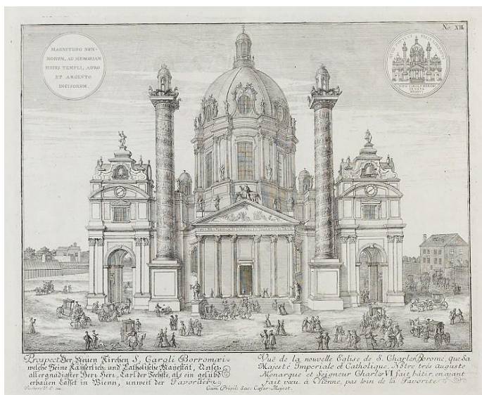
Slika 2 Johann Bernhard Fischer von Erlach, Vizualizacija Karlskirche -a, Beč, (1716.–23.)

slikarstva i djelima Petera Paula Rubensa, koji je na španjolskom dvoru boravio kao diplomat, ali i slikar kraljevskih portreta. Potaknut i impresioniran, taj susret bio je i okidač za Velázquezovo studijsko putovanje Italijom, iz kojega se izrodilo