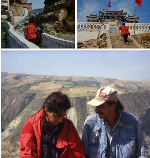
Slika 14 Ljubavnici (1988.). Susret i završetak performansa Marine Abramović i Ulaya nakon 3 mjeseca hoda Velikim kineskim zidom.

Neovisno o životnoj situaciji i produciranom radu, nedvojbeno je da su putovanja ostavila utjecaj u djelovanju i razmišljanju Marine Abramović. Ponekad su ona bila bijeg od trenutnih teškoća, ponekad težnja za samoostvarenjem, duhovnom preobrazbom ili želje za slobodom. Snažni Marinin karakter i iskušavanje granica vlastitih mogućnosti, kako psihičkih tako i granica boli u fizičkom smislu,