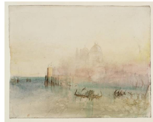
Slika 9 Venecija: Bacino, Canale della Giudecca i Canale di San Marco , 1840., akvarel i grafit, 40.9 × 56.2 cm

Svrha tih putovanja bila je dokumentirati i prikupiti vizualni materijal koji će se koristiti kao inspiracija i referenca za njegove kasnije radove, pretežito ulja na platnu. Svako novo mjesto koje je Turner posjetio ponudio mu je nove izazove: promjenu zemljopisa i okruženja, nova poznanstva i iskustva, uzbudljivu arhitekturu i, što je najvažnije, različite kvalitete svjetla (Slike 6-9). Putujući, ponajprije se otisnuo na putovanja van Britanije, pa je tako istraživao Francusku, Belgiju, Nizozemsku, Njemačku, Luksemburg, Dansku, Bohemiju (današnju Češku), Švicarsku i, naravno, Italiju. Iako su njegova putovanja bila česta, ipak ona su bila ograničena na područje Europe, dok su neki od njegovih suvremenika u isto to vrijeme započinjali svoje rute u Egipat, Španjolsku ili britanske kolonije u Aziji i Australiji.