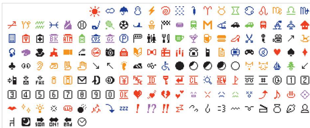
Slika 1. SHIGETAKA KURITA, EMOJI, 1998-1999, DIGITALNA SLIKA, RAZLIČITE VELIČINE.

Ako se uz sve navedeno uzme u obzir da djeca imaju pristup pametnim uređajima postoji velika mogućnost da imaju bolje razvijenu vizualnu percepciju, a ponajviše vizualno pamćenje jer su stalno okružena slikama i raznim drugim vizualnim medijima. Kroz razne igre potiče se pamćenje oblika i njihovih namjena, a kroz komunikaciju putem interneta koja uključuje uporabu takozvanih emoji-a potiče se sve kompleksnije interpretiranje slika i oblika. Naime, emoji su sličice koje komuniciraju određene poruke o raspoloženju i sličnome. Sa začecima u 90-ima, prvo su nastali kao font wingdings razvijen za Microsoft kako bi se zaobišao tada učestao problem ograničenog prostora i kompjuterske memorije te spore brzine Interneta. (Why the Wingdings font exists, 2015) Windgdings je omogućio uporabu slike u tekstu radi uljepšavanja i sličnoga. (Why the Wingdings font exists, 2015) Naravno ovaj font je i dalje daleko od suvremenih emoji-a, čiji pravi početci su u 1999. kada Shigetaka Kurita dizajnira set od 176 emojija za mobitele i pagere. (Shigetaka Kurita, 2019)