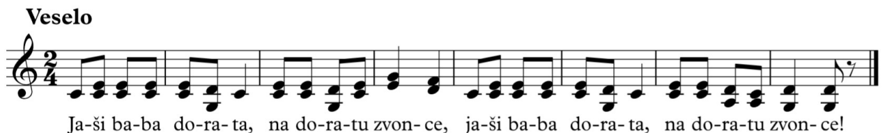
Slika 1. Zapis Jaši baba dorata , Prkovci