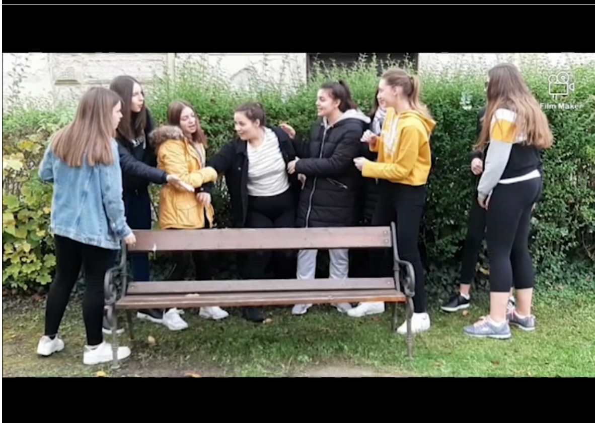
Slika 20. Skupina 6 snimljena od strane voditelja (gore) i vlastiti snimak (dolje) pri izvođenju reinterpetacija umjetničkog djela Lovre Artukovića - Potpisivanje deklaracije o pripajanju Zapadne Hercegovine i Popova polja Republici Hrvatskoj