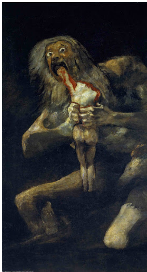
Slika 8. Francisco Goya, Saturn proždire svoju djecu , 1821. - 1823.

Sličan pristup imao je meksički redatelj Guillermo del Toro u filmu Panov labirint iz 2006. godine. Fantastična mračna drama nas vodi u Francovu Španjolsku četrdesetih godina prošlog stoljeća gdje pratimo djevojčicu koja živi u svijetu bajki. Odnos prema realnosti i bajkama se miješaju kao da obje stvarnosti postoje. Redateljev originalan pristup portretiranja djevojčice koja tragedije rata zamjenjuje fantastičnim bajkovitim bijegom našao je uporište i u slikarstvu. U intervjuu za novinski list The Guardian , del Toro se referirao na utjecaj koji je imao španjolski slikar Francisco Goya sa svojom slikom Saturn proždire svoju djecu (vidi Sliku 8.) na odabir razvoja i izgleda scene „blijedog čovjeka“ u filmu. ( https://www.theguardian.com/film/2006/nov/17/2 ) (pristup 21.02.2020.) U navedenoj sceni biće koje spava za stolom se budi nakon što protagonistica filma odluči uzeti grozd, unatoč opomeni malih vila kako ne smije dirati ništa od hrane sa stola. U tom se trenutku budi bijelo, nalik na, ljudsko biće i lovi dvije vile koje ga pokušavaju odvratiti kako bi protagonistica uspjela pobjeći. Biće uspijeva uloviti dvije od tri vile i ubija ih na način što ih počinje proždirati, poput Saturna na slici Francisca Goye. Video isječak navedene scene se može pregledati putem YouTube poveznice: https://www.youtube.com/watch?v=1i3oRxm8G0o . (pristup 21.02.2020.)