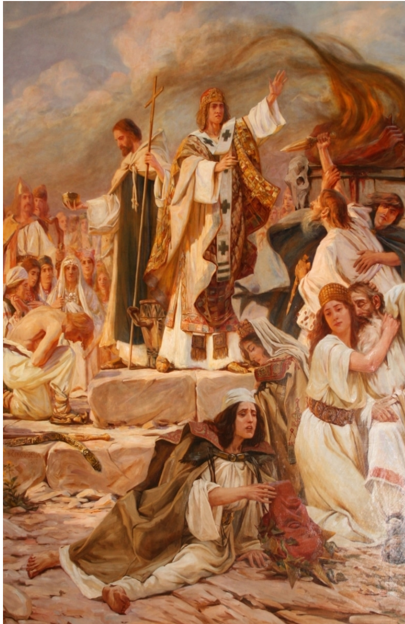
Slika 16. Bela Čikoš Sesija, Pokrštenje Hrvata , 1920.

Skupina se sastojala od osam učenika i dvoje studenata Akademije za umjetnost i kulturu koji nisu sudjelovali u završnoj izvedbi reinterpretacije umjetničkog djela. Učenici su imali trideset minuta za pripremu pomoću pripremljenih materijala na stranici thinglink.com ( https://www.thinglink.com/scene/1249352993241825282 ). Učenici su radionicu namjeravali odraditi ispred bočnog ulaza u Muzej likovne umjetnosti, no zbog tehničke poteškoće s tehničkom opremom, njihova radionica na žalost nije zabilježena. Učenici su pod vodstvom