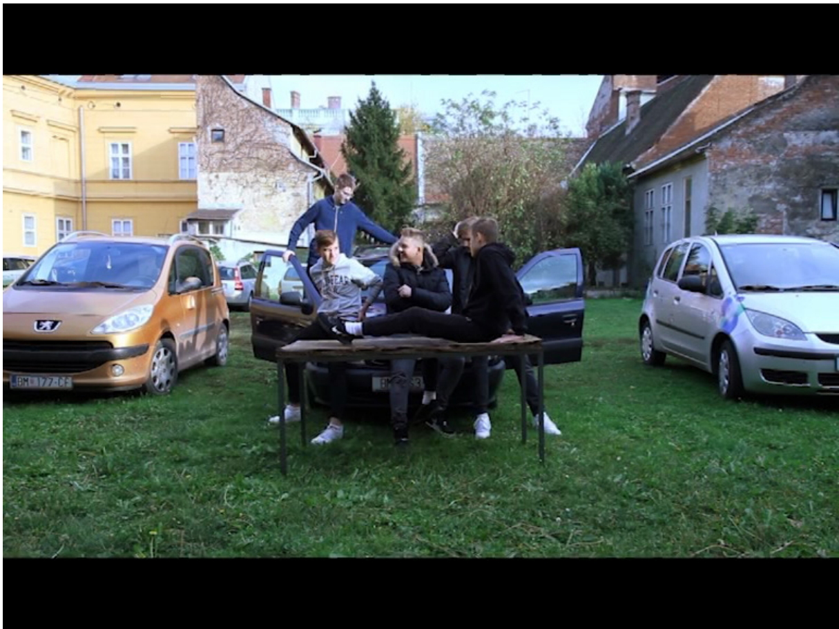
Slika 19. Skupina 5, reinterpetacija umjetničkog djela Lovre Artukovića - Potpisivanje deklaracije o pripajanju Zapadne Hercegovine i Popova polja Republici Hrvatskoj

Video zapis reinterpetacije Skupine 5 dostupan je za pregled preko poveznice https://vimeo.com/378235554 nakon unosa zaporke „RadionicaMLU321“ bez navodnih znakova.