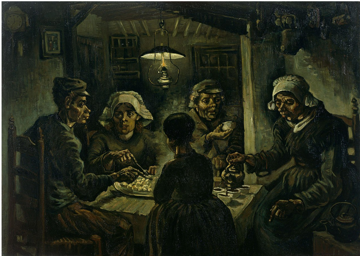
Slika 10. Vincent Van Gogh, Ljudi koji jedu krumpir , 1885.

Skupina se sastojala od šest učenika i dvoje studenata Akademije za umjetnost i kulturu. Učenici su radionicu odradili u prostoru predviđen za radionice unutar Muzeja likovne umjetnosti. Studenti nisu imali aktivnu ulogu prilikom osmišljanja reinterpetacije, nego savjetodavnu ulogu kako bi učenici bolje razumjeli umjetničko djelo i lakše osmislili reinterpetaciju. Na raspolaganju su imali trideset minuta za čitanje i pripremu materijala koji se nalazio na stranici thinglink.com , gdje se nalaze sve teme i materijali potrebni za pripremu osmišljanja video reinterpetacije umjetničkog djela ( https://www.thinglink.com/scene/1249360876905955330 ). Tema Van Gogove slike je prikaz svakodnevice nizozemskih seljaka koji okupljeni za večerom (vidi Sliku 10.). Jedu krumpir, jer on predstavljaju i posao kojim se bave te najjeftiniji izvor prehrane u tom trenutku. Učenici su odlučili napraviti identičnu reinterpetaciju. Sjeli su za stol, ogrnuli su se sa pokrivačima i krpama preko glave te su u plastične tanjure umiješali ljepilo za drvo koje je predstavljalo krumpir pire. Učenici nisu osmislili dijalog te je iz tog razloga u video zapis uvedena glazbena kompozicija. Učenici su se držali isključivo rekreacije kompozicije slike (vidi Sliku 11.).