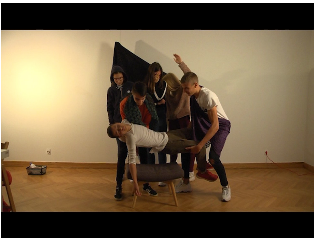
Slika 15. Skupina 3, reinterpretacija umjetničkog djela Michelangela Merisi de Caravaggia - Polaganje Krista u grob

Skupina se sastojala od šestero učenika i dvoje studenata Akademija za umjetnost i kulturu, koji nisu sudjelovali u završnoj izvedbi reinterpretacije. Učenici su imali trideset minuta za pripremu pomoću pripremljenih materijala na stranici thinglink.com ( https://www.thinglink.com/scene/1249356814248574978 ). Učenici su radionicu odradili u prostoru predviđen za radionice unutar Muzeja likovne umjetnosti. Nakon odrađenih priprema, učenici su se odlučili izvršiti reinterpretaciju sličnu viđenom pristupu Billa Viole na uvodnom videu. Dvojica učenika drže jednog učenika te ga odižu od sjedalice koja predstavlja kameni blok grobnice, dok u pozadini tri učenice plaču u očaju, a jedna od njih ima podignute ruke prema nebu kao na Caravaggiovoj slici (vidi Sliku 14.). Izvedba rada traje desetak sekundi koliko su učenici zamislili reinterpretaciju djela koje su ponavljali u nekoliko puta pred kamerom (vidi Sliku 15.). Obzirom kako su učenici odlučili stvoriti dramatičan prikaz, u montaži je voditelj radionice postavio zvučnu pozadinu dionice iz Vivaldijeva „Četiri godišnja doba (II. Largo e pianissimo sempre)