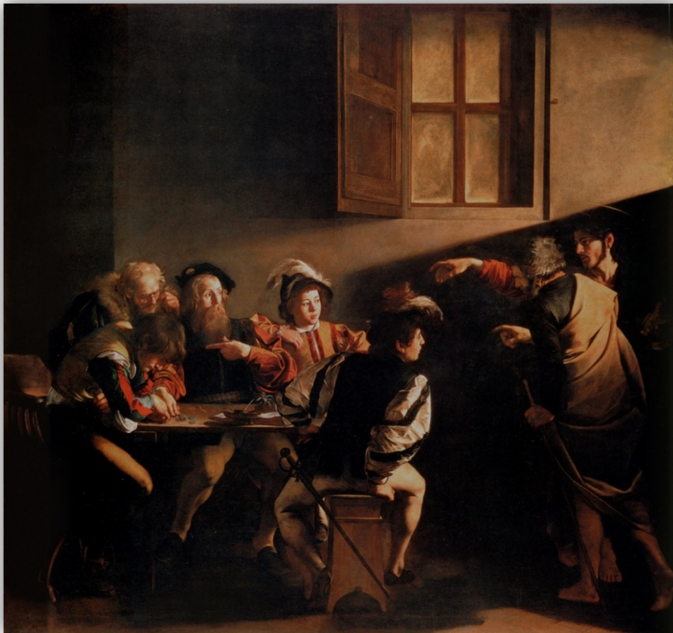
Slika 3. Michelangelo Merisi da Caravaggio, Pozivanje Svetog Mateja , 1599.-1600.

Jedan od najznačajnijih filmskih redatelja današnjice Martin Scorsese je za knjigu britanskog povjesničara umjetnosti Andrew Grahama-Dixona: Caravaggio: Svet i svjetovan život iz 2010. godine, objavio kako je scene u noćnom klubu iz njegovog filma Ulice nasilja iz 1973. godine obilježila Caravaggiova slika Pozivanje Svetog Mateja nastalo u razdoblju 1599.-1600. Godine (vidi Sliku 3.). ( https://www.theguardian.com/artanddesign/2010/jul/25/caravaggio-scorsese-lachapelle-peter-doig#ixzz2UhOnoJMB ) (pristup 21.02.2020.) U navedenoj sceni, Scorsese navodi kako je kretanje kamere, kadriranje, položaj ljudi u kadru namješteno komplementarno kompoziciji i dinamici Caravaggiove slike. Nadalje, u filmu Posljednje Kristovo iskušenje iz 1988. godine, redatelj navodi kako je lik Krista utemeljio prema samom Caravaggu. ( https://www.theguardian.com/artanddesign/2010/jul/25/caravaggio-scorsese-lachapelle-peter-doig#ixzz2UhOnoJMB ) (pristup 21.02.2020.) Video dionica iz filma može se pregledati putem poveznice https://www.youtube.com/watch?v=WZ7UwnfQ2nA . (pristup 21.02.2020.)