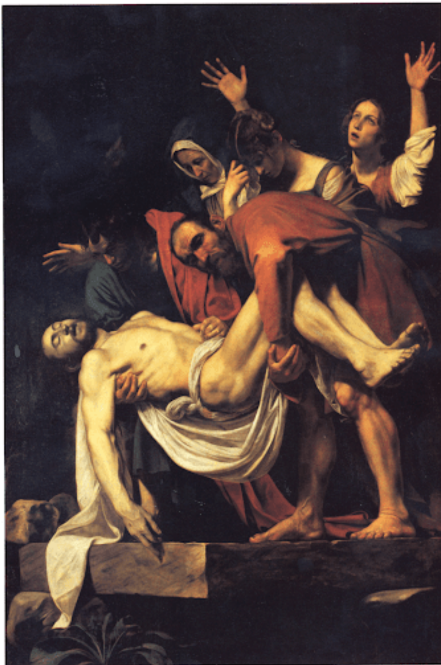
Slika 14: Michelangelo Merisi de Caravaggio, Polaganje Krista u grob , 1602.-1604.