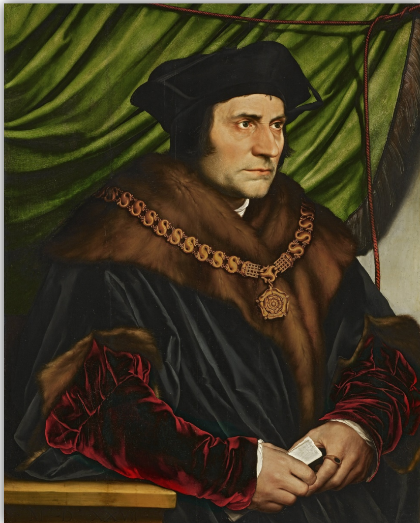
Slika 2. Hans Holbein mlađi, Portret Thomasa Morea , 1527.