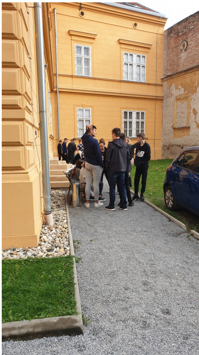
Slika 17. Skupina 4, pripremni i istraživački postupak

studenata Akademije namjeravali prirediti dramatični prikaz napada na svećenika, nemir i spokoj koji se odvijaju na slici Sesije. Obzirom kako je priprema predugo trajala, a kamera je snimala za vrijeme pripreme, iz nepoznatog razloga obrisan je čitav video zapis.