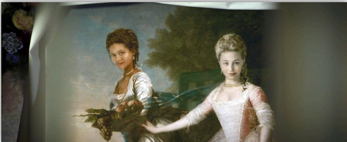
Slika 4. Scena iz filma Belle , 2013. na kojoj je prikazan rad na portretu djevojaka