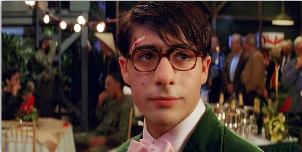
Slika 1. Rushmore , 1998.