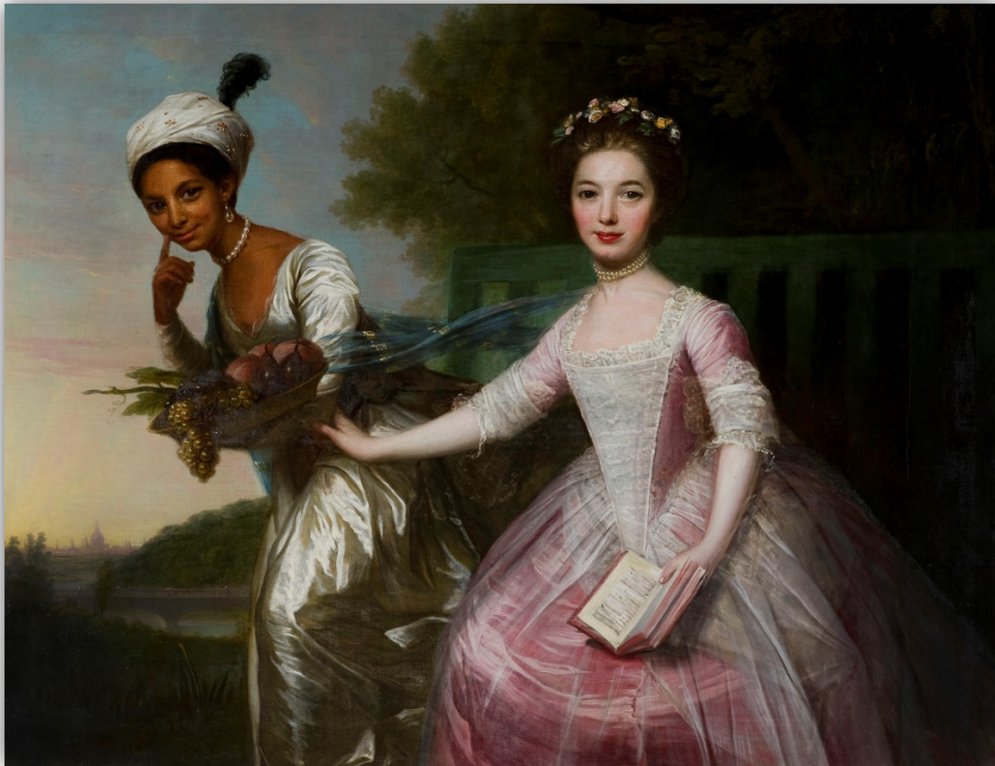
Slika 5. David Martin, Bez naziva, 18. stoljeće