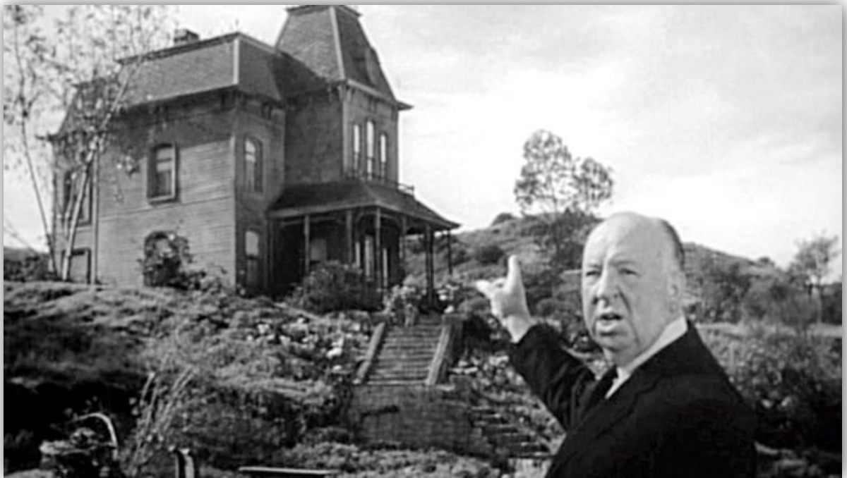
Slika 7. Alfred Hitchcock, Psiho , 1960.