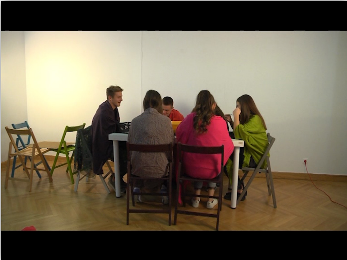
Slika 11. Skupina 1, reinterpetacija umjetničkog djela, Vincenta Van Gogha, Ljudi koji jedu krumpir

Video zapis reinterpetacije Skupine 1 dostupan je za pregled preko poveznice https://vimeo.com/378234108 nakon unosa zaporke „RadionicaMLU321“ bez navodnih znakova.