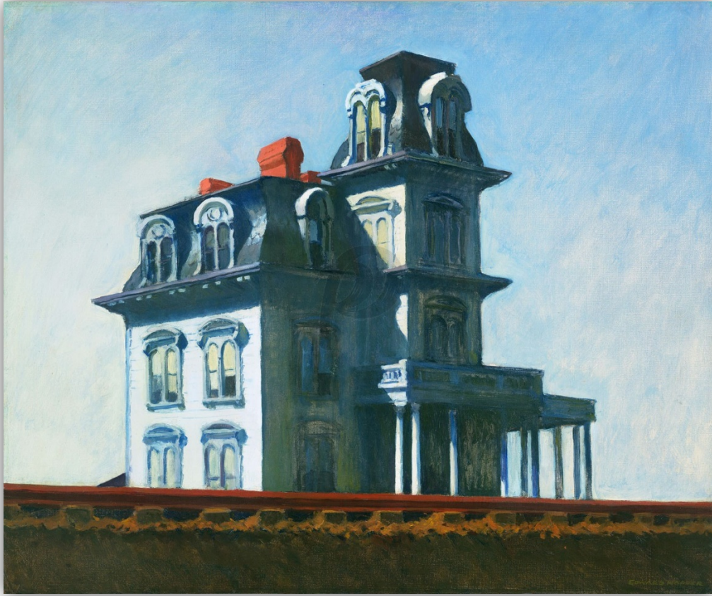
Slika 6. Edward Hopper, Kuća uz željezničku prugu , 1925.