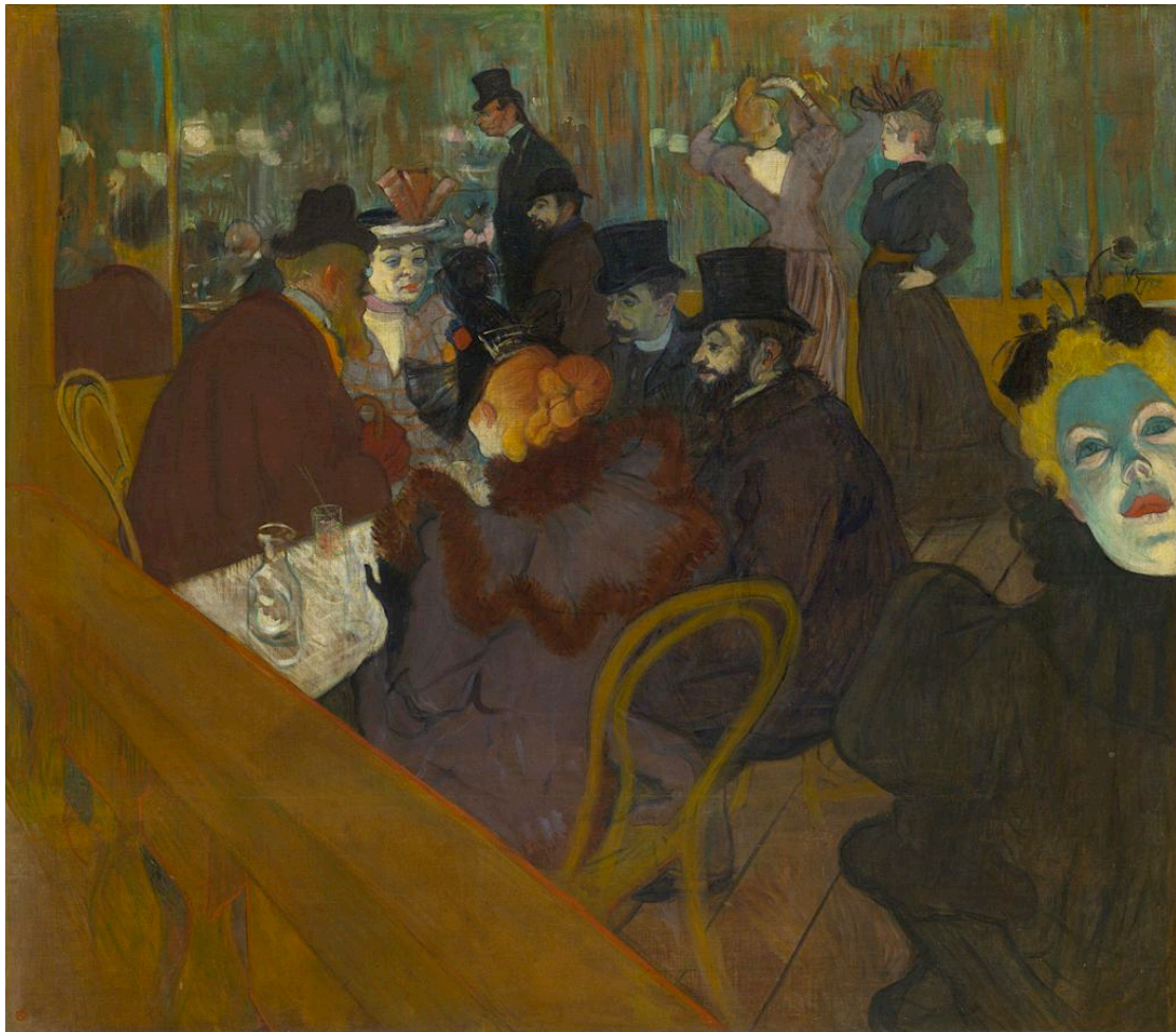
Slika 12. Henri de Toulouse-Lautrec, U Moulin Rougeu , 1892.-1895.

Skupina se sastojala od devet učenika i dvoje studenta Akademije za umjetnost i kulturu u Osijeku koji nisu sudjelovali u izvedbi reinterpretacije. Učenici su radionicu odradili u prostoru predviđenim za radionice unutar Muzeja likovne umjetnosti. Pomoću pripremljenog materijala kojem su učenici mogli pristupiti putem stranice thinglink.com (https://www.thinglink.com/scene/1249358398806294530) , učenici su imali trideset minuta za pripremu reinterpretacije umjetničkog djela. Obzirom kako je radnja Lautrecove slike smještena u noćne sate ugostiteljskog objekta u Parizu (vidi Sliku 12.), učenici su odlučili pristupiti temi na jednak način. Okupili su se oko stola te pomoću plastičnih čaša i boce ljepila za drvo simulirali večernje pijančevanje u noćnom baru. Učenici su preko pametnog telefona pustili glazbu koja je najbolje odgovarala zamišljenoj reinterpretaciji, uz koju su dvije učenice plesale u pozadini. Ostatak učenika je sjedio za stolom, simulirali opijanje i kartanje, dok je