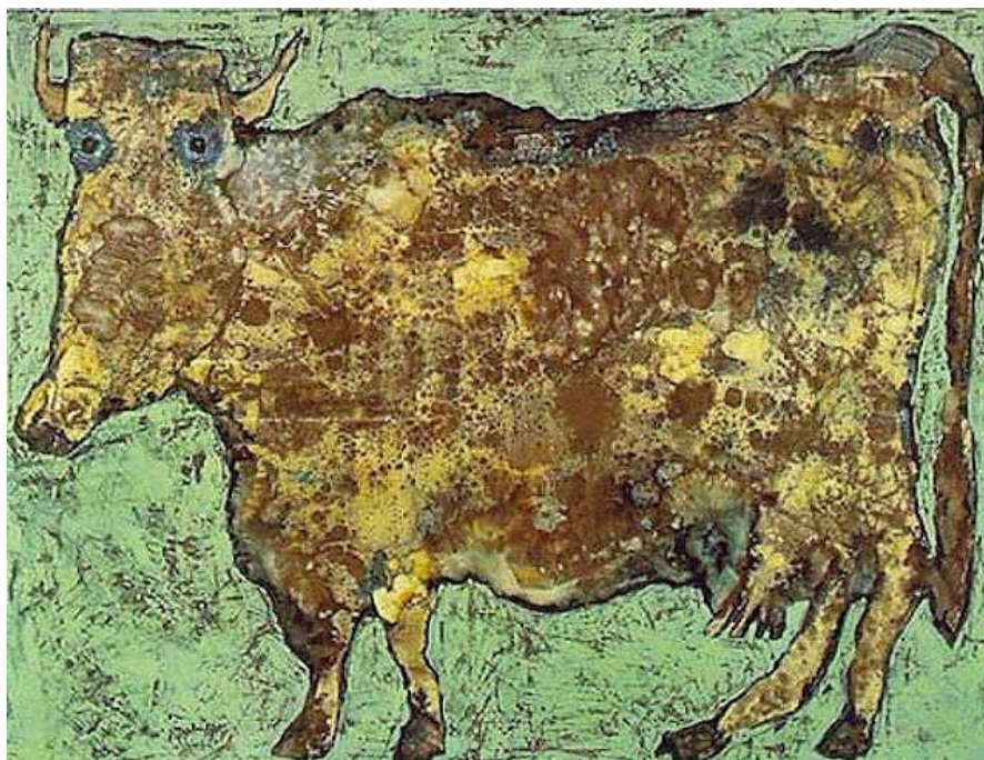
Slika 2: Krava sa suptilnim nosom (1954.), Ulje i emajl na platnu, Muzej moderne umjetnosti, New York