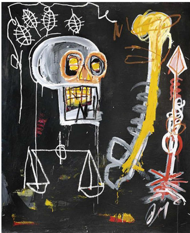
Slika 4: Untitled (1982.), akrilna i uljna boja nalijepljena na platnu, vlasništvo Jean-Michel Basquiata

Jean-Michel Basquiat izronio je s punk scene u New Yorku kao izvrsni, ulični, crtač grafita koji je uspješno prešao iz svog centra grada u međunarodni krug umjetničkih galerija. U nekoliko brzorastućih godina Basquiat brzo se uzdignuo da postane jedan od najcjenjenijih, a možda i najomraženijih američkih naif slikara široko proslavljenog umjetničkog pokreta neoekspresionizma.