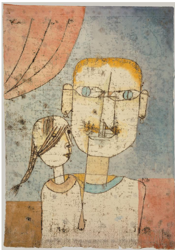
Slika 3: Adam i Mala Eva, 1921, Akvarel i tuš na papiru, 31,4 x 21,9 cm. Metropolitan Museum of Art, New York

poslužile su kao inspiracija za njujoršku školu, kao i mnoge druge umjetnike 20. stoljeća. Klee je rođen u blizini švicarskog Berna, a umjetnost je studirao u Münchenu. Godine 1912. njegov je rad uvršten u drugu izložbu ekspresionističke skupine Blaue Reiter (Plavi jahač) . Iste godine u Parizu je vidio izložbu kubističkih slika koje su itekako utjecale na njegov stil. Klee je deset godina proveo kao učitelj u Bauhausu, zajedno s Kandinskim. Nacisti su ga 1933. otpustili s učiteljskog mjesta na Akademiji u Düsseldorfu, a njegov je rad uvršten u izložbu Degenerate Art . Vrlo inventivan i plodan umjetnik, Klee je tijekom svog života proizveo oko devet tisuća komada, radeći obično u malim razmjerima.