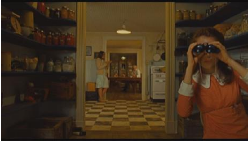
Slika 7: Scena iz filma Moonrise Kingdom

organiziran, iznimno pažljivo kalkuliran, a specifične informacije koje se otkrivaju tijekom tih kadrova predstavljaju prvi korak u kojemu gledatelji mogu suosjećati s protagonistima.