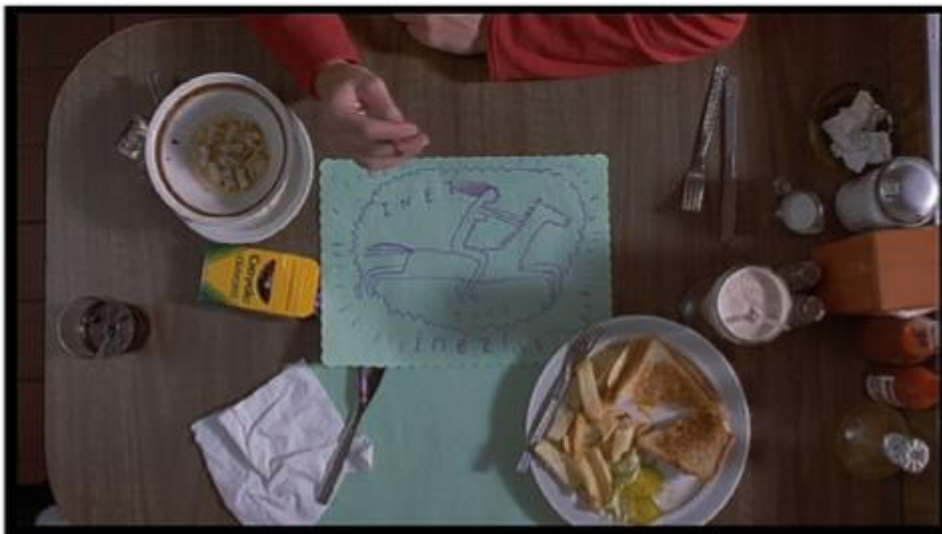
Slika 10: Ptičja perspektiva u filmu Bottle Rocket

U sceni kada Bob odlazi u autu, Anthony i Dignan odlaze u kafić. Dok Dignan osuđuje Bobovo ponašanje, Anthony crta lik Inez (njegove ljubavi) po zelenom papiru. U kadru iz ptičje perspektive prikazan je taj crtež – Inez jaše malog konja, a oko nje lete iskre. Anthonyjeva maštovita skica vrlo je važna u ovom narativnom trenutku, ne samo jer prikazuje njegovu nezainteresiranost za Dignanovu priču, nego jer prikazuje njegovo emocionalno stanje.