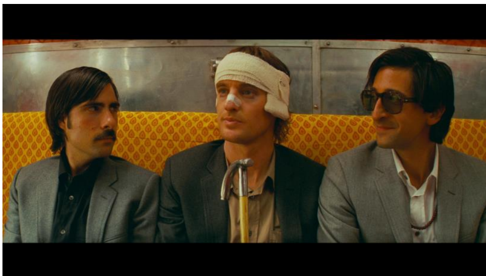
Slika 8: Blizi kadar u filmu The Darjeeling Limited

U ovom filmu koriste se blizi kadrovi kako bi prikazali lica glavnih likova, braće Francisa, Petera i Jacka, koji sjede jedan do drugoga ispred kamere. Sličnu scenu imamo u trenutku sprovođa indijskog dječaka koji se utopio u rijeci. U toj sceni, stanovnici sela i trojica braće stoje mirno, nema glazbe niti dijaloga, a likovi su poredani pravilno. Blizi kadrovi u ovoj sceni navode gledatelje da se fokusiraju na trenutak.