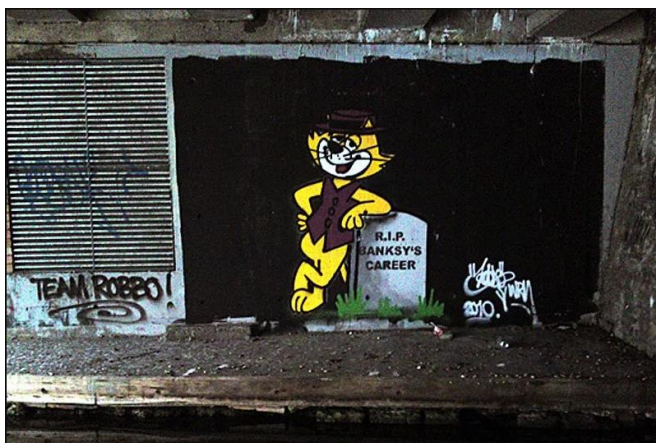
Slika 10. King Robbo, Bez naziva , 2010.