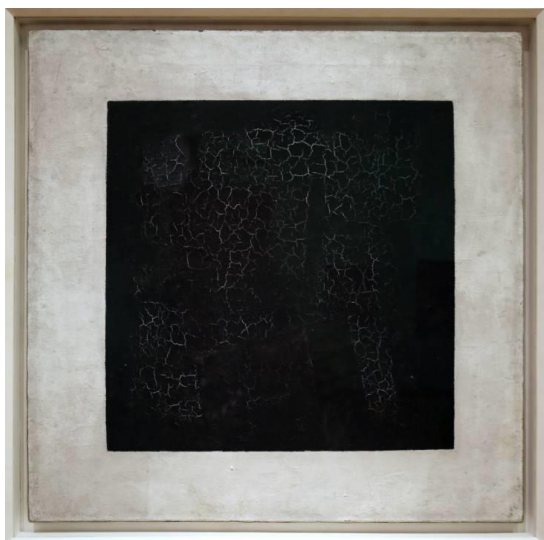
Slika 17. Kazimir Maljevič, Crni kvadrat , 1915.