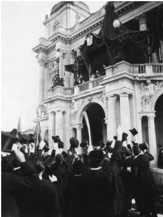
Slika 1: Svečano otvorenje kazališne zgrade 14.10.1895.

listopadu 1895. godine sagrađena i otvorena nova zgrada Hrvatskog narodnog kazališta kakvu mi danas poznajemo. (Slika 1 i slika 2)