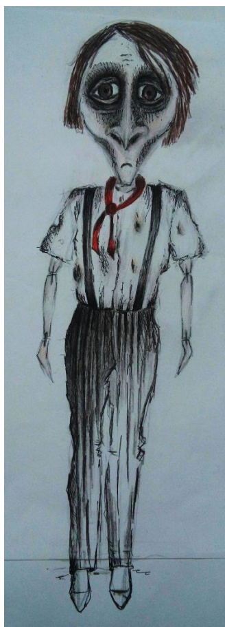
Slika VII. Pilot, skica