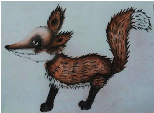
Slika XI. Lisac, skica