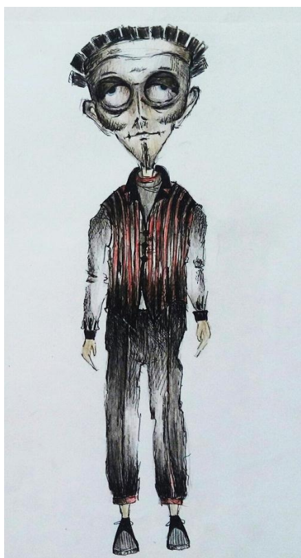
Slika III. Skica hvalisavca