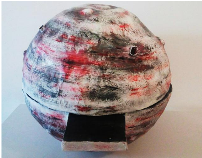
Slika XV. Planet