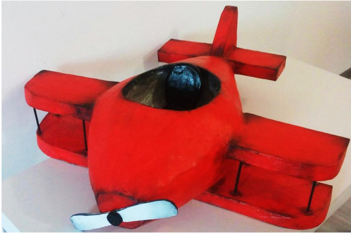
Slika XIV. Avion