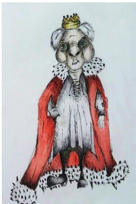
Slika I. skica kralja