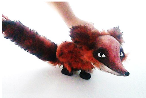
Slika XII. Lisac, lutka