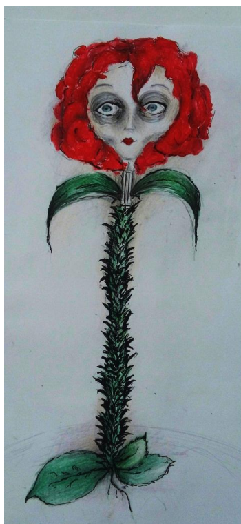
Slika XIII. Ruža, skica