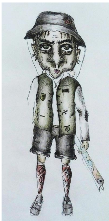
Slika II. skica zemljopisca