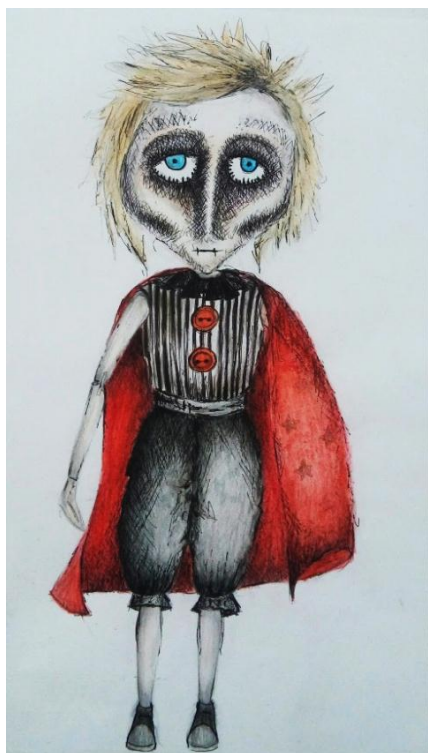
Slika V. Mali princ, skica