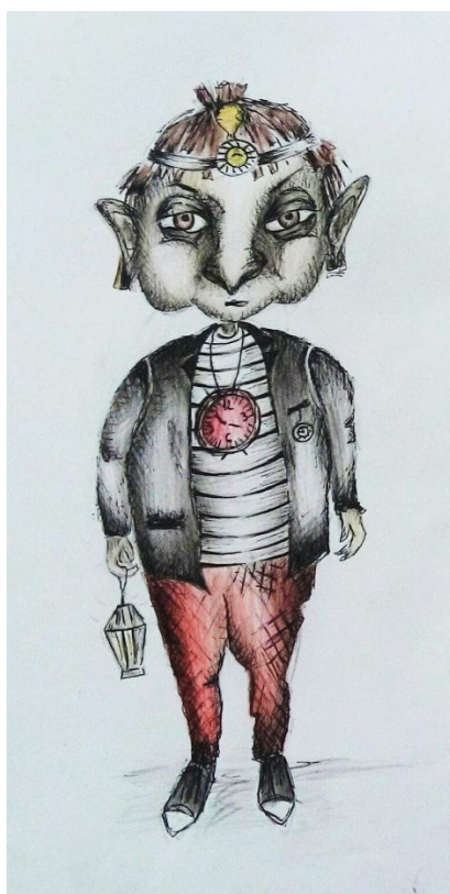
Slika IV. skica noćobdije