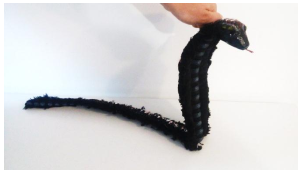
Slika X. Zmija, lutka

Lutka je napravljena vrlo jednostavno. Tijelo je oblikovano od tanke spužve, dužine 70 cm, presvučeno u deblju, čvrstu crnu tkaninu, a gornji dio, od glave do sredine tijela, sa svake strane dodatno je proširen i napunjen vatelinom, kako bi zmija poprimila izgled kraljevske kobre. Krajevi su prošiveni i dodatno naglašeni crnim krznom koji zmiju prikazuju kao moćnu vladaricu te okrutnu gospodaricu smrti. Zmijaska koža različita je s gornje i donje strane, tako je donji dio kojim se kreće po tlu, ukrašen nizom sivih tankih trakica, koje osim što joj daju tu specifičnu zmijsku teksturu, razbijaju crnilo, stvaraju poveznicu sa svim ostalim likovima. Gornji dio tijela prošaran je bijelim i crvenim šarama. Glava je modelirana iz stiropora, zatim kaširana i obojana sjajnim crnim lakom. Najvažniji dio, u kojem se zapravo očituje sav njezin zmijski karakter, su oči. Kričavo žute, kosog oblika, podmukle oči iz kojih isijava zlo. Uz oči, tanki isplažen i kričavo crveni jezik, ono je što ju čini opasnom i strašnom. Što se tiče animacije, cijela lutka je pokretna. Može se savijati, može stajati uspravno. Glava je za tijelo pričvršćena tapetarskom trakom te je na tom dijelu i vodilica koja ju čini pokretnom, ali i drži cijelu lutku.