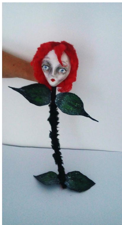
Slika XIV. Ruža, lutka

Ružu sam odlučila prikazati djelomično antropomorfno. Način na koji princ komunicira s njom, riječi kojima je opisuje, za njega je ona puno više od same ruže. Kod oblikovanja i kreiranja, odlučila sam se na kombinaciju ljudskih karakteristika, ali da ostane vizualno jasno kako se stvarno radi o ruži. Glava je modelirana iz stiropora, a zatim kaširana. Veličinom je manja od ostalih lutaka, ali je vrlo detaljna. Kako lice vrlo jasno predstavlja kakav je lik, usmjerila sam pažnju na njega. Njezina samodopadnost i narcisoidnost vidljiva je u samim crtama lica. Aristokratski svijetla put sa istaknutim jagodicama, velike plave oči, pomalo umišljenog pogleda, s podignutim obrvama, čine je upravo takvom, kao da je iznad svih. Iako se nalazi u središtu, nos se ne ističe pretjerano. Velika, upečatljiva, žarko crvena kosa napravljena od vatelina, prikazuje njezine latice, nešto bez čega njezina ljepota ne bi ni postojala. Vrat je napravljen od drvene tiple, probušene po dužini i širini. Kroz rupice po širini provučena je elastična gumena traka na koju su pričvršćeni veliki sjajni kaširani listovi, koji ruži daju gracioznost. Kroz dužinu je također provučena elastična guma koja u ovom slučaju, čini ružino tijelo, odnosno stabljiku. Guma je presvučena zeleno-crnim krznom čiji špičasti rubovi podsjećaju na trnje. Na taj način postigla sam da je čitavo tijelo animabilno, i to u svim smjerovima. Glavna i jedina vodilica je u glavi, što i glavu, također, čini pomičnom.