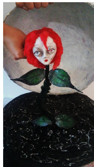
Slika XVI. Ruža na otvorenom planetu

Ono što bih izdvojila kao glavno odabrano sredstvo oblikovanja scenskog prostora za potrebe lutkarske inscenacije Malog princa je rasvjeta. Svjetlo ima veliku moć u stvaranju atmosfere te neke iluzije koja je pristuna u bajkama, ali također, može poslužiti kao sredstvo izražavanja osjećaja određenih likova. Ono što me zapravo dovelo do svjetla je pitanje: kako najbolje prikazati i dočarati svijet mašte ili stvoriti iluziju? Upravo svjetlom. Nije opipljivo, ne zauzima prostor, ali otvara bezbroj mogućnosti i upravo je to na sceni potrebno. Svjetlom možemo prikazati dan, noć, sreću, tugu, melankoliju, napetost, opasnost, sve što želimo. Ovo djelo je specifično, posjeduje veliku dubinu, i smatram da obični elementi scenografije, jedna vrsta ilustrativnosti, ne bi mogli prikazati ono što svjetlo može. Uz sve to, scensko svjetlo stvara poseban ugođaj intimitete te daje potrebnu dozu dinamičnosti, koja je ovoj predstavi svakako potrebna.