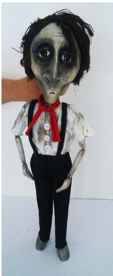
Slika VIII. Pilot, lutka

Veličina lutke je 45 cm, glava, kao i kod ostalih lutaka, nije proporcionalna tijelu. Izduženog oblika s izraženim jagodničnim kostima, oštre crte lica, velike tužne smeđe oči, dugačak i špičasti nos širokih nosnica te uska brada, daju mu pomalo starački, ali i zagonetan izgled. Bore oko očiju i na čelu simboliziraju njegovo bogato iskustvo, ali i teške situacije koje su ga obilježile tijekom čitavog života. Lice sam oslikala sivim, tmurnim tonovima s izrazito tamnim sjenama oko očiju i samog gornjeg dijela. Neuredna smeđa kosa, prošarana sijedim pramenovima, osim što govori o teškim uvjetima u kojima se nalazi (pustinja) pokazuje i njegovu dob, iskustvo i mudrost. Mršavo tijelo, dugačkih udova te širokih ramena, odličan je pokazatelj kako je u dobroj fizičkoj formi, ali bez unutarnje snage. Lutka koja ga prikazuje, zamišljena je kao potpuna suprotnost onoj koja prikazuje lik Malog princa. Njegova odjeća je u skladu s tim. Pilot je pripadnik plemićke obitelji. Odjeven je u bijelu košulju i tamne hlače s naramenicama s decentnim prugama, a oko vrata ima crvenu maramu koja mu daje ležeran i