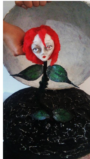
Slika XVI. Ruža na otvorenom planetu

Ono što bih izdvojila kao glavno odabrano sredstvo oblikovanja scenskog prostora za potrebe lutkarske inscenacije Malog princa je rasvjeta. Svjetlo ima veliku moć u stvaranju atmosfere te neke iluzije koja je pristuna u bajkama, ali također, može poslužiti kao sredstvo izražavanja osjećaja određenih likova. Ono što me zapravo dovelo do svjetla je pitanje: kako najbolje prikazati i dočarati svijet mašte ili stvoriti iluziju? Upravo svjetlom. Nije opipljivo, ne zauzima prostor, ali otvara bezbroj mogućnosti i upravo je to na sceni potrebno. Svjetlom možemo prikazati dan, noć, sreću, tugu, melankoliju, napetost, opasnost, sve što želimo. Ovo djelo je specifično, posjeduje veliku dubinu, i smatram da obični elementi scenografije, jedna vrsta ilustrativnosti, ne bi mogli prikazati ono što svjetlo može. Uz sve to, scensko svjetlo stvara poseban ugođaj intimitete te daje potrebnu dozu dinamičnosti, koja je ovoj predstavi svakako potrebna.