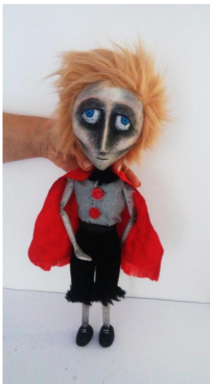
Slika VI. Mali princ, lutka