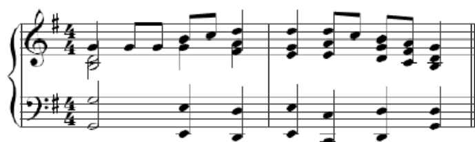
Slika 2: Zadatak iz druge serije

Zadatke za regionalni sluh osmislio je na način da se ispitaniku zadaje jedan ton na klaviru, a on ga mora pronaći.