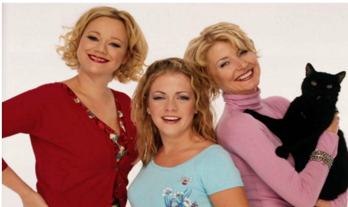
Slika 7. Sabrina the Teenage Witch