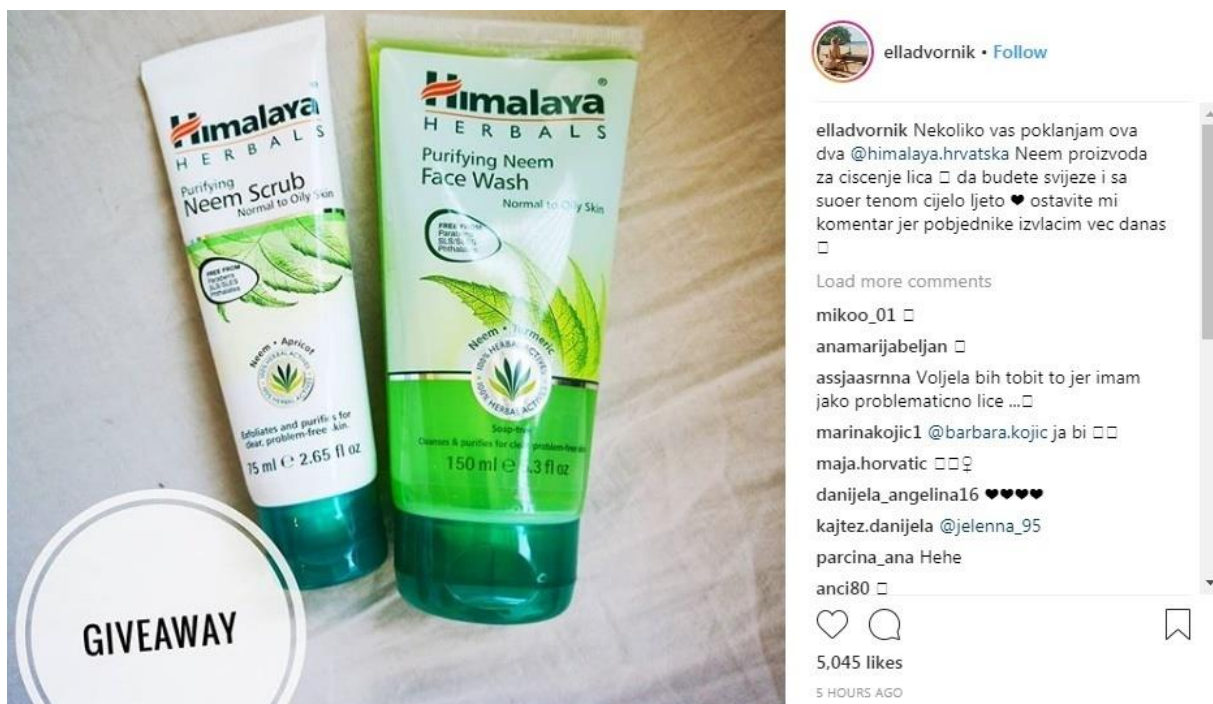
Slika 9: Primjer giveaway