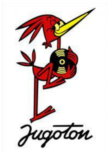
Slika 1. Zaštitni znak Jugotona

Upravo iz tog razloga uprava Jugotona osmišlja zaštitni znak odnosno maskotu koja predstavlja njihov lik i djelo. Naime, radi se o ptici (žuni) koja u svojim rukama drži gramofonsku ploču. Ilustracija je djelo Slavka Drobnića u čijem su studiju nastali brojni reklamni spotovi.