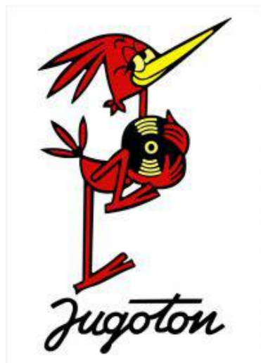
Slika 1. Zaštitni znak Jugotona

Upravo iz tog razloga uprava Jugotona osmišlja zaštitni znak odnosno maskotu koja predstavlja njihov lik i djelo. Naime, radi se o ptici (žuni) koja u svojim rukama drži gramofonsku ploču. Ilustracija je djelo Slavka Drobnića u čijem su studiju nastali brojni reklamni spotovi.