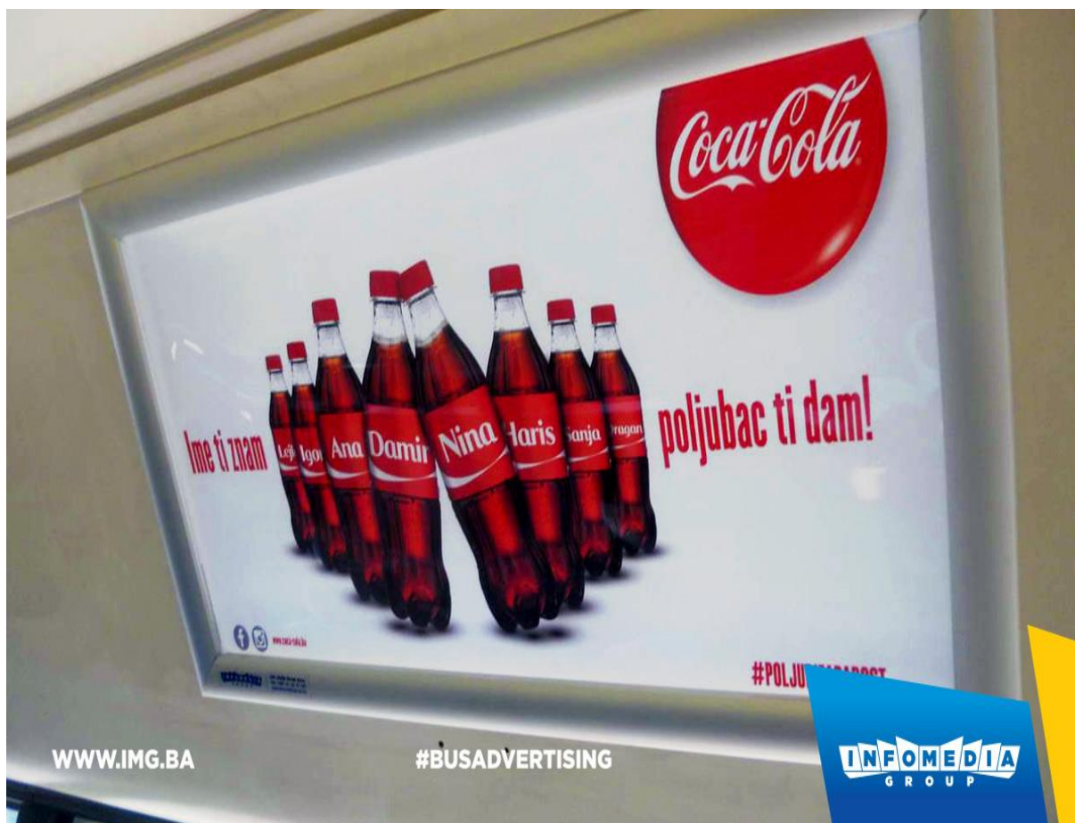
Slika 3 – indoor oglašavanje brenda Coca-Cola