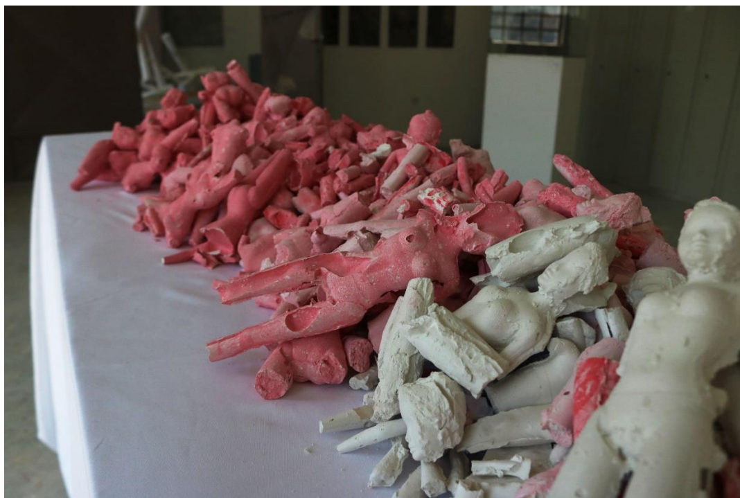
Slika 13,-dio cjeline 2