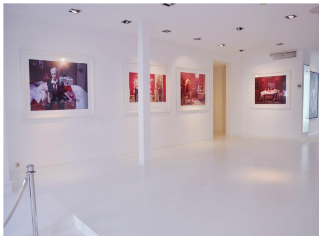
Slika 1, Slika 2, - Dina Golstein- In the Dollhouse, izvor http://inthedollhouse.net/exhibitions/ 10