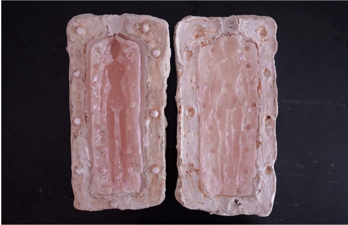
Slika 10, -kalup 1