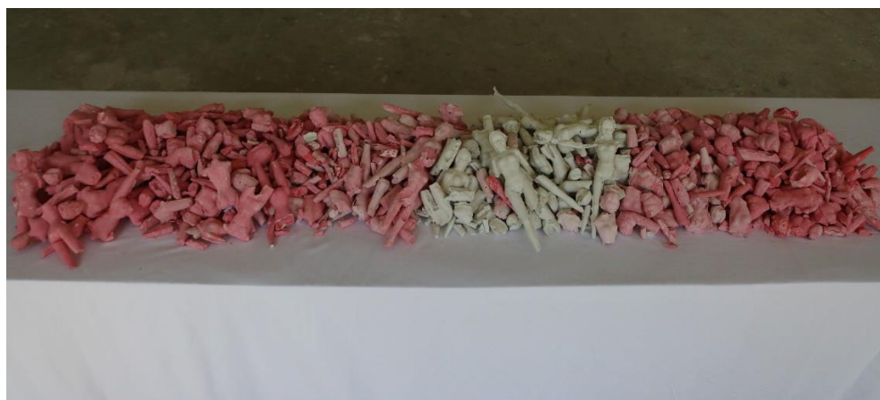
Slika 15,- Barbie 2