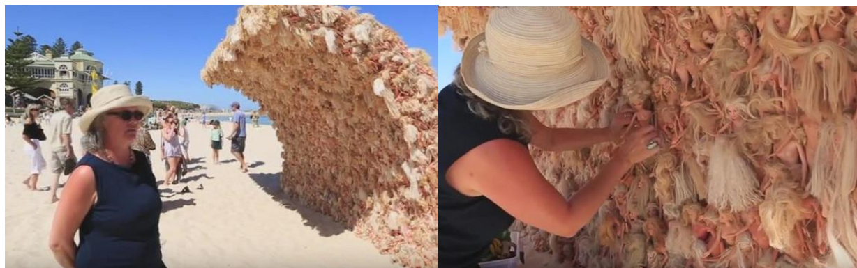
Slika 4, slika 5- Anet Tas- Val barbika, izvor https://www.blic.rs/slobodno-vreme/ovo-je-najbizarnije-umetnicko-delo/wgqge71

Ogorman val koji izgleda kao da se idiže iz pijeska a visok je skoro tri metra i dugačak četiri metra. Val je napravljen od preko tri tisuće Barbika. Belgijskoj umjetnici Anet Tas su kao inspiracija poslužile uspomene iz djetinjstva. Po njenim riječima, skulptura je simbol svih osobnih priča bivših vlasnika lutaka koje je kupovala u trgovinama polovne robe. Htjela je na univerzalan način predstaviti taj dragocjen i kratak period života koji nazivamo djetinjstvom, kroz predmet koji je simbol igre i bezbrižne adolescentske zabave. 12