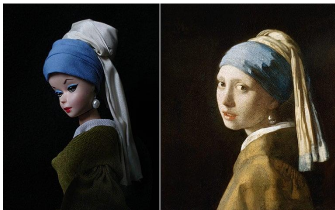
Slika 6, -Joselyn Grivaud-Vermeer's Girl with a Pearl Earring, izvor

https://www.theguardian.com/artanddesign/gallery/2012/jan/29/fine-art-posed-by-barbies