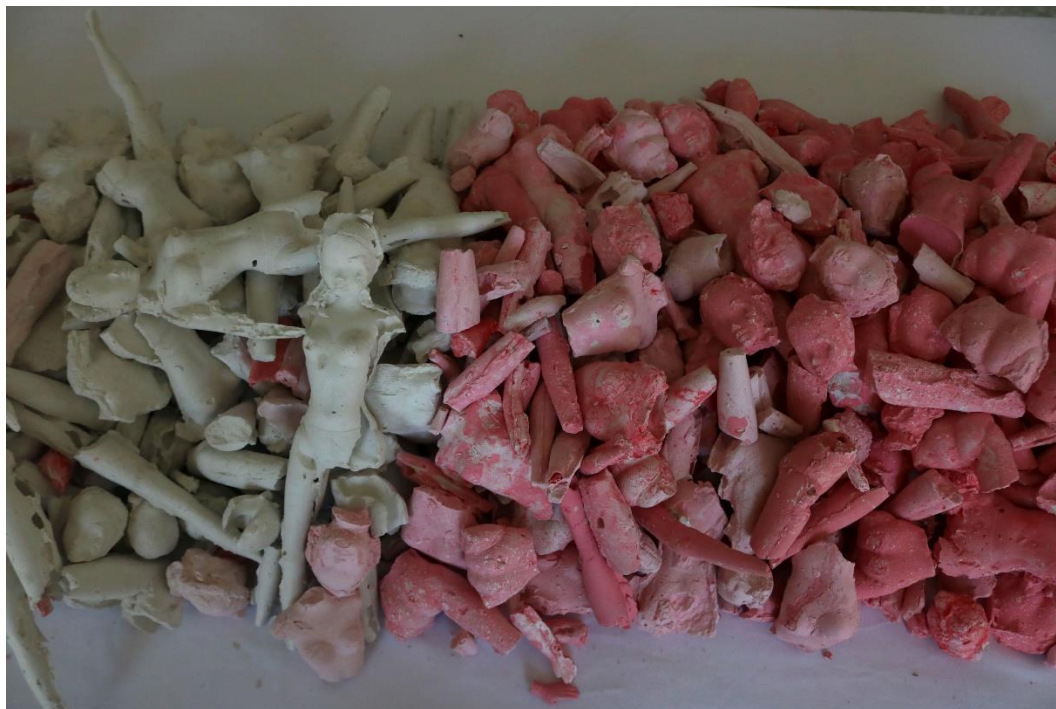
Slika 12, -dio cjeline 1