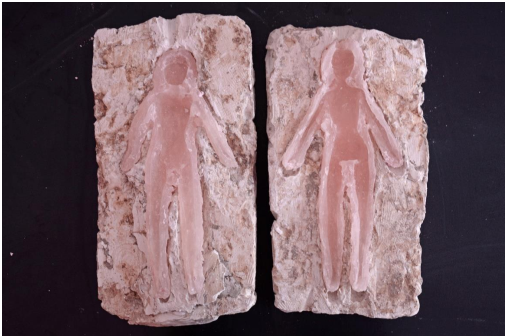
Slika 11,- kalup 2