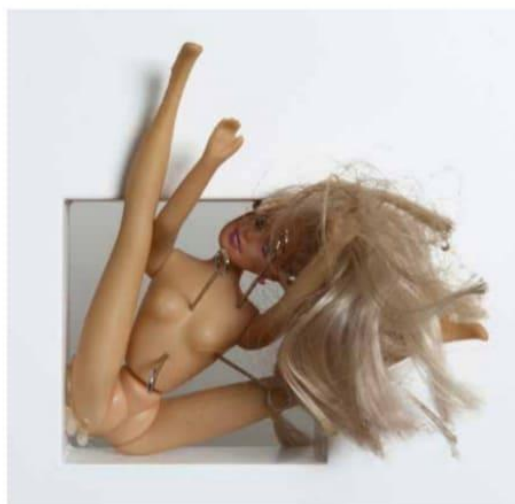
Slika 8, slika 9 - Fashion Talks, detalji / dettagli http://paulinajazvic.hr/pdf/catalog5.pdf