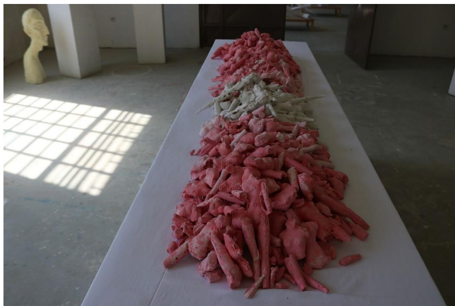
Slika 14,- Barbie 1

Odlivene dijelove izložila sam sve zajedno, isprepletene međusobno. Postavljene na stolu prikazuju ljudsko meso koje je izloženo pogledima drugih ljudi. Time želim sugerirati na tijela korigirana utjecajem tuđih mišljenja, medija i trendova. Postavljajući nam na pladnju reklame nečega što je moderno prihvaćeno bezupitno je li to korisno za nas ili ne. Uz mijenjanje naše vanjštine, mijenja se i ljudska svijest. Sukladno tome izloženost uništenih i destrukturnih lutaka aludira na poticanje izlaganja ljudi svijetu u obliku kojem jesu sa svojim umom i osobnošću, kvalitetama koje nas najviše razlikuju jedne od drugih.