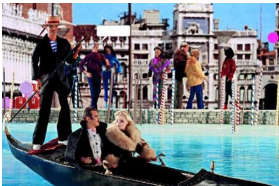
Slika 10, bez naziva, https://www.culturenet.hr/print.aspx?id=8117 17