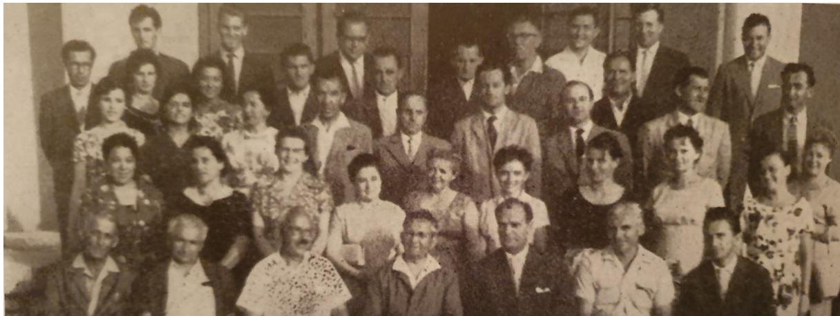
Slika 2. Skupina gradišćanskih Hrvata s nastavnicima na glazbenom tečaju u Crikvenici 1960. godine