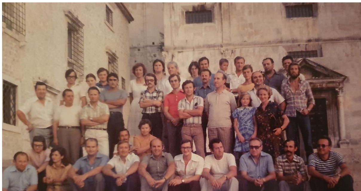
Slika 3. Polaznici i predavači Seminara za dirigente tamburaških orkestara i voditelje malih sastava u Zadru 1977. godine