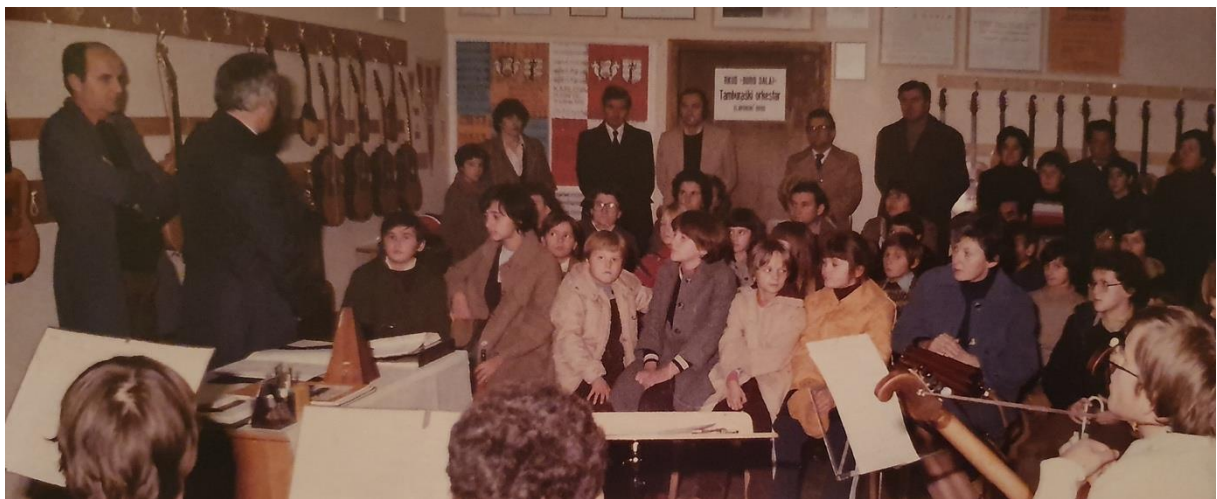
Ferić (2011: 279).