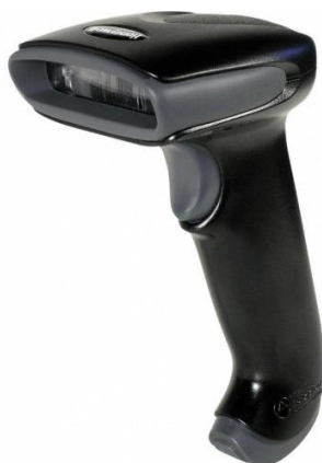
Slika 1. Ručni skener

Kod odabira uređaja za digitalizaciju ustanova mora se brinuti o svojim resursima te o tome kakvu će građu digitalizirati. O ulozi digitalizacije u Smjernicama za odabir građe za digitalizaciju (2007:16) definirano je da u obavljanju osnovnih funkcija ustanove i o planiranome opsegu ovisi odluka o tome hoće li se digitalne preslike izrađivati u samoj ustanovi, što bi podrazumijevalo nabavu potrebne opreme i osiguranje osoblja koje će njome raditi. Tekstualna i slikovna građa digitalizira se skenerima i fotoaparatom. Skeneri se dijele u dvije skupine: koračne i protočne. Prema Janeš (2003:101), kod odabira skenera treba obratiti pozornost na optičku rezoluciju, dubinu boje, vrstu konektora koji utječe na brzinu skeniranja i dimenzije. Koračni skeneri mogu samostalno skenirati građu samo ako se radi o pojedinačnoj građi postavljenoj za skeniranje. Stančić (2009:34) je podijelio skenere na ručne, plošne, skenere za mikrooblike, rotacione, 3D skenere i skenere za knjige. Ručni skeneri sliku stvaraju prelaženjem preko građe. Za rukovanje njima potrebno je konstantno i jednolično pomicanje skenera, pri čemu je mirna ruka od presudnog značenja. Ovi skeneri daju relativno loše rezultate kada je riječ o boji.