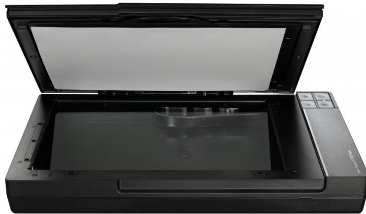
Slika 2. Plošni skener

Plošni skeneri ili stolni, reflektivni skeneri najčešće su korišteni kod digitalizacije građe. Prema Stančiću (2009:34-35), plošni skeneri uspješno skeniraju sve vrste dvodimenzionalnih plosnatih predmeta kao što su dokumenti, fotografije, crteži i grafike, knjige, umjetnička djela te blago trodimenzionalne predmete poput novčića, nakita i drugo. Zbog male veličine izvornika plošni skener postiže manju rezoluciju što daje rezultat slike s nižom kvalitetom. Postoje A4 i A3 modeli plošnog skenera koji su jeftini te se njima može jednostavno rukovati, dok su veći modeli do A0 formata skupi i isplate se jedino u dugoročnim projektima.