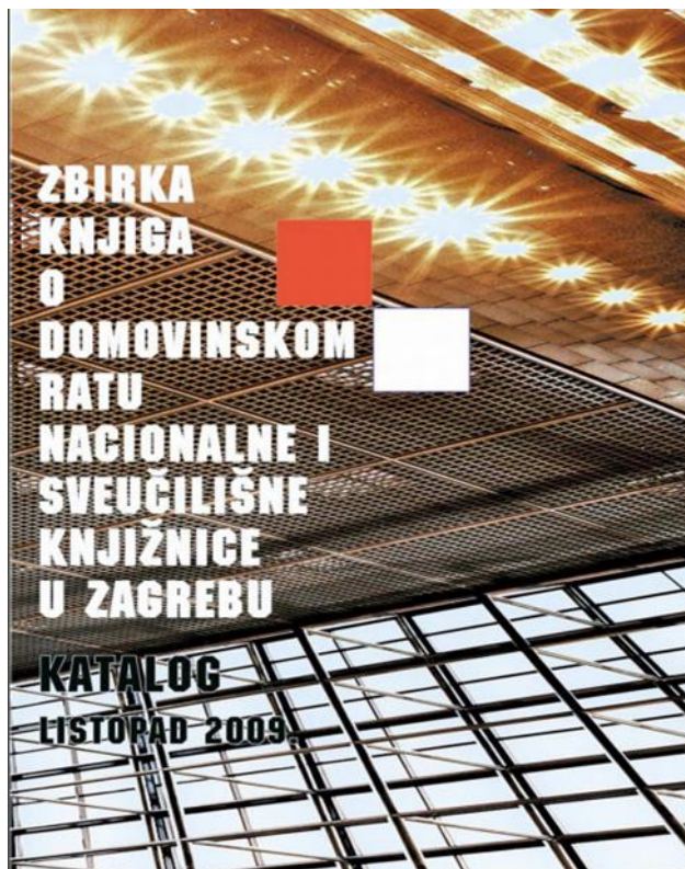
Slika 5. Zbirka knjiga o Domovinskom ratu Nacionalne i sveučilišne knjižnice u Zagrebu

Maštrović (2014:95) navodi kako su u čitaonici gdje je smještena Zbirka knjiga o Domovinskom ratu izloženi samo oni primjerci građe koji ne pripadaju u obvezne primjerke nacionalne zbirke knjiga Croatice koji se još nazivaju „arhivci“. Autor tvrdi kako je to u skladu sa stručnim i zakonskim zadaćama Knjižnice u zaštiti temeljnog fonda nacionalnog knjižničkog gradiva, koji se još naziva i nacionalnom memorijom.