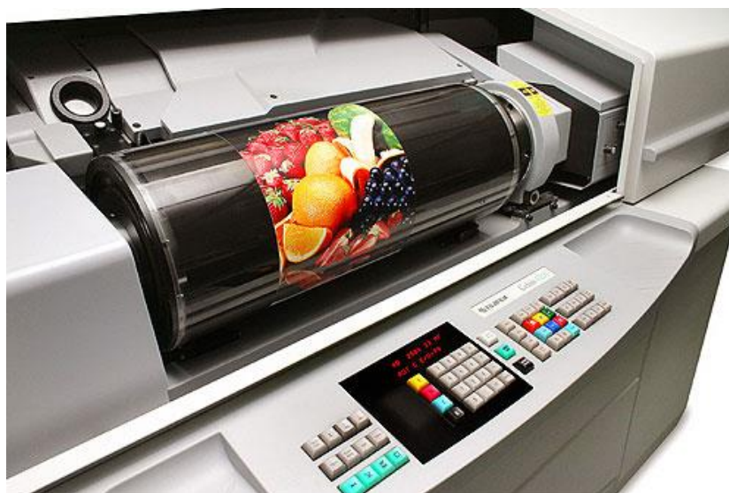
Slika 3. Rotacioni skener

Profesionalni studiji za digitalizaciju, prema Stančiću (2009:37), većinom koriste rotacione skenere koji daju sliku visoke kvalitete. Ovom vrstom skenera moguće je skeniranje isključivo one građe koja se nalazi u zasebnim savitljivim listovima ili na dijapozitivima i negativima. Prije korištenja ovim skenerima potrebno je zatražiti mišljenje osobe koja je zadužena za zaštitu građe.