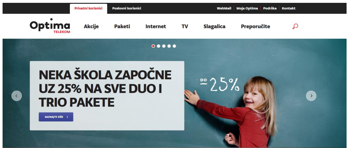
Slika 3. Mrežna stranica Optima Telekoma

U ovom videozapisu ubačena je klasična ugodna glazba motivirajućeg karaktera, prikazani su sretni ljudi svih uzrasta, od obitelji s djecom, seljaka na farmi s konjem, studenata koji diplomiraju, poslovnih ljudi pa sve do starijih ljudi u bazenima. Glas koji ide kroz video govori „vrijedna smo i pametna nacija, želimo raditi više i dati najbolje od sebe“ s time Hrvatski Telekom pokazuje da cijeni Hrvatsku i njen narod i generalno apelira na domoljublje. Govore kako bi i starije upoznali s novim tehnologijama što pokriva onu pretpostavku da se stariji slabije snalaze s novim uređajima pa time proširuju ciljnu skupinu gdje će zainteresirati ljude i pružati svoje usluge. Spominju kako nove tehnologije mogu spasiti i živote te se pred sam kraj videa spominju oni sami kao „heroji“ priče gdje kažu da vjeruju da svi trebaju jednak pristup tehnologiji te iz tog razloga razvijaju mreže. Još je bitno napomenuti da kroz cijeli video ide glazba i kako video prolazi sve viši tonovi se pojavljuju što probuđuje emocije kod potrošača.