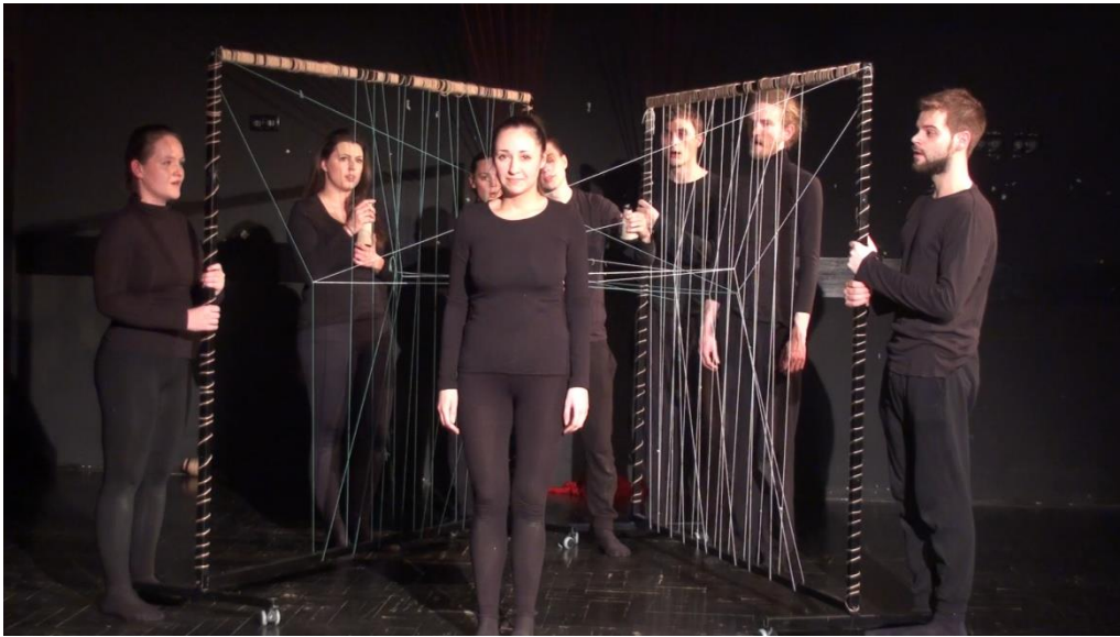
Slika 3: Scena inspirirana pjesmom: „Elma“

njihove konce. Daljnji razvoj pletenja obavljaju ljubavnici u dinamičnoj i nespretnoj igri između dva okvira što simbolizira njihov zajednički život sa svim usponima i padovima.