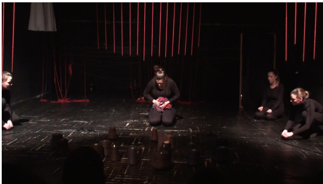
Slika 4: Spuštanje crvenih niti sistemom kolotura

Ne klepeći nanulama. Predmetima poput stolice za ljuljanje, kante te užeta za rublje nastojali smo stvoriti atmosferu toplog majčinskog doma koji će animacijom oživjeti pred očima publike i pokrenuti lavinu sjećanja. Najkompliciraniji scenografski element predstavljao je mehanizam u sceni inspiriranoj pjesmom Na mezaru majka plače . Zavjesa crvenih niti koja se spuštala sa stropa bila je izrađena uz pomoć niza kukica pričvršćenih na sajle kroz koje smo sistemom kolotura pokretali spomenute niti.