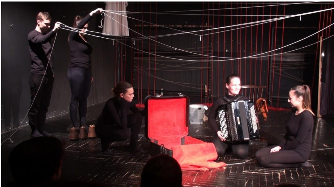
Slika 5: Promjena popraćena pjesmom: „Što je život?“

Svaka scena pomaknula je granice lutkarstva, svaka pjesma izmamila poeziju iz naših unutarnjih svjetova, svi vizualni efekti uspjeli su utkati još duše u sevdalinke, koje su je ionako pune. Jedini zadatak koji je ostao bio je pronaći jedinstveni kod igre koji bi prenio ljepotu nesebičnog kolektivnog dijeljenja i ispreplitanja unutarnjih života svakog od nas. Kako bismo to uspjeli predstavu nismo mogli ostaviti na razini tehničkog izmjenjivanja osmišljenih scena, nego smo ih uz pomoć igranih promjena spajali u cjelinu.