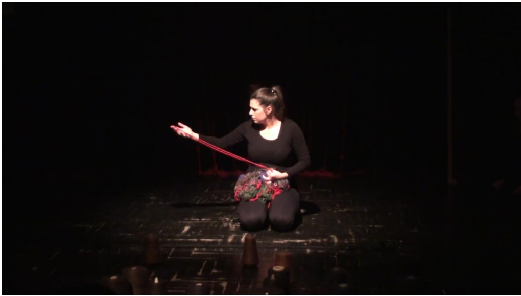
Slika 2: Majka pokreće sjećanje

Željeli smo pokazati majčino ponovno proživljavanje trenutka u kojem je ostala bez djece. Sjećanje je pokrenuo miris, miris djece koji majka osjeti unutar zapletenih konaca koje drži u rukama. U tom trenutku zatvorenih očiju zamišlja djecu u prostoru koju smo opredmetili uz pomoć tri klupka smeđih konaca koji se kreću prema njoj. Nakon toga majka se na nekoliko trenutaka vraća u realnost i ponovno čupa konce u svojim rukama, dok među njima ne pronađe i ne izvuče crvenu nit koja je vraća u trenutak nesreće. Vraća joj se onaj predosjećaj koji je imala u tom trenutku, zbog kojeg poseže za koncima koji predstavljaju njezinu djecu, no pred njom se spušta kavez crvenih niti koji podsjeća na slijevanje krvi po zidovima. Ponovno uzaludno traži pomoć. Svi nestaju sa scene. Primorana je ponovno gledati kako joj djecu odvođe u tamu. S obzirom da smo glumicu „zatočili“ na središtu scene, a sve zlo odigravali izvan njezine moći kontrole pokazali smo stanje uma u kojemu čovjek želi učiniti sve, ali iz nekog razloga nijemo i nepokretno ostaje ukopan u jednom mjestu. Na kraju scene sve se vraća na početak. Crvene niti nestaju, a majka i dalje sjedi i grli rastrgane konce u krilu. Željeli smo prikazati nemoć i sudbinu ljudi koji su zatočeni u prošlosti, kojima je smisao života u sjećanju, jer je to jedino mjesto gdje njihovi voljeni još uvijek postoje.