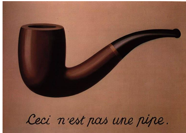
Slika 3. Renée Magritte: „Ovo nije lula“