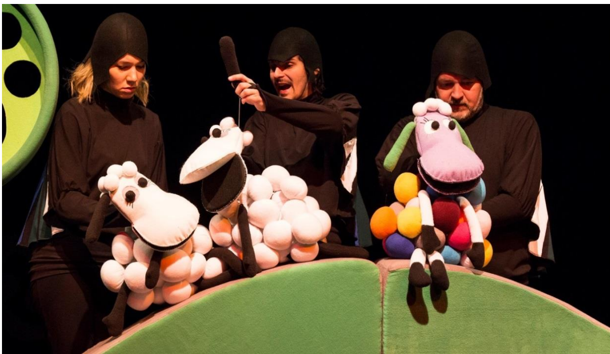
Slika 4. Ovce i Wanda

Napravljene su tehnološki jednako kao Wanda, ali isključivo u crno-bijelim nijansama. Time su Wandin karakter, različitost i neprihvaćenost postavljeni u prvi plan na samom početku predstave. Svaku od njih animira jedan animator