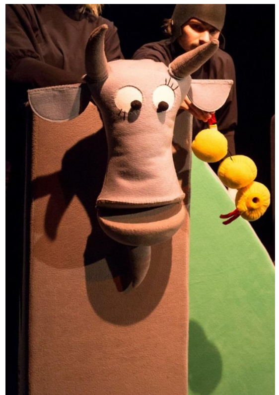
Slika 6. Koza

Lutka koja se sastoji od sivog kvadra koji je dio scenografije na koji se samo prisloni glava načinjena od filca punjenog spužvom. Također ima mogućnost otvaranja usta i odvajanja rogova i ušiju koji su, kao kod mrava, povezani elastičnom špagom. Time što koza kao tijelo ima dio scenografije, odmah se iščitava da je u toj sceni gospodar cijelog prostora. Animira ju jedan animator