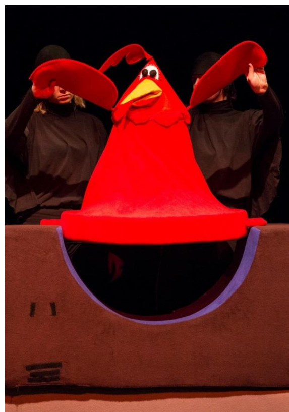
Slika 9. Kokoš

Kokoš je izrađena kao stožac od tkanine koji na dnu ima obruč koji drži oblik, a na vrhu glavu, te sa strane krila. Ova lutka je zijevalica tako da može otvarati kljun. Animiraju je dva animatora. Na početku podsjeća na gnijezdo u koje se pilići skrivaju čime predstavlja pomalo pretjerano zaštitnički nastrojenu majku koja djeci ne dopušta da se druže s Wandom. Krila su također animabilna. Kokoš također ima mogućnost da joj se odvoji gornji dio(glava i krila) kako bi se mogla kretati brže.