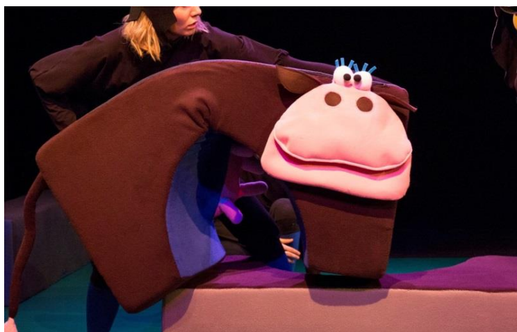
Slika 7. Krava

se neživi predmet na licu mjesta pretvara u živo biće. Iako najmasivnija lutka u predstavi, zbog spužve od koje je građena i dalje je vrlo lagana i poprilično animabilna.