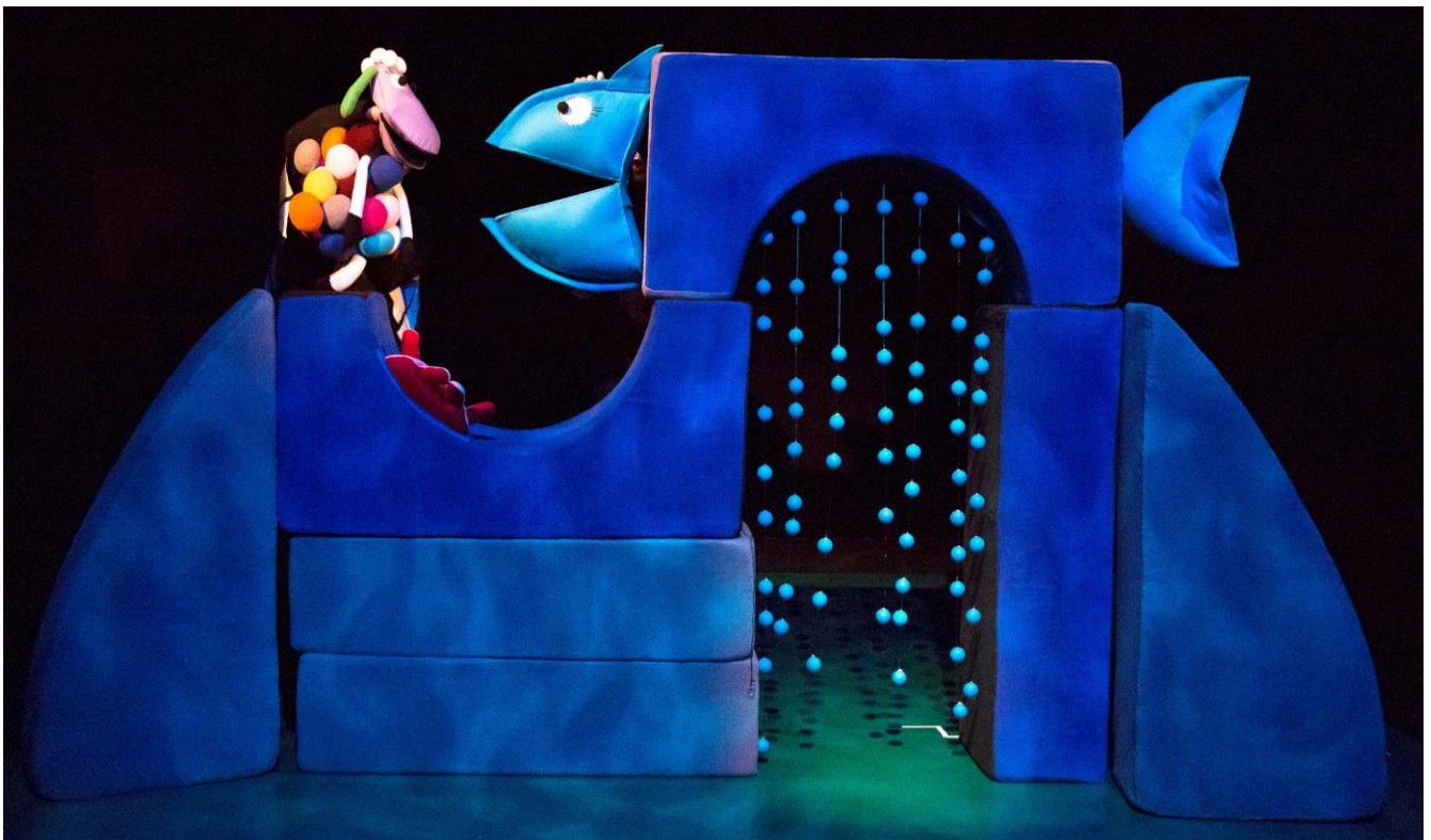
Slika 11. Wanda LaVanda i orada

Kako svi likovi više-manje prate jednostavne geometrijske oblike tako i orada prati sve linije scenografije. Dizajnirana je tako da ima odvojenu glavu i rep i pomoću scenografije mijenja svoju veličinu i oblik. Po mome mišljenju je to najvještije izrađena luka jer na kojem god prostoru se nalazila, koliko god joj bili rep i glava ne pospojeni, nekako i dalje drži oblik ribe i apsolutno vlada prostorom. Nježno je plave boje, dvodimenzionalna i ima mogućnost otvaranja usta. Glavu i rep animiraju dva animatora.