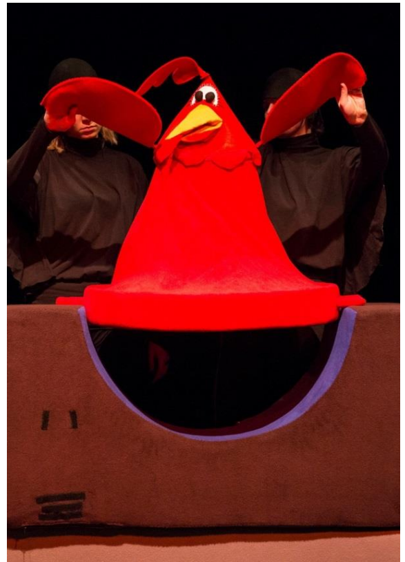
Slika 9. Kokoš

Kokoš je izrađena kao stožac od tkanine koji na dnu ima obruč koji drži oblik, a na vrhu glavu, te sa strane krila. Ova lutka je zijevalica tako da može otvarati kljun. Animiraju je dva animatora. Na početku podsjeća na gnijezdo u koje se pilići skrivaju čime predstavlja pomalo pretjerano zaštitnički nastrojenu majku koja djeci ne dopušta da se druže s Wandom. Krila su također animabilna. Kokoš također ima mogućnost da joj se odvoji gornji dio(glava i krila) kako bi se mogla kretati brže.