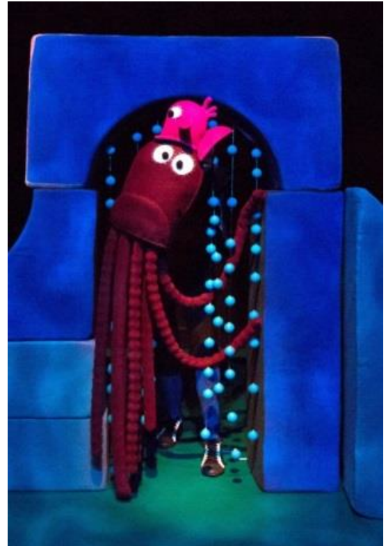
Slika 12. Boba i hoba

Kao i većina lutaka, namijenjene su uglavnom Dvodimenzionalnoj igri. Upravljanje su od iza s minijaturnim vodilicama kako bi jedan animator mogao animirati obje lutke. Hobini krakovi napravljeni su od tkanine punjene lopticama za stolni tenis. Na krakovima ima magnete kako bi se mogli pričvrstiti na dijelove scenografije u koje su ugrađene metalne pločice zbog mogućnosti da ih animira jedan animator. One su u nježnim ružičastim nijansama.