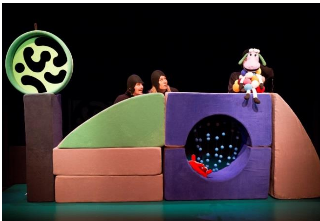
Slika 2. Fotografija scenografije u zadnjoj sceni.