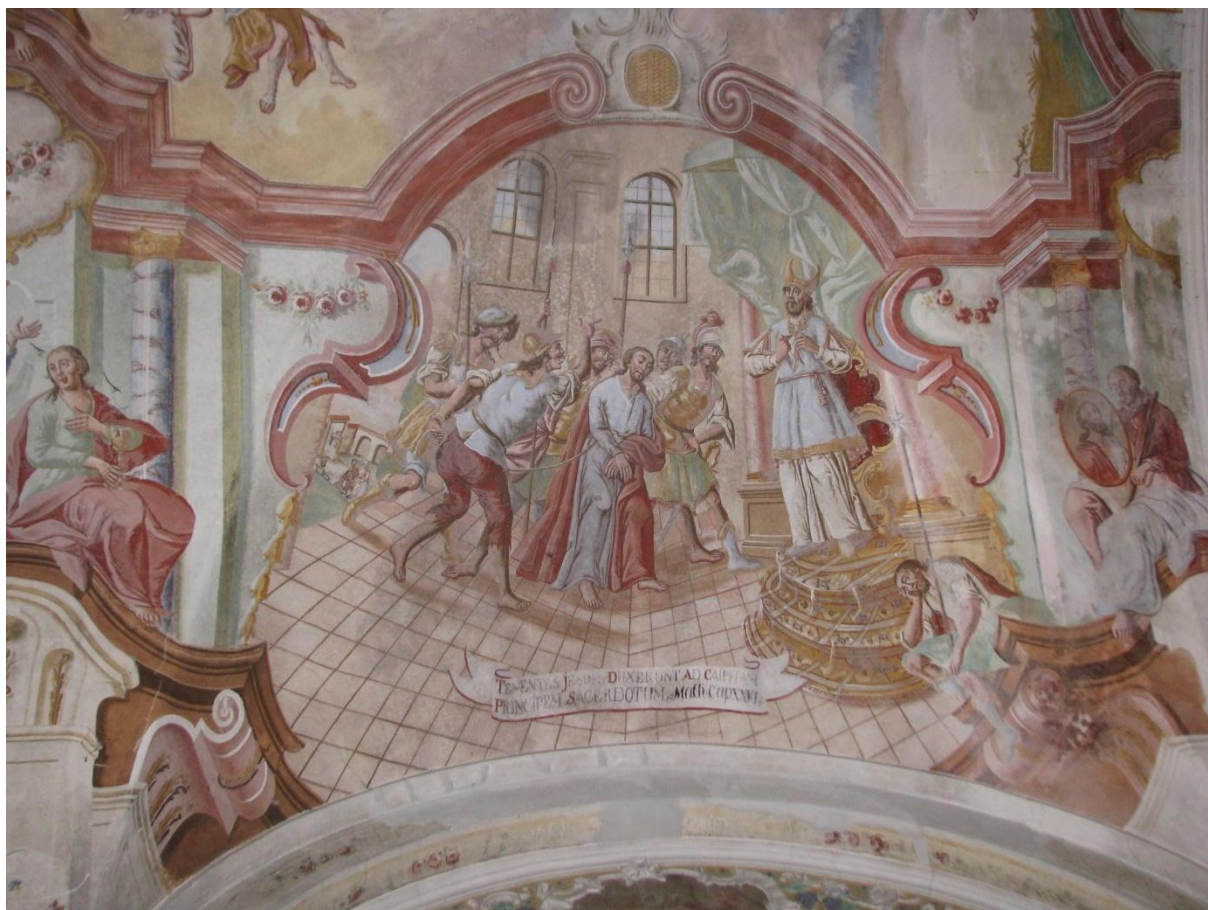
Prilog 11. Krist pred Kajfom