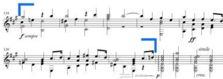
Slika 38. Allegro non troppo e serio , prijelazni dio u A'' dijelu

Prijelazni dio traje od takta 134 do takta 141 (Slika 38.). Sastoji se od male rečenice u fis-molu i priprema nastup skraćene teme a dijela (takt 138-141) u A-duru. Zanimljiviji su harmonijski momenti: omiljeni nastup i rješenje septakorda IV. stupnja u taktu 136. i primjena molske subdominante ( sixte ajoutée ) u taktu 139.