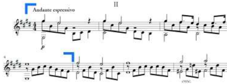
Slika 15. Andante espressivo , a rečenica u A dijelu

Rečenica b traje od takta 5 do takta 12 (Slika 16.). To je velika rečenica s modulacijom iz E-dura u cis-mol koja završava potvrdom tonaliteta mješovitom kadencom. Prvi dio rečenice građen je od dvije dvotaktne fraze pri čemu se druga varirano ponavlja. Drugi se dio također sastoji od dva dvotakta, a u taktu 11 pojavljuje se augmentacija punktiranog motiva. Punktirani je ritam u ovoj sonati vrlo čest, a rado ga je koristio i Schubert.