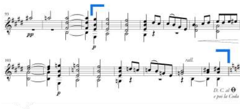
Slika 29. Allegretto vivo , c' dio u B dijelu

Dio c' traje od druge dobe takta 96 do takta 110 (Slika 29.). Sastoji se od dvije velike rečenice. Prva velika rečenica skladana je u E-duru, a melodija je bogatija u odnosu na dio c . Druga velika rečenica nastupa direktno u istoimenome molu (e-mol) te je ponovno upotrijebljena mutacija. Oznaka rall. , uzlazni melodijski mol u najvišem glasu, akord dominante te oznaka Da Capo pripremaju nastup ponovnog A dijela.