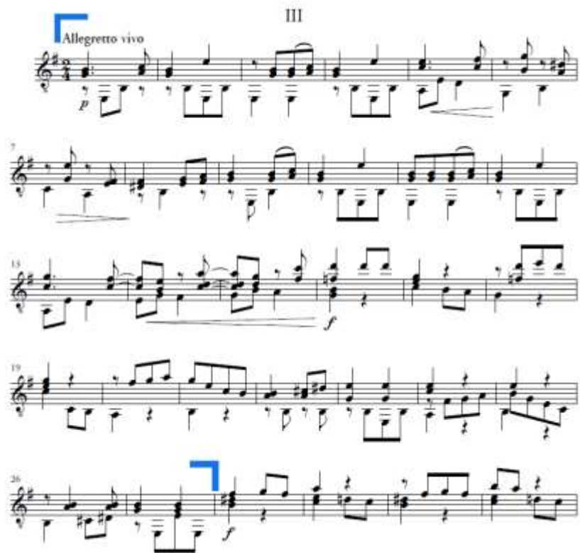
Slika 24. Allegretto vivo , a dio u A dijelu

Dio b traje od takta 28 do takta 56 (Slika 25.). Započinje velikom rečenicom s vanjskim proširenjem (prva doba takta 37). Početni je akord H-dur kao dominantna e-mola, no na samom kraju rečenice on postaje tonika H-dura s autentičnom kadencom na prijelazu iz takta 36 u takt 37. Slijedi mala glazbena rečenica (takt 37-40) u H-duru s imitacijom motiva među glasovima. Nakon nje nastupa mala rečenica s vanjskim proširenjem (takt 41-46). U taktu 41, mutacijom nastupa h-mol. Ovaj je skladateljski postupak čest kod Schuberta. Jedan od istaknutih primjera Schubertove skladbe s mutacijom je Leise flehen meine Lieder (D. 957) iz ciklusa Labuđi pjev . Posebnost ovog dijela je imitacija motiva između različitih dionica. Posljednja velika rečenica s vanjskim proširenjem (takt 47-56) započinje u C-duru, no događa se postupni prijelaz u osnovni e-mol.