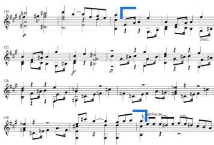
Slika 12. Allegro moderato , most u reprizi

transponira model za sekundu silazno (cis-mol, h-mol) te umjesto posljednje transpozicije u a-mol, neočekivano vodi skladbu u F-dur. Na taj način ponovno ističe varijantni VI. stupanj i tercnu udaljenost tonaliteta (A-dur – F-dur) koja je, čini se, omiljeno harmonijsko sredstvo u ovoj sonati. Posljednja rečenica završava u A-duru kako bi pripremila nastup druge teme u početnom tonalitetu.