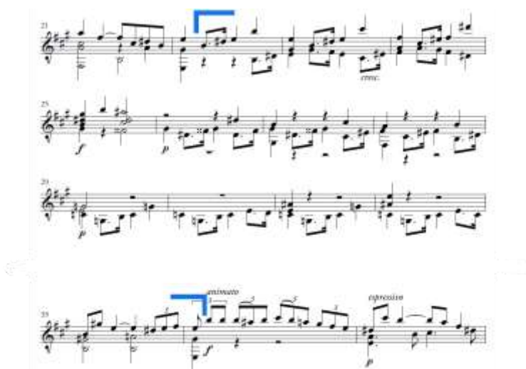
Slika 2. Allegro moderato , most u ekspoziciji

Most traje od druge dobe takta 22 do druge dobe takta 34 (Slika 2.). Tonalitetno je nestabilan, no započinje i završava tonalitetom E-dura. Pojavljuje se nov punktirani motiv u gornjemu i/ili donjemu glasu. Vidljiva je česta upotreba sekvenci. U taktu 22 se jednotaktni model iz e-mola transponira dvaput za veliku sekundu uzlazno te u taktu 25 kadencira u gis-molu. Od takta 26 slijedi sekvenca sa silaznim transpozicijama: gis-mol, fis-mol te se umjesto u e-mol rješava u C-dur u taktu 29. Akord C-dura je varijantni VI. stupanj E-dura pa se preko ovoga akorda te dominante V. stupnja u obliku povećanog sekstakorda c-e-ais vraća tonalitet druge teme (E-dur).