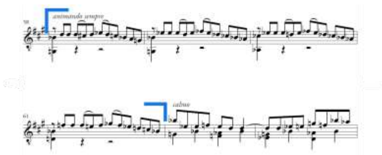
Slika 6. Allegro moderato , prijelazni dio od dvije dvotaktne fraze u provedbi

Prijelazni dio od dvije dvotaktne fraze započinje u taktu 58 te traje do takta 61 (Slika 6.). Građen je od motiva druge teme te sadrži uzlazno kromatsku sekvencu. Prijelazni dio nosi oznaku animando sempre koja uz bogatu kromatsku harmonijsku pratnju (sličnu taktovima 38 i 39) doprinosi razvijanju napetosti. U ovom se dijelu odvija modulacija u tonalitet treće teme (Es-dur).