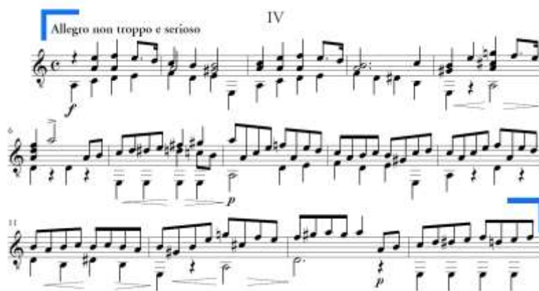
Slika 31. Allegro non troppo e serio, a dio u A dijelu

Dio a traje od takta 1 do takta 14 (Slika 31.). Sastoji se od dvije sedmerotaktne rečenice, pri čemu je druga varirana usitnjavanjem ritma. Prva rečenica započinje varirano ponovljenim dvotaktom, a završava na dominantni a-mola. Druga rečenica harmonijski je slična prvoj, dok je u gornjem glasu melodija iznesena u kraćim notnim vrijednostima.