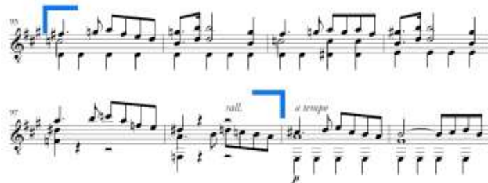
Slika 10. Allegro moderato , prijelazni dio u provedbi

Repriza se sastoji od nastupa prve teme, mosta, nastupa druge teme te code .