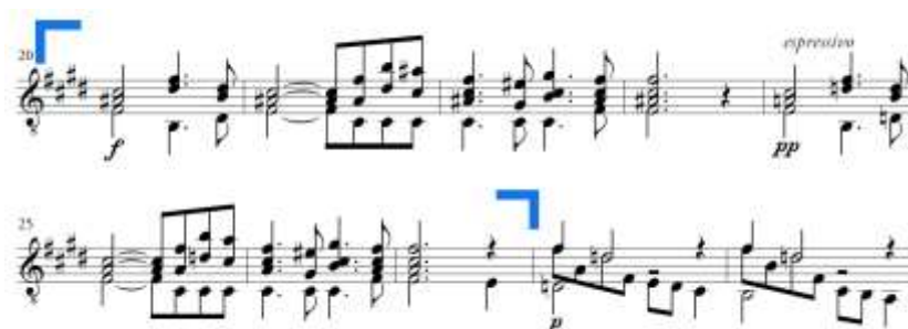
Slika 18. Andante espressivo , d rečenica u B dijelu

Rečenica d traje od takta 20 do takta 27 (Slika 18.). Sastoji se od ponovljene male rečenice u kojima je vidljiv augmentirani punktirani motiv (takt 20, 22, 24, 26). Prva je rečenica u Fis-duru, a druga u fis-molu – prisutna je mutacija kao Ponceova reminiscencija na Schubertov skladateljski stil.