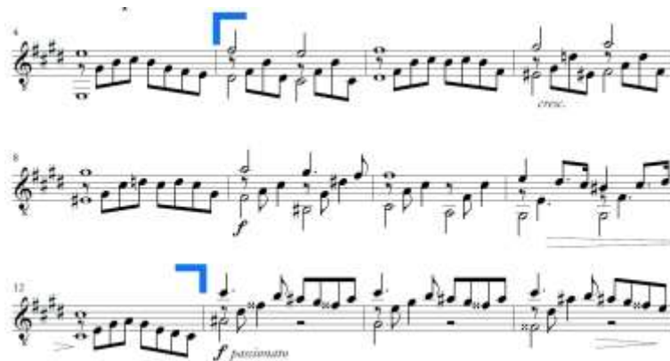
Slika 16. Andante espressivo , b rečenica u A dijelu

Rečenica b traje od takta 5 do takta 12 (Slika 16.). To je velika rečenica s modulacijom iz E-dura u cis-mol koja završava potvrdom tonaliteta mješovitom kadencom. Prvi dio rečenice građen je od dvije dvotaktne fraze pri čemu se druga varirano ponavlja. Drugi se dio također sastoji od dva dvotakta, a u taktu 11 pojavljuje se augmentacija punktiranog motiva. Punktirani je ritam u ovoj sonati vrlo čest, a rado ga je koristio i Schubert.