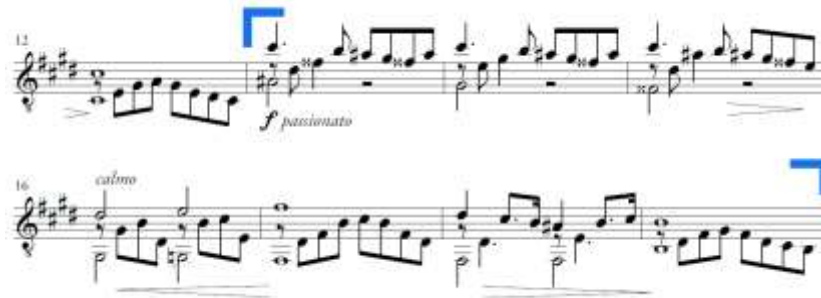
Slika 17. Andante espressivo , c rečenica u A dijelu

B dio je po građi jednostavni trodijelni oblik ( d, e, d ). Za razliku od pjevnih melodija A dijela, u B dijelu Ponce koristi duže notne vrijednosti i stavlja veći naglasak na ritam čime ostvaruje kontrast.