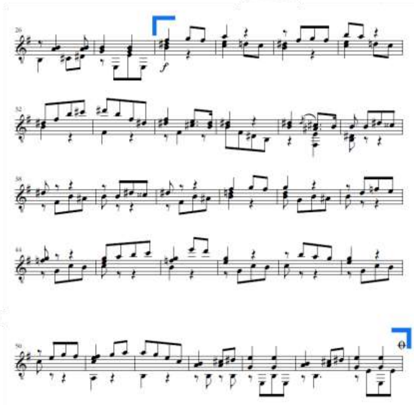
Slika 25. Allegretto vivo , b dio u A dijelu

Most traje od takta 57 do takta 64 (Slika 26.). Čini ga velika rečenica s oktaviranom melodijom kao podsjetnik na početak Schubertove Nedovršene simfonije (br. 8 u h-molu). Silaznim transponiranjem početnog motiva za kvartu i mutacijom, Ponce vješto priprema nastup kontrastnoga B dijela u istoimenom E-duru.