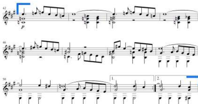
Slika 4. Allegro moderato , codetta u ekspoziciji

Codetta traje od takta 42 do takta 49 (Slika 4.). Započinje u C-duru što ponovno čini tercnu udaljenost tonaliteta. Akord C-dura u taktu 42 može se protumačiti i kao varijantni VI. stupanj E-dura u koji se riješila dominantna harmonija iz 40. takta. Motiv prve teme u melodiji u dvotaktnoj frazi varirano se ponavlja uz izmjenu harmonija te se imitira u donjem i srednjemu glasu. U taktu 46, na istom tonu c, nastupa povećani terckvartakord kao dominanta dominante te se u taktu 48 rješava u V. stupanj E-dura. Slijedi rješenje u kvintakord E-dura i izlaganje variranoga motiva prve teme u E-duru na pedalnom tonu. U taktu dodavajem tona d nastaje dominanta za A-dur i čini osnovu za povratak u početni tonalitet u repeticiji, dok se u taktu 53 priprema prijelaz na provedbu u fis-molu.