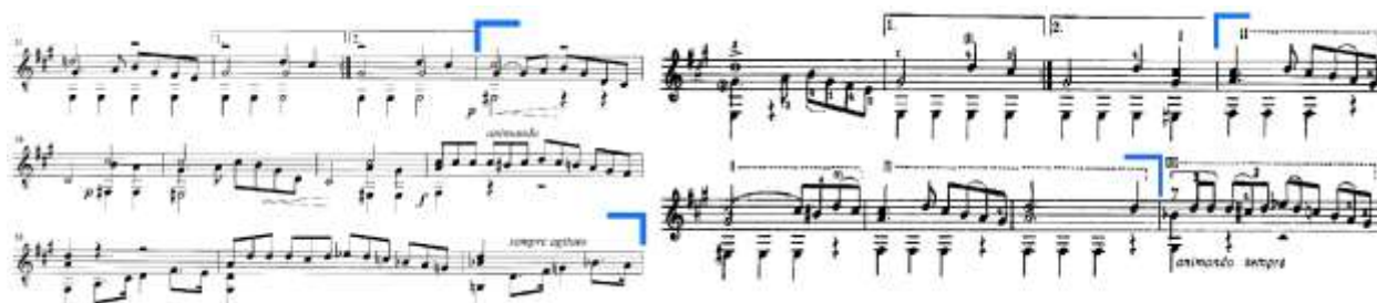
Slika 42. 1. stavak, takt 53-60: lijevo – izvornik (Hoppstock), desno – Segovia izdanje

stavka, nakon prvoga znaka za ponavljanje. U Segovijinoj obradi, takt 53-60 izbrisan je iz izvornika i reduciran na četiri takta (Slika 42.).