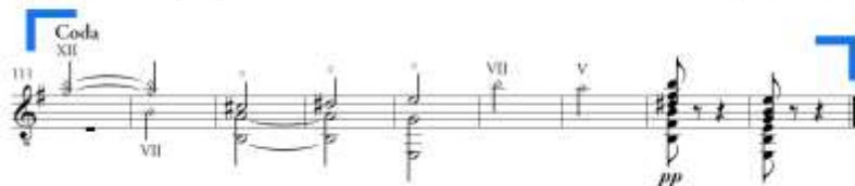
Slika 30. Allegretto vivo, coda