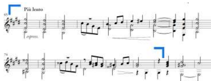
Slika 27. Allegretto vivo , c dio u B dijelu

Dio c traje od takta 65 do prve dobe takta 80 i čini ga velika perioda (Slika 27.). Početak fraze zapravo nastupa uzmahom na zadnjoj dobi takta 64. Prva velika rečenica započinje nizanjem glavnih stupnjeva E-dura. Takt 65 započinje septakordom IV. stupnja čija je septima pripravljena u najvišem glasu na zadnjoj dobi takta 64, a rješava se silazno u dominantni sekundarkord u taktu 66. Ovaj je akord vrlo čest u romantičarskim solopjesmama. U drugom se dijelu rečenice ritam usitnjava. Druga velika rečenica također započinje nizanjem akorada s kromatskom modulacijom u gis-mol (tercno udaljeni tonalitet), a ritam se kasnije ponovno usitnjava.