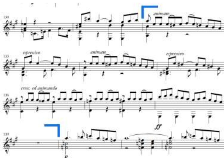
Slika 13. Allegro moderato , druga tema u reprizi

Druga tema traje od takta 132 do takta 139 (Slika 13.). Osim tonaliteta, nema većih promjena u odnosu na drugu temu u ekspoziciji.