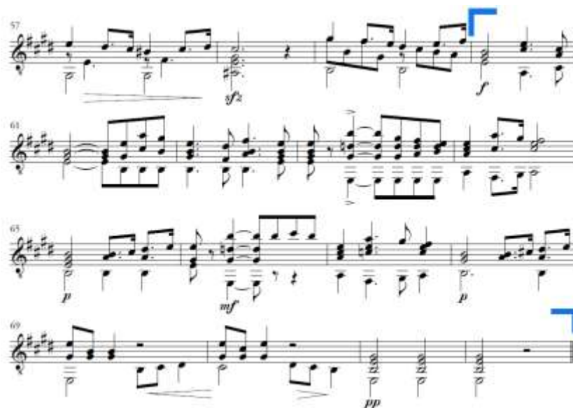
Slika 23. Andante espressivo, coda