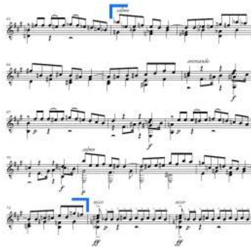
Slika 7. Allegro moderato , treća tema u provedbi

u a-molu. U taktu 71 slijedi ponovni nastup dvotaktne fraze s početka treće teme u E-duru, pri čemu druga fraza sekvencira ponovno za tercu silazno (E-dur u C-dur).