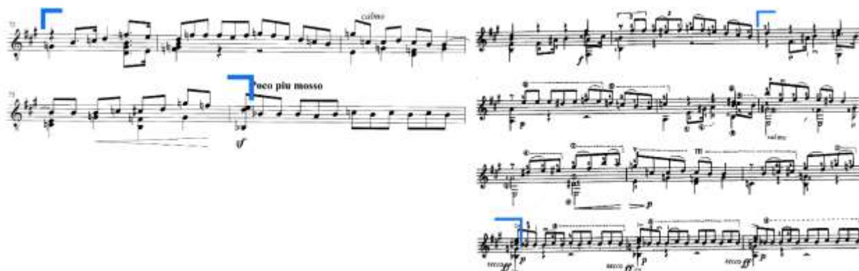
Slika 43. 1. stavak, takt 72-76: lijevo – izvornik (Hoppstock), desno – Segovia izdanje

U izvorniku se između takta 72 i takta 76 materijal kreće u C-duru, a u taktu 76 nastupa ton b u basu te vodi u daljnju modulaciju. U Segovijinoj obradi postoje još tri takta u kojima se materijal provodi kroz a-mol i E-dur do C-dura pa tek onda nastupa pasaža na pedalnom tonu b u basu (Slika 43.).