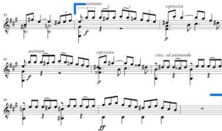
Slika 3. Allegro moderato , druga tema u ekspoziciji

Codetta traje od takta 42 do takta 49 (Slika 4.). Započinje u C-duru što ponovno čini tercnu udaljenost tonaliteta. Akord C-dura u taktu 42 može se protumačiti i kao varijantni VI. stupanj E-dura u koji se riješila dominantna harmonija iz 40. takta. Motiv prve teme u melodiji u dvotaktnoj frazi varirano se ponavlja uz izmjenu harmonija te se imitira u donjem i srednjemu glasu. U taktu 46, na istom tonu c, nastupa povećani terckvartakord kao dominanta dominante te se u taktu 48 rješava u V. stupanj E-dura. Slijedi rješenje u kvintakord E-dura i izlaganje variranoga motiva prve teme u E-duru na pedalnom tonu. U taktu dodavajem tona d nastaje dominanta za A-dur i čini osnovu za povratak u početni tonalitet u repeticiji, dok se u taktu 53 priprema prijelaz na provedbu u fis-molu.