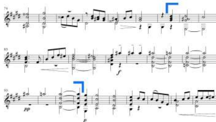
Slika 28. Allegretto vivo , d dio u B dijelu

Dio c' traje od druge dobe takta 96 do takta 110 (Slika 29.). Sastoji se od dvije velike rečenice. Prva velika rečenica skladana je u E-duru, a melodija je bogatija u odnosu na dio c . Druga velika rečenica nastupa direktno u istoimenome molu (e-mol) te je ponovno upotrijebljena mutacija. Oznaka rall. , uzlazni melodijski mol u najvišem glasu, akord dominante te oznaka Da Capo pripremaju nastup ponovnog A dijela.