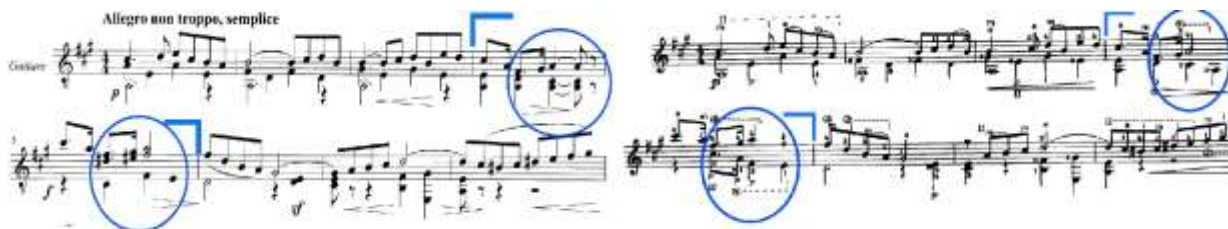
Slika 40. 1. stavak, takt 4-5: lijevo – izvornik (Hoppstock), desno – Segovia izdanje

U taktovima 4-5 te taktovima 88-92 harmonijska se struktura znatno razlikuje zbog izostavljanja ili preoblikovanja donjih dionica (Slika 40.).