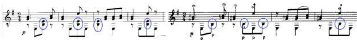
Slika 45. 3. stavak, takt 1-4: lijevo – izvornik (Hoppstock), desno – Segovia izdanje

U trećem stavku u Segovijinoj obradi izbačen je interval kvarte u basu – h-e_1 koji se može vidjeti u izvorniku u taktu 1-4, 9-12 te kasnije tijekom stavka, a preostao je samo ton h (Slika 45.).