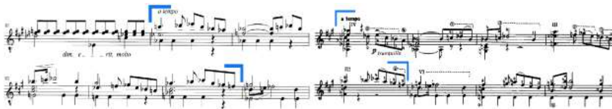
Slika 41. 1. stavak, takt 88-92: lijevo – izvornik (Hoppstock), desno – Segovia izdanje

Osim razlike u broju dionica i harmonijskoj strukturi u Segovijinoj obradi, u taktu 88-92 kompletna je melodija transponirana za oktavu niže (Slika 41.).