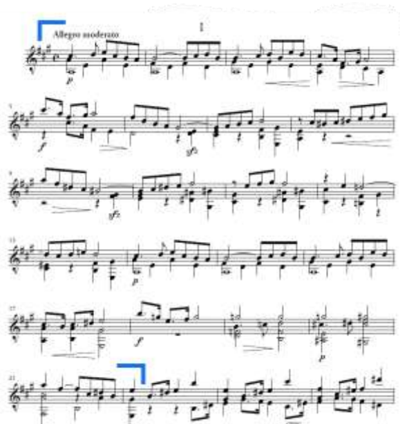
Slika 1. Allegro moderato , prva tema u ekspoziciji 4

Stavak počinje direktnim nastupom prve teme koja traje od takta 1 do prve dobe takta 22 (Slika 1.). Sastoji se od niza malih rečenica. Tema započinje u A-duru i pedalnim tonom na tonici u prva tri takta. Tema je pretežito u osnovnom tonalitetu, osim kratkog uklona u cis-mol u taktovima 8-11. Završetak prve teme nastupa modulacijom i potvrdom E-dura mješovitom kadencom. Već se ovdje očituje skladateljev afinitet prema tercnim odnosima tonaliteta, što je inače u romantizmu česta harmonijska pojava.