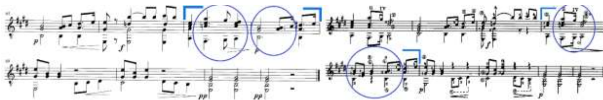
Slika 44. 2. stavak, takt 67-68: lijevo – izvornik (Hoppstock), desno – Segovia izdanje

U trećem stavku u Segovijinoj obradi izbačen je interval kvarte u basu – h-e_1 koji se može vidjeti u izvorniku u taktu 1-4, 9-12 te kasnije tijekom stavka, a preostao je samo ton h (Slika 45.).