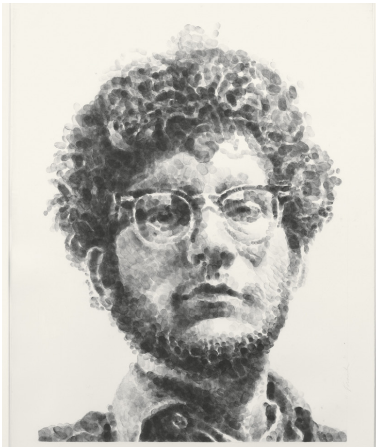
Chuck Close, Frank , 1980.

Tijekom kreativnog zadatka razgovarali bi o pojmu „daktioskopija“ i jesu li upoznati s njim. Riječ potiče iz grčkih riječi „ daktylos “ što znači „prst“ i „ skopeo “ što znači „gledam“ te označava metodu identificiranja osoba putem otiska prsta. Postavili bi pitanje znaju li koje vrste otiska prsta ili koji oblik papilarnih linija sve postoji? Dok analiziraju svoje prste, ponovili bi kako razlikujemo tri vrste otiska: oblik luka, oblik petlje ili zamke i kružni oblik. Na projekciji bi imali par primjera kako su ljudi ukrasili i na koji su način ostavili trag otiska prsta kao poticaj inspiraciji. Među njima bi bili radovi poznatog američkog umjetnika pod imenom Chuck Close koji je napravio kompletne, detaljne portrete koristeći otiske svojih prstiju.