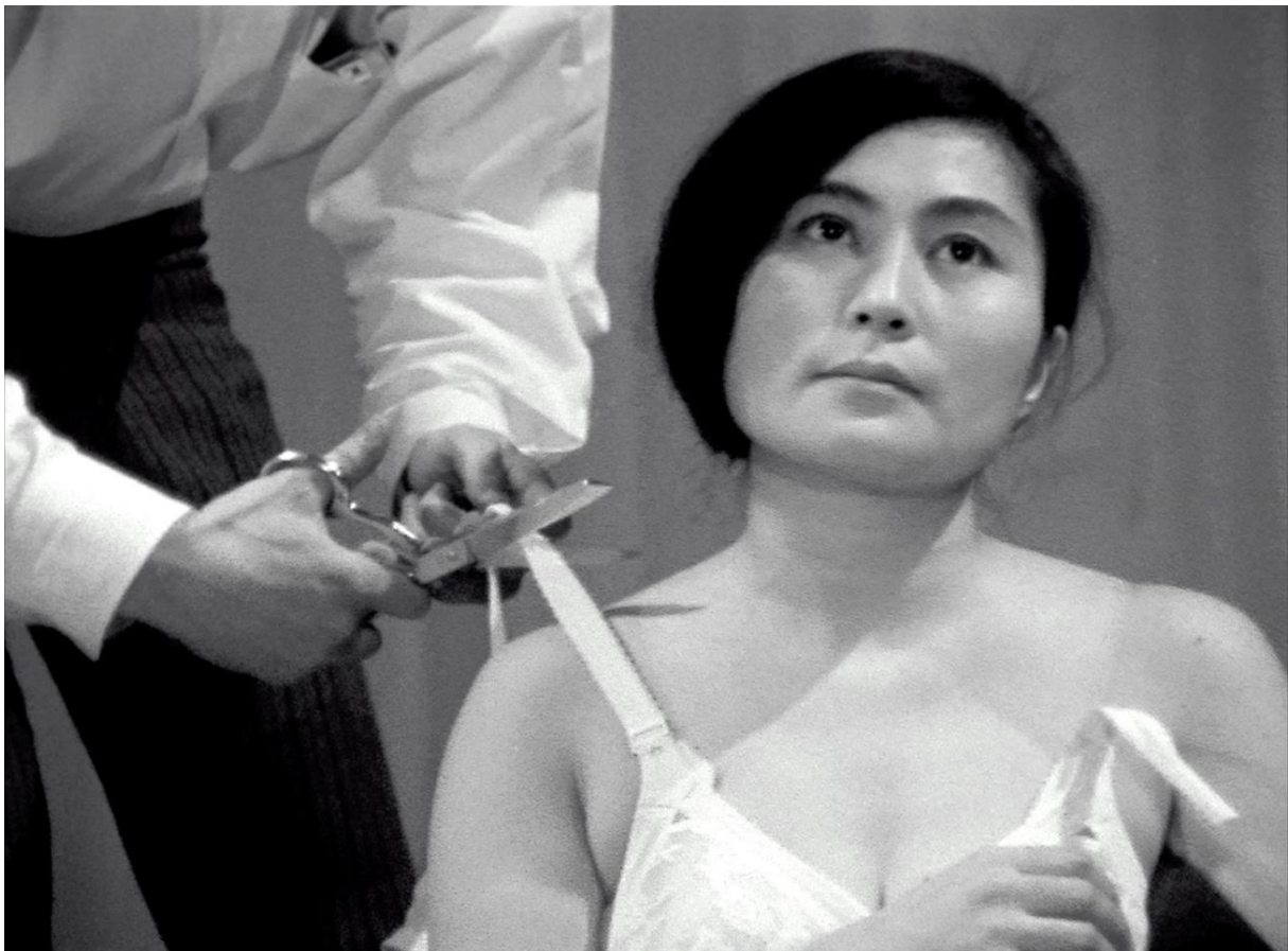
Yoko Ono, Odrezani dio , 1964. – 2003.

( https://www.moma.org/learn/moma_learning/yoko-ono-cut-piece-1964/ )