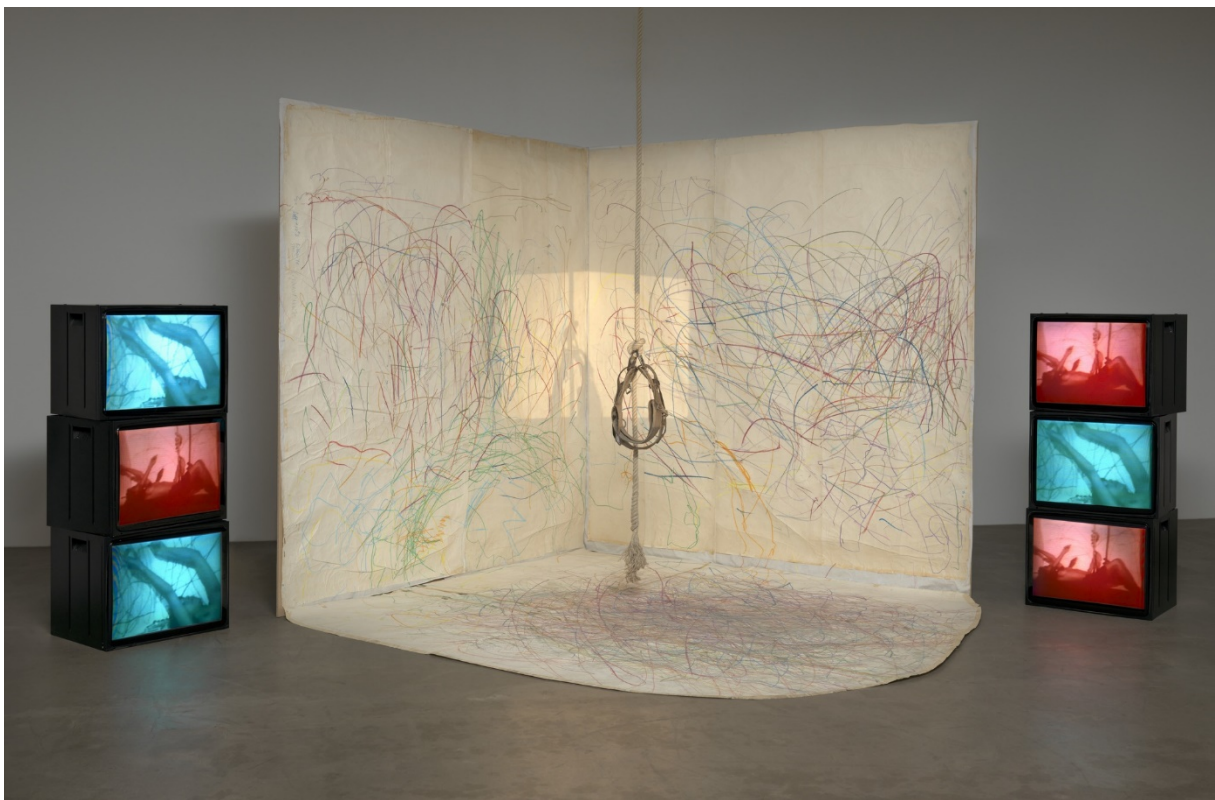
Carolee Schneemann, Sve, uključujući njene granice , 1971. – 1976.

Slikarica Carolee Schneemann je poznata po svojim feminističkim i političkim promišljanjima i pitanjima što se odražavalo u njenim performansima. U svojem performansu „Sve, uključujući njene granice“ umjetnica se nalazi u remenju koje je obješeno o konop koji umjetnica može podešavati po visini. Jednom rukom se pridržava i pruža prema tri plohe papira na koje ostavlja tragove pastela u boji. Prema umjetničnim riječima: "Moje cijelo tijelo postaje posrednik vizualnih tragova, ostataka energije tijela u pokretu." ( https://www.moma.org/learn/moma_learning/carolee-schneemann-up-to-and-including-her-limits-1973-76/ ) Umjetnica tvrdi kako je ovaj performans pod izravnim utjecajem action painting-a Jackson Pollocka u smislu tjelesnog procesa nanošenja boje. Izvijanje i pokušaji kontrole pokreta dok se nalazi u zraku, stvaraju izravan i surov zapis tijela te na taj način ga podliježu subjektivnom procesu stvaranja. Ovaj performans je izvela devet puta te je na kraju pretvoren u instalaciju. Osim crteža na plohama papira, na video monitorima se ponavljaju snimke njezinih performansa, a remenje i konop su obješeni u središtu instalacije.