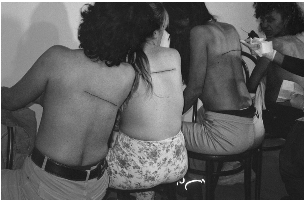
Santiago Sierra, Linija od 160 cm , Salamanca, Španjolska, 2000 g.

kako bi osvijestio realni problem koji postoji u našem društvu. Iglu mašinicice za tetoviranje je usporedio s iglom heroina, a tetovaža ostaje kao podsjetnik, ona je trajna, dok je efekt heroina kratkotrajan. Žene koje su sudjelovale u ovom umjetničkom radu svjesno su prihvatile tetovažu za ponuđenu drogu. Rad je očigledno iskorištavajući za žene koje su sudjelovale u njemu, ali je osvijestio širu publiku na problem ovisnosti te je poslužio kao kritika društva čiji poredak čini neke ljude toliko očajnima da su spremni ići u autodestruktivne ekstreme. Budući je rad baš tako izveden, izazvao je veću empatiju i osviještenost ljudi nego nekakva puka statistika na televiziji.