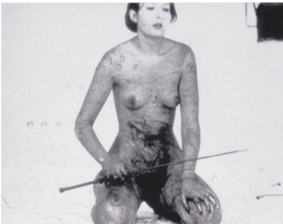
Marina Abramović, Thomasove usne , 1975., Innsbruck