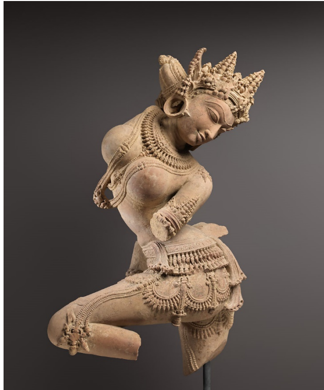
Indijska skulptura, Devata , 11 st.

U Indiji golo tijelo kao motiv u umjetnosti nije postojao, kada vidimo prikaze na prvi pogled izgleda kao da figure nemaju odjeću, ali kad se približimo vidimo šavove, linije oko zapešća, vrata i gležnjeva, razne ukrase i nakit. Ukras je izuzetno važan u kulturi Indije, jer u Indiji jedini ljudi koji nisu ukrašeni i nemaju nakit su ljudi koji tuguju. Vjerovali su kako ukrašavanje tijela donosi sreću, bogatstvo i dobar život.