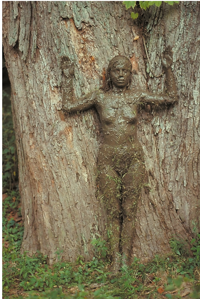
Ana Mendieta, Stablo života , 1976.

„Stablo Života“. Za ovaj rad, Mendieta se opasala blatom i stajala, podignutih ruku, u podnožju postojećeg živućeg stabla. Htjela je pokazati bitnu korelaciju između dvije „žive“ stvari i kako ih percipiramo i doživljavamo. Stablo i tijelo su dvije žive stvari, ali na njih gledamo kao na dvije kompletno drugačije cjeline zbog naše kulture, tradicije i navike.