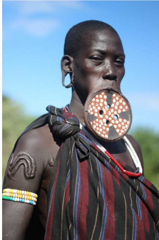
Žena iz 'Mursi' plemena, Etiopija