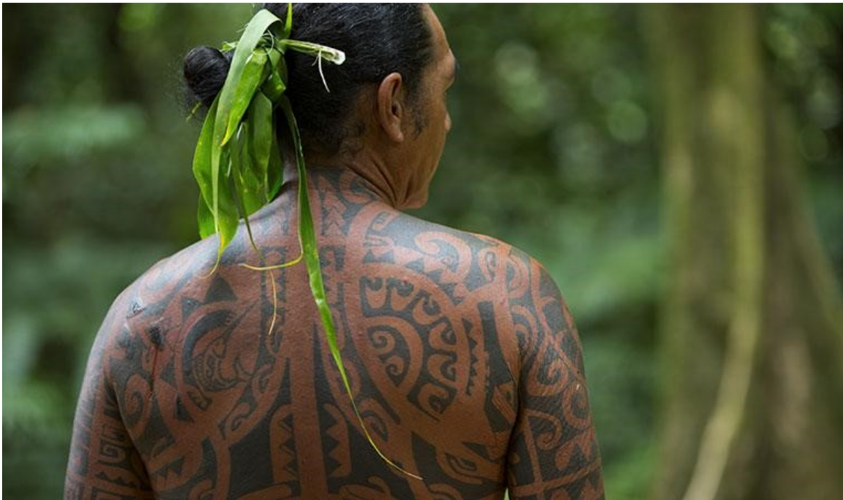
Primjer svete Polinezijske tetovaže

kako je tetovaža puna svetosti i duhovne moći. Na to utječe dolazak evanđeoskih misionara u Tahiti 1797. godine. Ovi misionari pomogli su izraditi prve pisane zakone u Tahitima. Jedan od tih izvornih zakona je da nije dopušteno tetoviranje. To je zbog zakona iz knjige Levitskog zakonika koji zabranjuje obilježavanje tijela i to je nešto što su kao kršćani vrlo ozbiljno shvaćali. Zbog toga tijelo postaje mjesto gdje ljudi pokušavaju prisiliti određeni koncept pojedinca i društva na lokalne ljude.