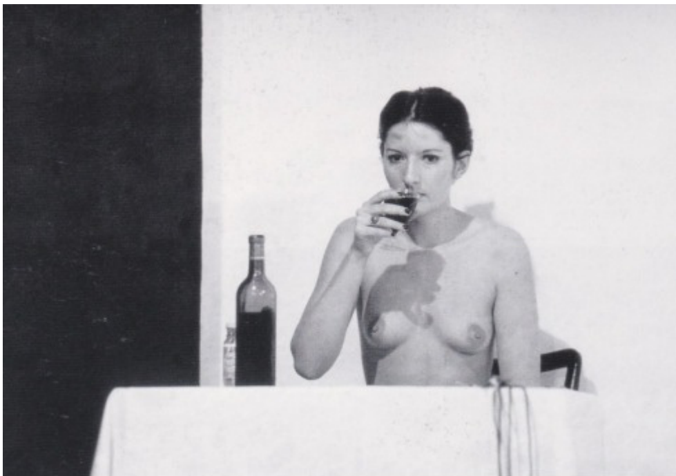
Marina Abramović, Thomasove usne , 1975., Innsbruck

Performans „Thomasove usne“, umjetnica Marina Abramović prvi puta je izvela 1975. godine u Krinzinger galeriji u Innsbrucku, Austriji. Performans započinje gola, jede 1 kilu meda, zatim ispija 1 litru crnog vina te nakon toga umjetnica rukom razbija čašu. Britvicom urezuje petokraku na trbuhu i nakon te radnje sama sebe bičuje. Na kraju liježe na križ sačinjen od ledenih blokova, dok je grijač usmjeren prema trbuhu koji počinje krvariti na mjestu urezane zvijezde petokrake. U istom trenutku ona se smrzava i pregrijava. Umjetnica ovim performansom neupitno koristi tijelo kao subjekt iznutra i izvana te na taj način odašilje poruku publici, koja ju je prilikom prvog izvođenja nakon 30 minuta što je ležala na ledenim blokovima, iscrpljenu odnijela s pozornice u besvjesnom stanju. Abramović u performansu „Thomasove usne“ stavlja dobrobit svog tijela u opasnost, ali i tim činom dovodi u pitanje odnos i razliku između publike i izvođača. Publika se nalazi u nezavidnoj poziciji pasivnih promatrača no odnos nje prema svom tijelu osjećaju svi kao da se događa njihovom tijelu, te tim činom iz promatrača postaju sudionici.