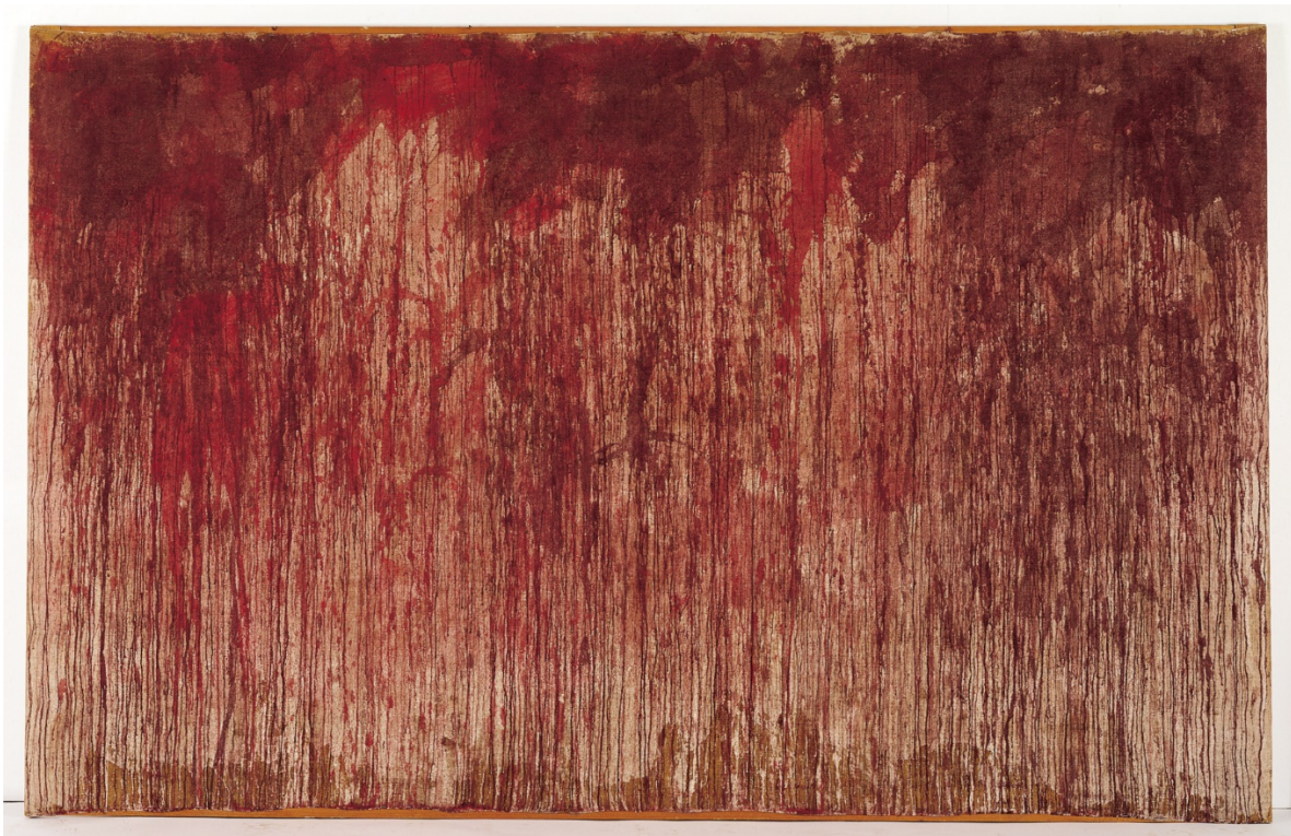
Hermann Nitsch, Postaja križnog puta , 1960. Beč

Radovi Hermanna Nitscha su možda među najistaknutijima skupine. Trajni pristup uporabe tijela u umjetnosti Hermanna Nitscha, vidljiv je u svakom njegovom pristupu umjetničkog izražaja. Sredinom 1950ih godina, osnovao je O.M. Theatre – Kazalište orgija i misterija. Kazalište se oslanja na književnosti i osjetilni jezik u početku, no vrlo brzo odustaje od tog koncepta, jer nema dovoljnu dimenziju za poticanje senzualnih dojmova. Cilj mu je bio svesti doživljaje na osjetilne ne samo sluhom, već i mirisom, dodirom i okusom. Takav senzualni pristup je prenio i na slikarstvo. Šezdesetih godina 20. stoljeća prikazuje realnost na platnu, poput slike „Djelovanje“ poprskana krvlju ovce koja je kasnije razapeta na križ. Od 1963. godine slike zamjenjuje objektima poput tkanine i odjeće koja postaje umjetničkim objektom. Slikarstvu se vraća 1983. godine koja se svodi na uporabu boje kroz action painting pristup slikarstvu. (Christine Wetzlinger-Grundnig, https://www.nitschmuseum.at/en/hermann-nitsch/work?set_language=en ).