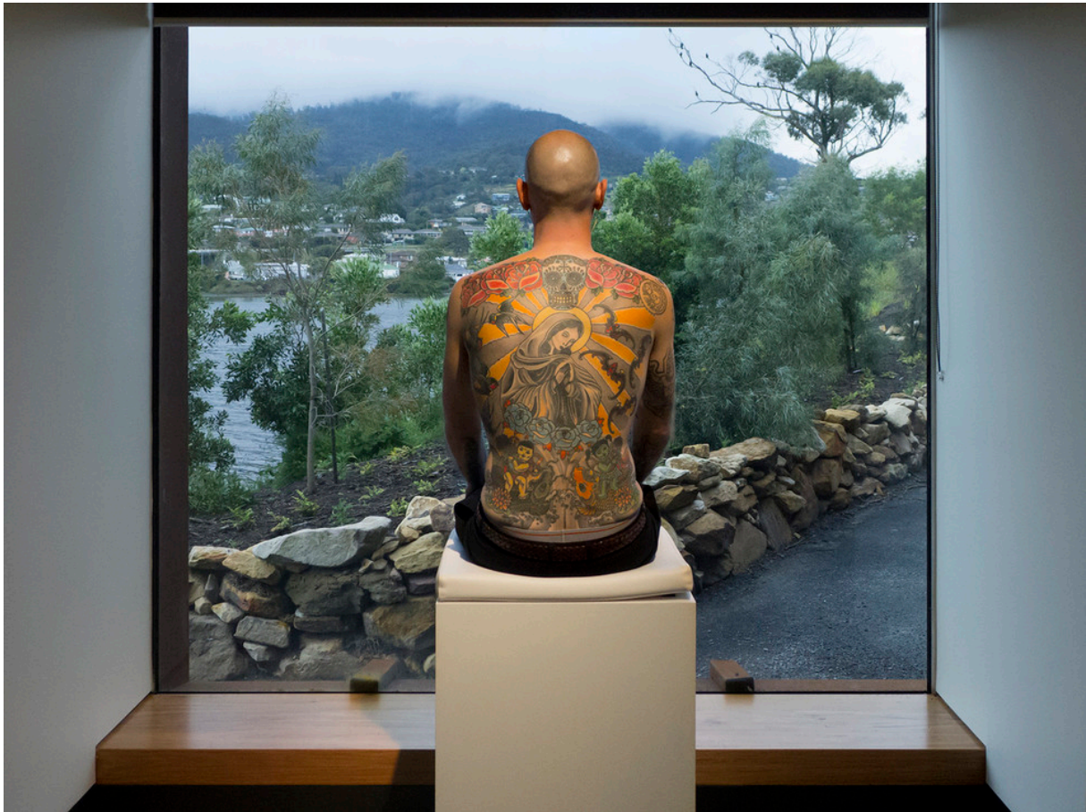
Wim Delvoye, TIM , 2006.

prikazuje razliku između slike na zidu i „živog platna“, platna koji se mijenja tijekom vremena; deblja, mršavi, ozljeđuje... prikazuje nam proces življenja.