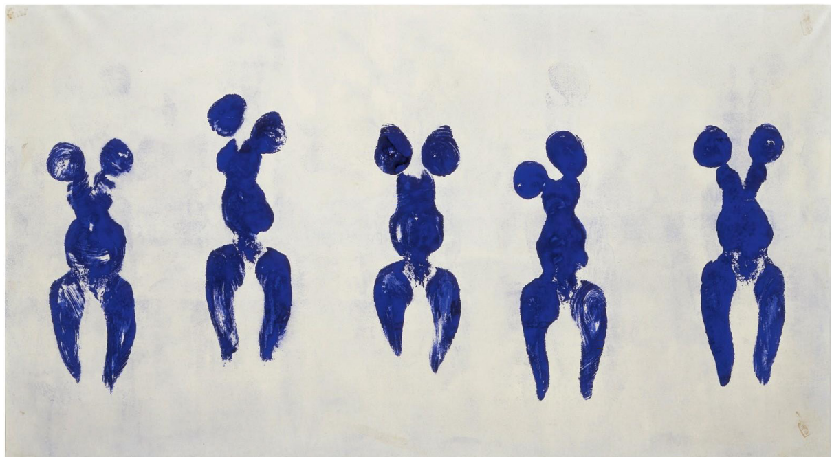
Y. Klein, Antropometrija u plavom , 1960.