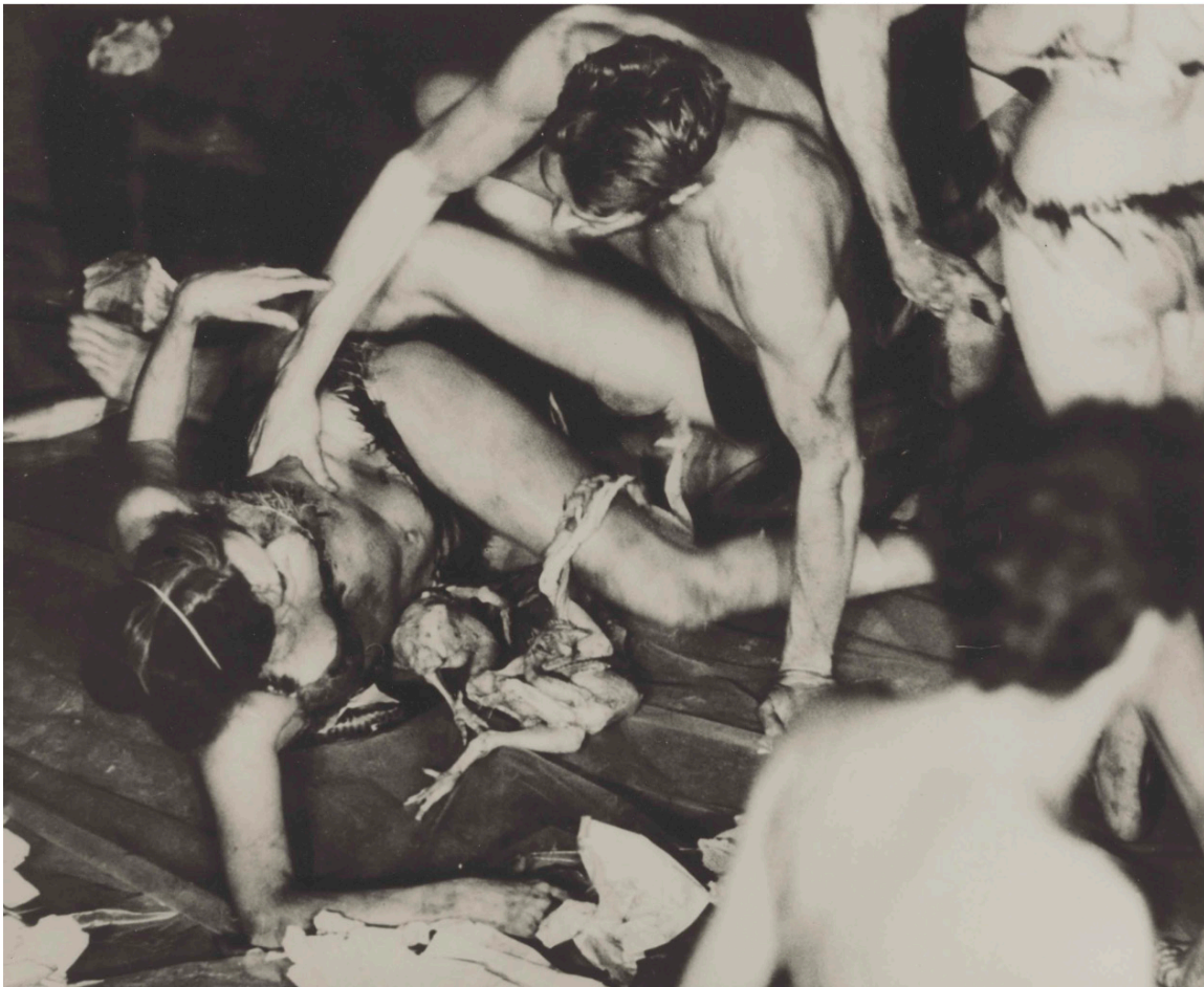
Carolee Schneeman, Tjelesni užitci , 1964.

Klasičan primjer proturječnog razmišljanja, „Tjelesni užitci“ istražuje način na koji se društvena dinamika mijenja kada se uklone kulturni tabu i ograničenja. Koliko god je Schneemann središnja figura za feminističku umjetnost, „Tjelesni užitci“ se ne uklapa u tu kategoriju. U izvedbi su muški sudionici bacali žene preko ramena i ponosno paradirali. Schneemann je pokazala kako uklanjanje rodni granica može pojačati postojeću politiku moći, umjesto da ih eliminira.