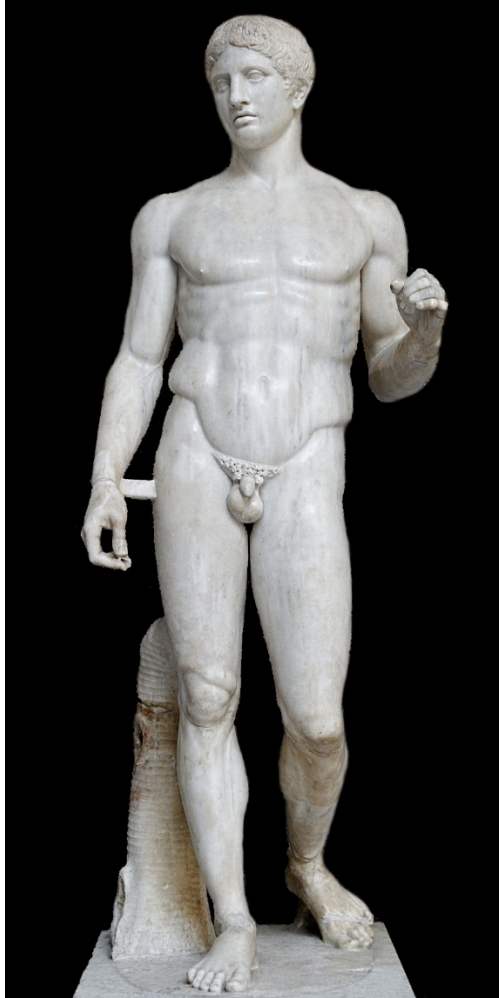
Poliklet, Dorifor ili Kopljonoša , 450 pr. n. e.

sasvim uobičajeno i normalno u grčkoj kulturi. Istraživači su tražili bilo kakve tragove antičke tradicije takve vrste i nisu ju uspjeli naći. To je koristilo ujedno i umjetnicima, jer atletima skidanje odjeće i boravljenje bez iste nije bilo strano.