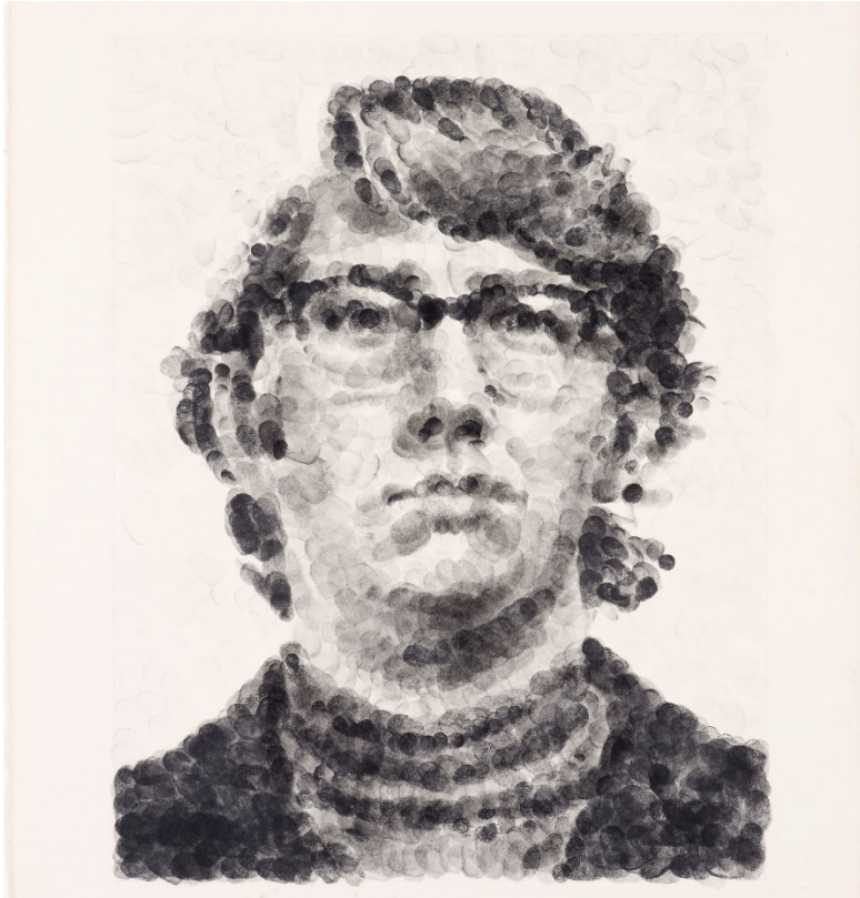
Chuck Close, Keith , 1979.