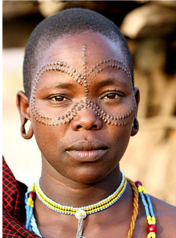
Primjer zapadno Afričke skarifikacije, žena plemena Datoga iz Tanzanije

Branding ili pečačenje je oblik skarifikacije koji stvara ožiljak nakon što je površina kože spaljena. Branding je u nekim društvima učinjen kao dio obreda prijelaza, ali u zapadnoj Europi i drugdje, kao i neki oblici tetoviranja, naširoko su se koristili za obilježavanje zarobljenika i kriminalaca. U Grčkoj i Rimu spaljivali su osuđene kriminalce sa specifičnim oznakama koje opisuju njihov zločin. Tijekom razdoblja ropstva, robovlasnici su spaljivali svoje inicijale na robove. U novije vrijeme nedavno su neki pojedinci i članovi bratstava na sveučilištima u Sjedinjenim Američkim Državama usvojili pečačenje kao radikalni oblik ukrasa i samoidentifikacije (Camphausen, 1997.)