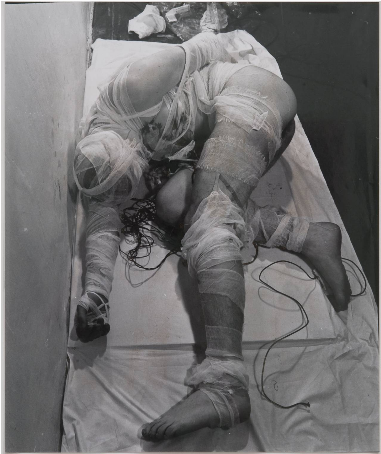
Rudolf Schwarzkogler, Treće djelovanje , 1965., Beč