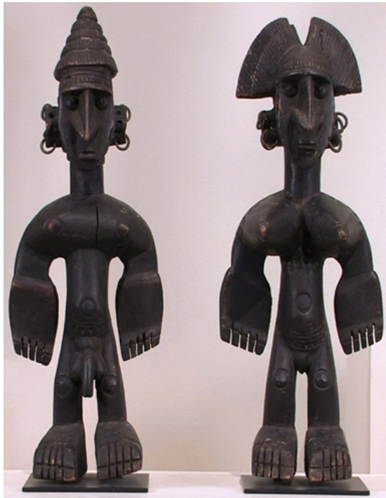
Bambara figurice, Mali, Zapadna Afrika, 1900 g. – 2010 g.

Ljudi često pregovaraju o raznim idejama koje se tiču identiteta, jedna od njih je kako prikazujemo svoj ili tuđi identitet kroz prikaz tijela. Tijelo u umjetnosti nam može dati neiscrpan izvor informacija te se može oblikovati kako bi nam poslalo određenu poruku; tijelo može prikazati imućnost, stalež, starost, spol... Spol uzimamo zdravo za gotovo kao nešto što je prirodno, ali kad počnemo razmišljati gledamo li prikaz muškog ili ženskog tijela u biti donosimo zaključke o tome kako ljudi inače prikazuju spolnost i koliko smo naviknuti na takav prikaz. Imamo zanimljiv primjer iz afričke države Mali i njihove etničke skupine Bambara. U prilogu niže vidimo dvije Bambara figurice koje reprezentiraju muško i žensko, figurice same po sebi su vrlo slične i po visini i po obliku glave, jedino što ih razlikuje su spolni organi koji nisu očit na prvi pogled. Prikaz tijela također povezujemo sa socijalnom ulogom, koliko je osoba više rangirana u društvu to je prikaz više ukrašen i veće je veličine. Interesantno je istraživati prikaz tijela određene kulture ili tradicije jer otkriva tijekom razmišljanja te kulture.