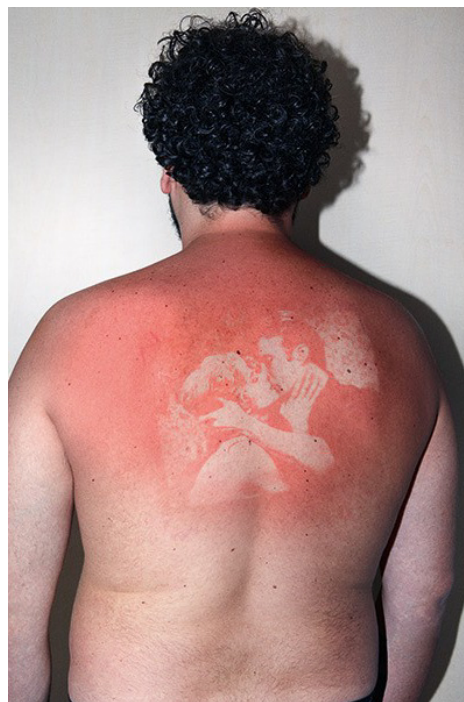
Thomas Mailaender, „ Ilustrirani ljudi “, 2015.