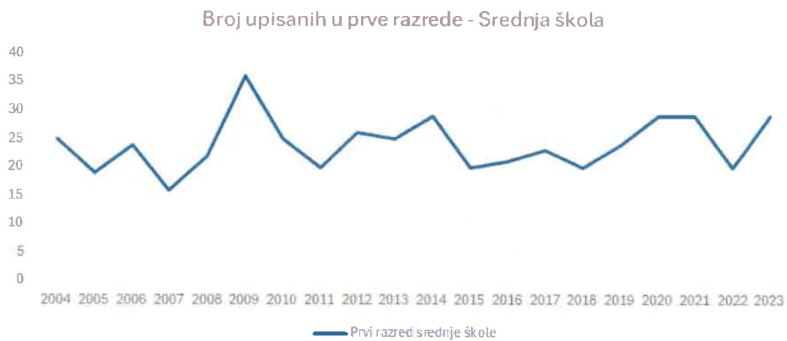
Slika 2. Broj novoupisanih u prve razrede Srednje glazbene škole (uključujući i pripremne) od 2004. do 2023. godine.