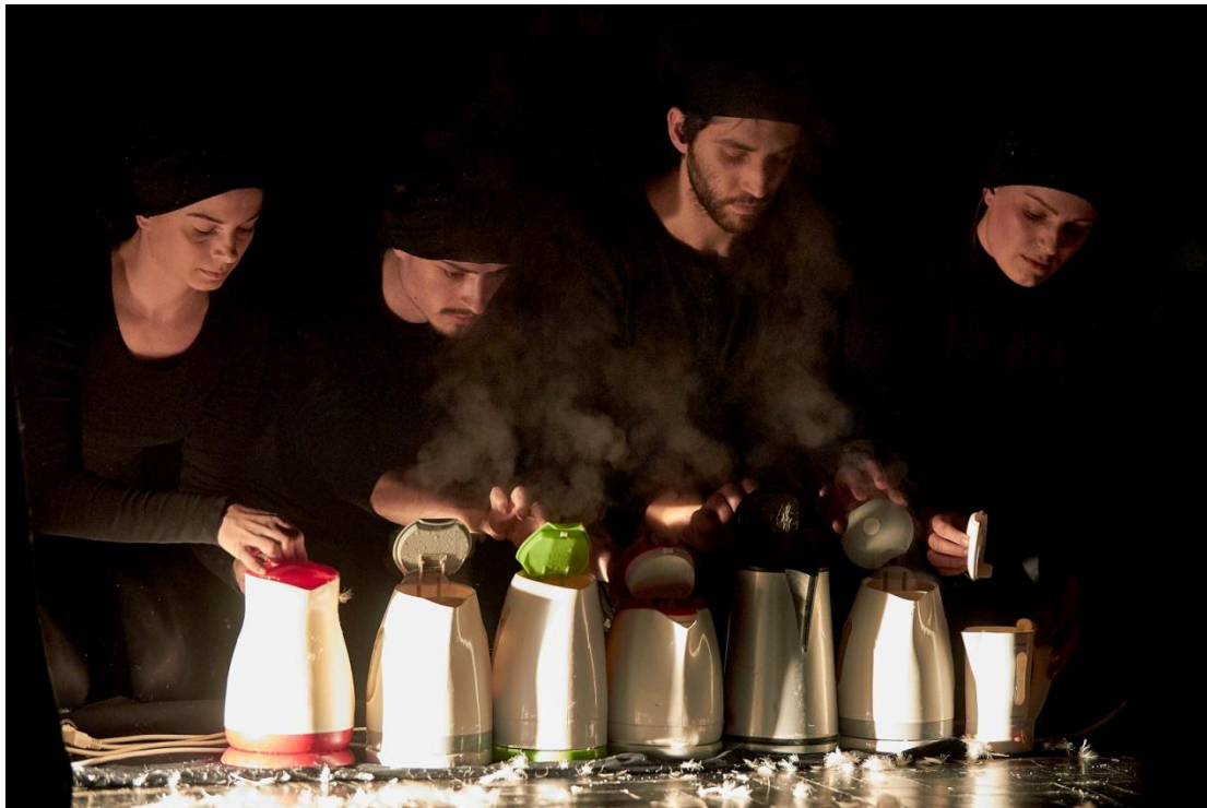
Slika 4. Otpuštanje duša

Kao što je bilo zahtjevno animirati papir preko konca, tako smo ovdje imali animaciju kuhala koja nas je mučila iz drugih razloga. U cijelom diplomskom ispitu animacija je bila minimalistička. Cijelo vrijeme imali smo potrebu za doslovnom animacijom kuhala kao lutke koja diše, koja ima oči, usta i koja se okreće u svim smjerovima, ali to je u ovom slučaju bilo nepotrebno. Animacija koju smo do sada naučili i koju smo radili nije odgovarala za animaciju kuhala u ovoj etidi. Nije bilo potrebe za akcijom, reakcijom i impulsima. Kuhala su bila sasvim drugačija vrsta animacije. Oni su već sami za sebe igrali dovoljno. Njihova statičnost, mirnoća i lagano kretanje bez naglih pokreta bilo je puno vjerodostojnije od bilo kakve „klasične“ animacije. Naučili smo disati kroz njih bez pokreta, prebaciti svu energiju i koncentraciju na kuhalo i takvim načinom animacije prenijeti emociju na publiku.