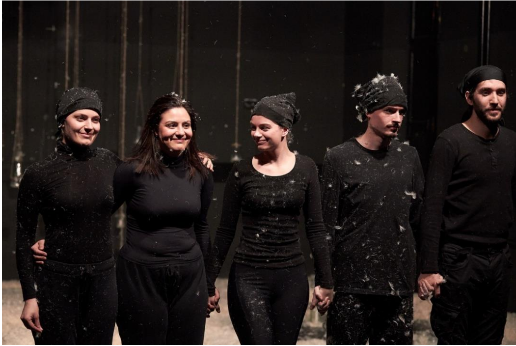
Slika 24. Ansambl predstave Smrt ili o životu