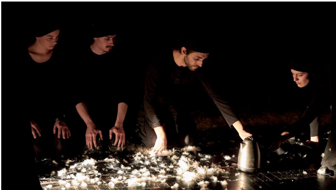
Slika 3. Holokaust

Put do nastanka ove etide išao je potpuno drugačijim smjerom nego u prethodnim etidama koje sam spomenula. U prvotnom pokazivanju atmosfere, našim mentoricama za oko je zapelo kuhalo koje je ostalo samo na sceni puštajući svoju dušu van (dušu je simbolizirala para koja je kipila iz kuhala). U odabiru glazbe pravi put je našla pjesma iz filma Schindlerova lista. Istraživajući kuhala i njihove mogućnosti shvatili smo da je ovdje ključan lik Smrt. Sama glazba i animacija kuhala nisu bila dovoljna. U priči nam je nedostajao glavni lik. Tu se rodila ideja o pisanju dramskog teksta.