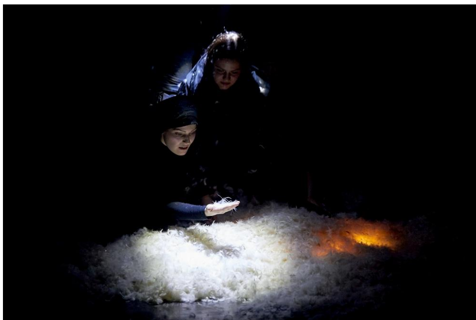
Slika 9. Smrt odlazi od Nore

Nakon položenog ispita iz kolegija Osnove lutkarske režije i Majstorska radionica lutkarstvo: Od teksta do inscenacije, došao je zadnji semestar odnosno rad na diplomskoj predstavi. Prošli smo velik put do ostvarenja predstave Smrt ili o životu , ali još uvijek nismo imali cjelinu. Na početku novog semestra okupili smo se s našim mentoricama i rekli im svoje viđenje diplomske predstave. Nismo htjeli imati pojedinačne etide, kao što je to bilo na ispitu, htjeli smo spojiti materijal i priču kako bismo zaista dobili predstavu, a ne skup etida. Ta odluka donosila je i neke posljedice – eliminaciju etida. Morali smo odlučiti koje etide se mogu spojiti (dramaturški i kroz materijal), a koje ne idu dalje. Kao što sam već ranije napisala, etida s perjem ostala je nedovoljno istražena, a u nju smo imali najviše vjere tako da smo odlučili da bismo voljeli pokušati sve napraviti samo s perjem, bez drugih materijala. Istraživali smo, radili desetak dana na tom materijalu i shvatili da perje nije materijal koji može sam za sebe izdržati četrdesetominutnu predstavu. Vratili smo se ponovno na početak i odlučili da etide Holokaust , Priča u teglici i U perju možemo spojiti u cjelinu. Već prije smo imali poveznicu materijala u pari ( Holokaust ) i dimu ( Teglice ). Red je došao na etidu s perjem, kako nju uklopiti u cjelinu? Što uopće raditi s perjem jer ono jedino može letjeti? Barem nam se tako činilo na prvi pogled.