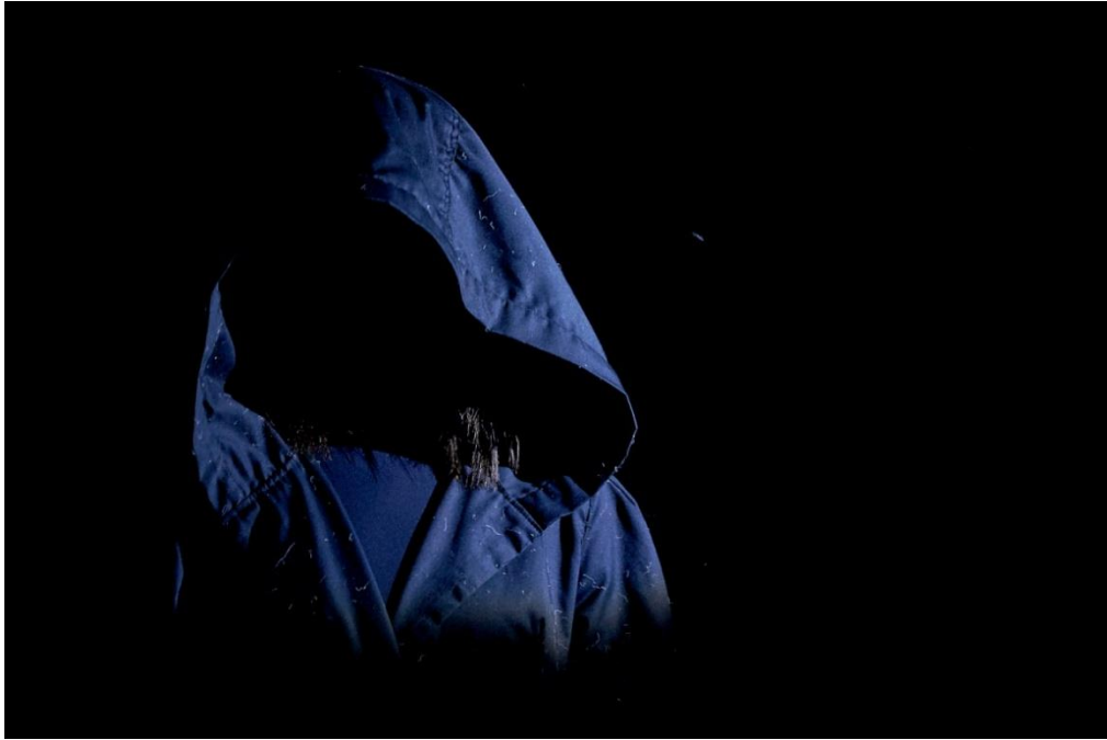
Slika 2. Smrt

Nakon nekog vremena koje smo proveli istražujući i igrajući se, moj odabir pao je na temu – Smrt dolazi po djevojčicu . To je tema s kojom svaki čovjek može suosjećati. Sama pomisao da pokažem ljudima da postoji ljepša strana kad dijete umre, da je njemu sada lakše, da je ono sretnije, tješila je prvo mene, a nadam se i ostale. Upravo je to razlog zbog kojeg sam htjela prikazati tu etidu. A i dijete u meni vjeruje da kad stvarno umreš, dočeka te ono što najviše voliš, ono u što vjeruješ, što te veseli. Što bi drugo moglo dočekati dijete u rajnu nego najveći lunapark kojeg je ikad vidjelo? Veći i od Disneylanda! Barem u mojoj glavi. Ali trebalo je to pokazati na sceni.