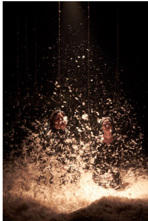
Slika 22. Nora i Smrt