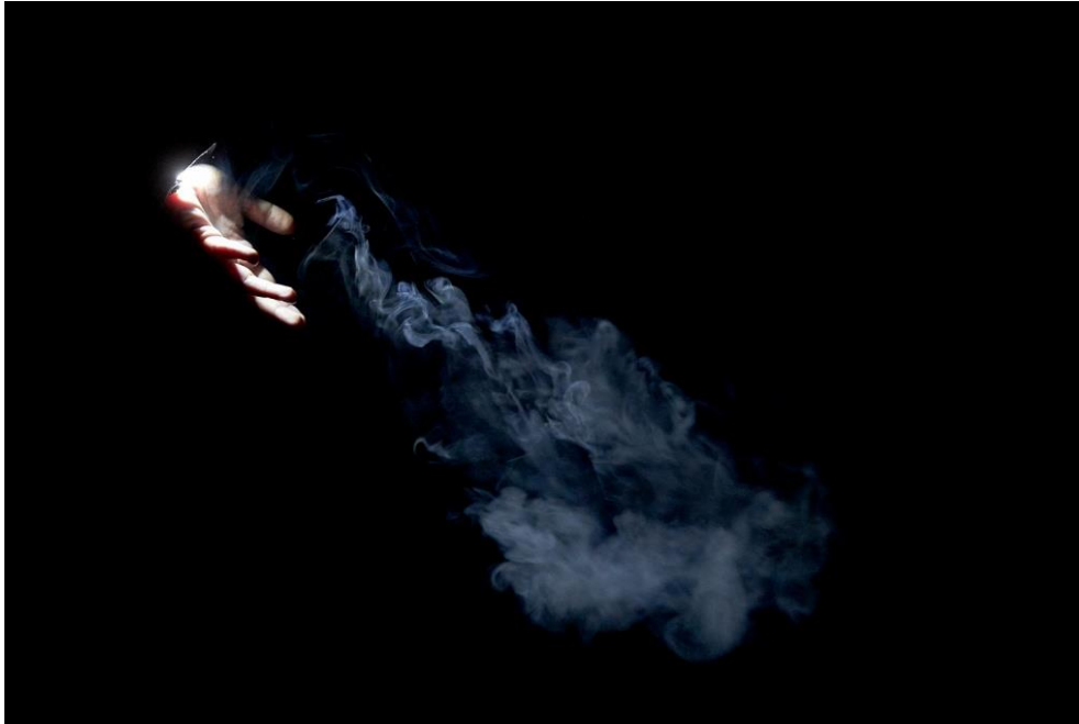
Slika 7. Smrt ispušta duše

Dobili smo i prvu poveznicu između materijala. Para u etidi Holokaust koja je izlazila iz kuhala simbolizirala je njihove duše, a u ovoj etidi duše su bile u obliku dima koji je išao iz ugašenih svijeća koje su napustile svoj ovozemaljski život. Kasnije, taj isti dim Smrt je puštala iz svojih dlanova dalje.