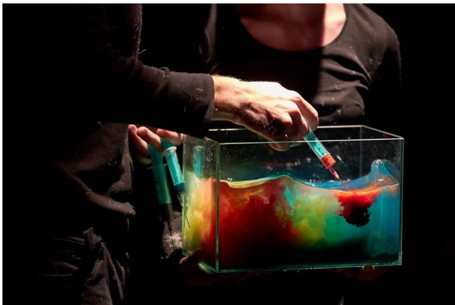
Slika 16. Nora se liječi