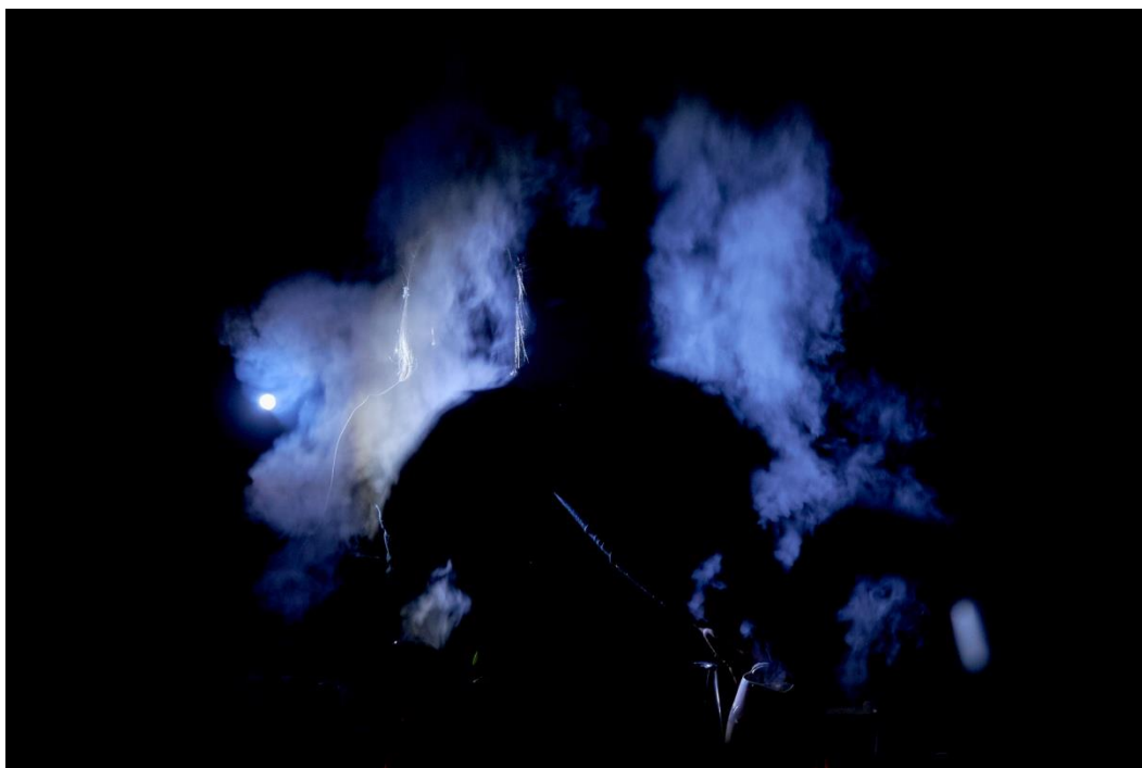
Slika 5. Smrt u sjeni

Neke sam nosila na prstima kao kovčege, neke preko ramena poput kaputa. Samo sam djecu nosila u naručju. Na kraju su njihove duše ipak završile sa mnom.“ 5