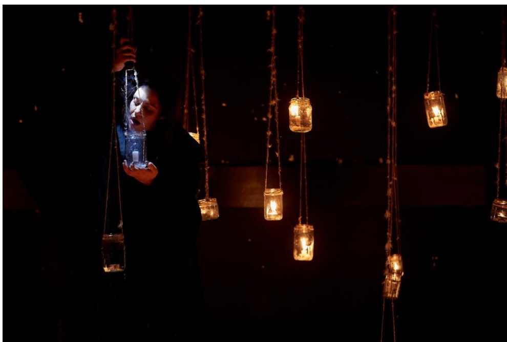
Slika 6. Smrt uzima život

Zadnja etida koju smo napravili išla je u „općenitijem“ smjeru. Polazila je od Smrti. U toj etidi pronašli smo mjesto gdje bi Smrt mogla boraviti, njezin dom. S dramaturgijom koju smo napisali i teglicama koje su bile ispunjene svjetlošću (svijećom) dobila se atmosfera koja nam se učinila prigodnom za početak predstave. Zato je ta etida išla prva u ispitnom pokazivanju materijala. U njoj smo pronašli prostor za prikazivanje lika Smrti, njezinih osjećaja i razloga zašto nam sve to priča, zašto nam se sada odlučila obratiti?