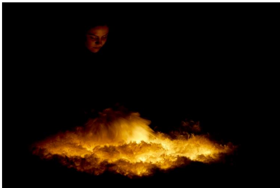
Slika 13. Rađanje života

Prva scena počinje sa rađanjem života. Sam porod prikazali smo tako što smo na hrpu stavili puno bijelog perja, a ispod perja lampice koje su titrale i svojim titranjem davale znakove disanja odnosno života. Iz bunta perja iskočilo je njih stotinjak - Smrt je uhvatila Noru. Tijekom četveromjesečnog istraživanja shvatili smo da želimo i moramo prikazati život kako bi Smrt imala na što djelovati. Dakle, na samom početku prikazuje se novi život po kojeg je Smrt došla. Međutim, prvi put se dogodi nešto da i Smrt izgubi „tlo pod nogama“. U trenutku preuzimanja života, Smrt je ispustila djevojčicu iz svojih ruku. Nikada prije joj se to nije dogodilo. Nikad prije nije nikog ispustila iz svojih ruku. Ovo je bila prva takva pogreška. Djevojčica joj se nasmijala, a sva djeca inače plaču kad se rode. To ju je zbunilo, ali i obradovalo jer je znala da će se ponovno sresti. U prvoj sceni upoznali smo publiku s glavnim protagonistima – sa Smrću i Norom.