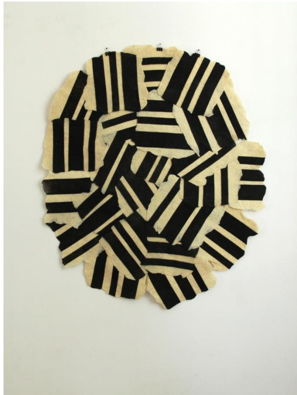
Slika 20. Prvi, središnji, podni dio postava