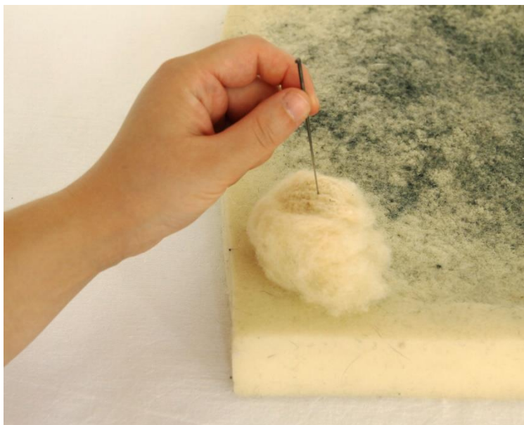
Slika 9. Dio procesa suhog filcanja

Gornji dio igle u obliku slova L sastoji se od ručice i trupa igle (kod industrijskih strojeva oni drže iglu na mjestu). Slijedi srednja oštrica koja na sebi nema zupce. Samo donja trećina ili četvrtina oštrice sadrži zupce te se naziva radnim dijelom oštrice. Oštrica igle može biti stožasta, trokutasta, zvjezdasta oblika. Trokutasta ima tri strane, a zvjezdasta četiri. Zvjezdaste imaju više zubaca jer sadrže veću površinu na koju se zupci postavljaju. Zupci su udubljenja na oštrici koja hvataju pojedina vlakna kada se igla zabije u masu vlakana. Ta zahvaćena vlakna su pogurnuta unutar mase gdje se upetljavaju s drugim vlaknima, što s vremenom stvara iglani filc. Zupci se mogu nalaziti u raznim pozicijama na oštrici i mogu biti različitih oblika i veličina. Oštrice se mogu razlikovati prema broju zubaca, a što ih je više, to se proces brže odvija. Vrh igle je jako oštar te je uz radni dio oštrice jako tanak pa lako može doći do puknuća. Bosti se treba pod istim kutom. Igle su dimenzionirane prema svom promjeru. Mjera igle definira se kao broj igala koji stane u kvadratni inč. Što je veća mjera, finije su igle. Mjere idu od broja 12 do 42. Za ovu tehniku uglavnom se koriste mjere od 36 do 42.