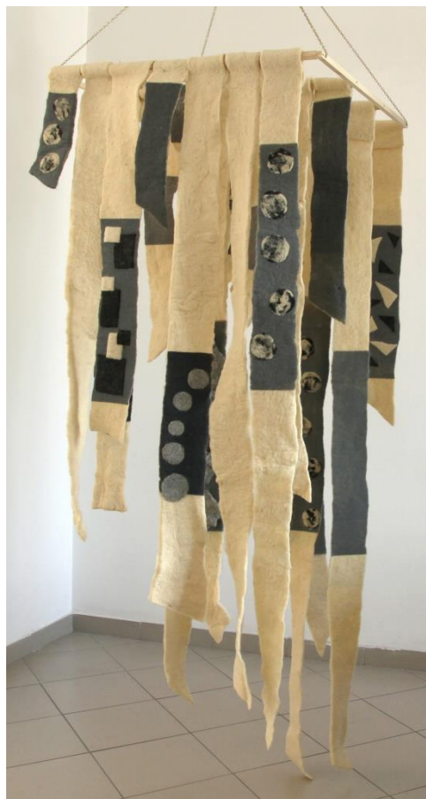
Slika 25. Središnja viseća instalacija