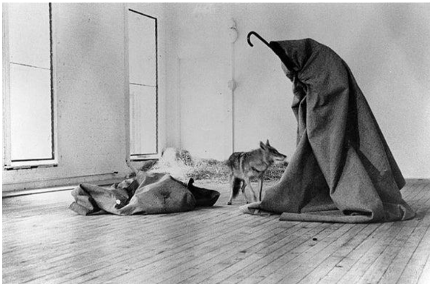
Slika 4. Joseph Beuys, Ja volim Ameriku i Amerika voli mene , 1974.