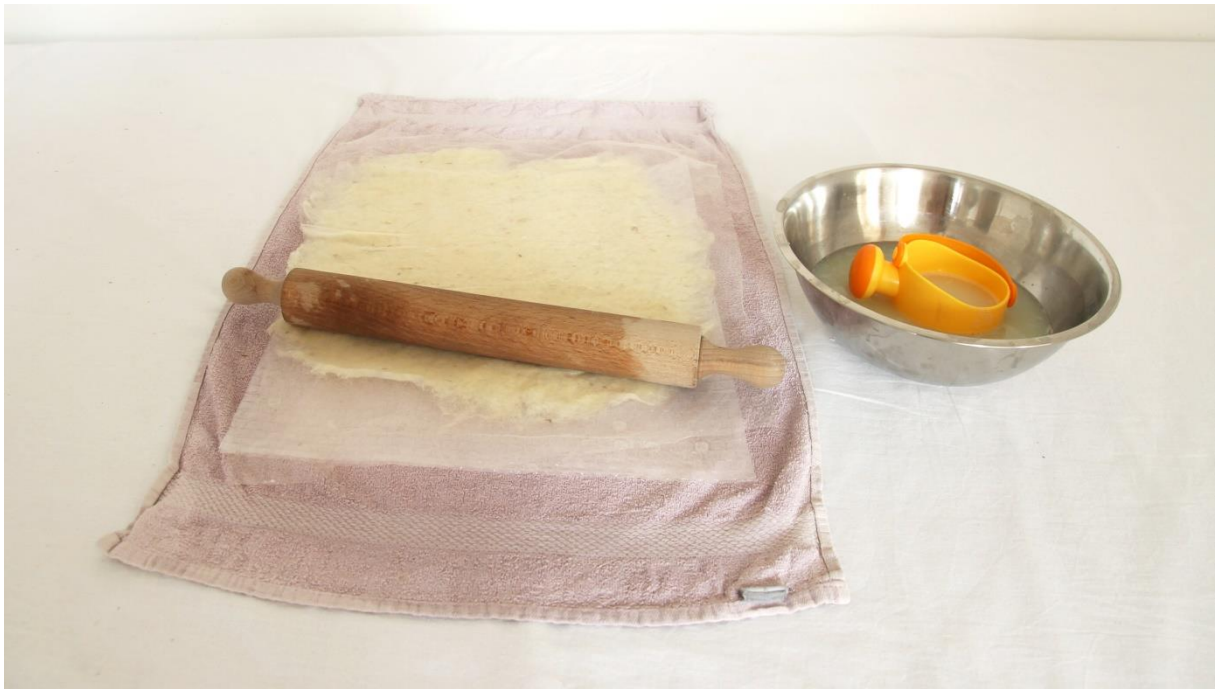
Slika 7. Dio procesa mokrog filcanja - močenje, filcanje, valjanje