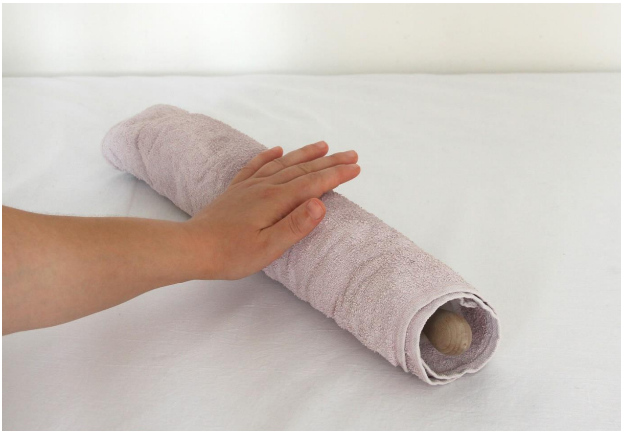
Slika 8. Dio procesa mokrog filcanja - valjanje