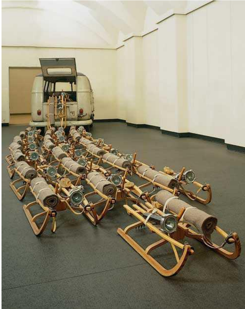
Slika 3. Joseph Beuys, Čopor , 1969.