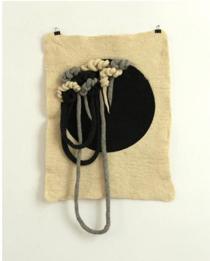
Slika 14. Dio zidnog postava (5)