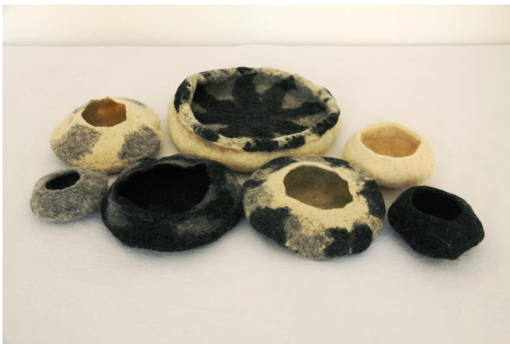
Slika 22. Treći, središnji, podni dio postava