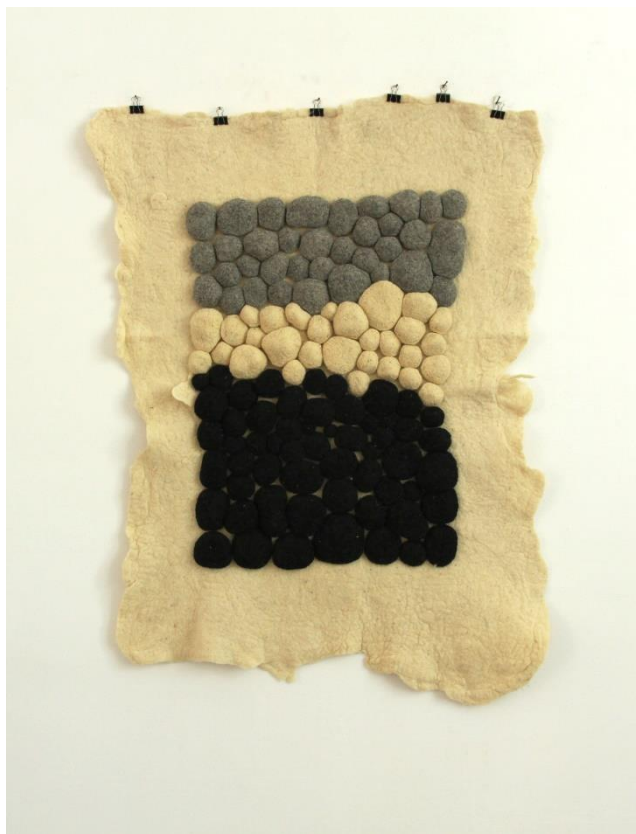
Slika 18. Dio zidnog postava (9)