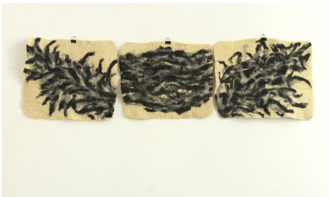
Slika 17. Dio zidnog postava (8)