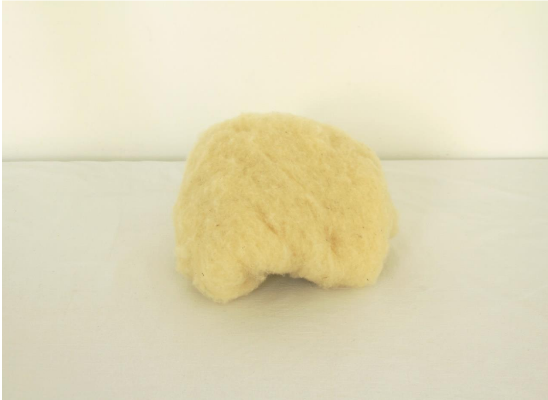
Slika 5. Neupredena vuna