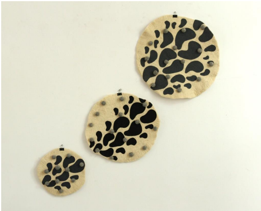
Slika 11. Dio zidnog postava (2)