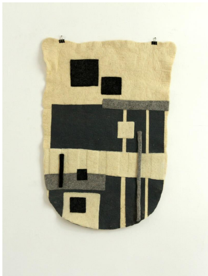
Slika 12. Dio zidnog postava (3)