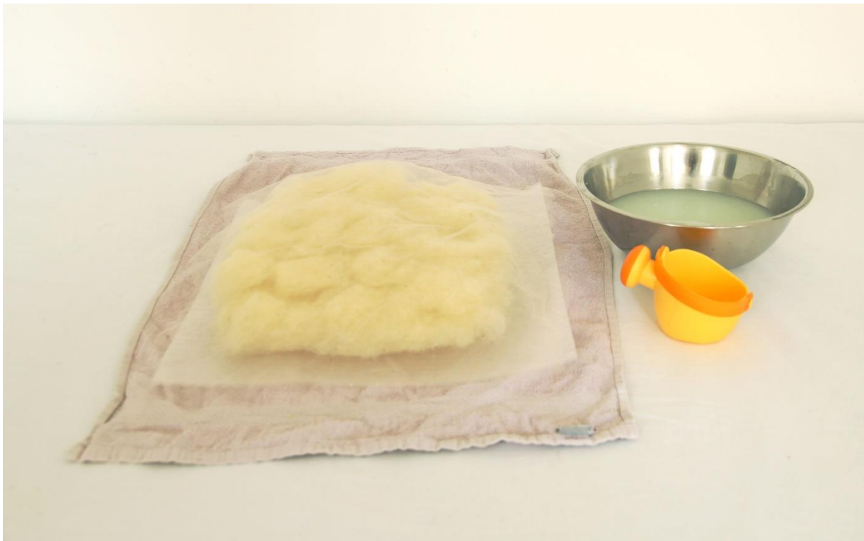
Slika 6. Dio procesa mokrog filcanja - slaganje vlakana prije močenja