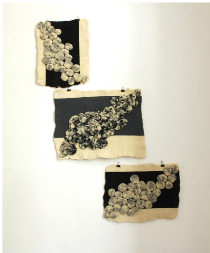
Slika 16. Dio zidnog postava (7)