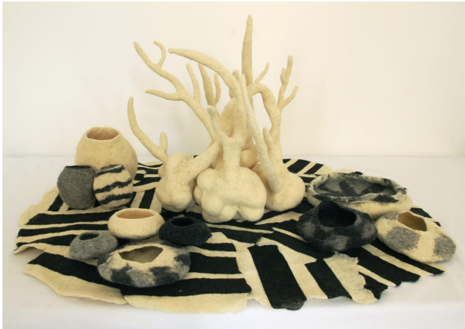
Slika 24. Središnji, podni postav - svi dijelovi zajedno