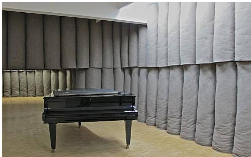
Slika 2. Joseph Beuys, Plight , 1985.

Farthing (2015:513) opisuje Beuysov performans Ja volim Ameriku i Amerika voli mene . Beuys je zrakoplovom otputovao u New York. Stigavši je vozilom Hitne pomoći prebačen u Galeriju Renée Blocka umotan u pokrivač. Tamo tri dana dijeli sobu s divljim kojotom komunicirajući s njim, spavajući na krevetu od slame, hodajući s pastirskim štapom i bacajući kožne rukavice. Na kraju performansa grli kojota, napušta galeriju i vraća se u zračnu luku. Američki Indijanci kojota smatraju bogom. Ovaj performans upozorava na propadanje domorodačke kulture, kritizira američki imperijalizam i Vijetnamski rat.