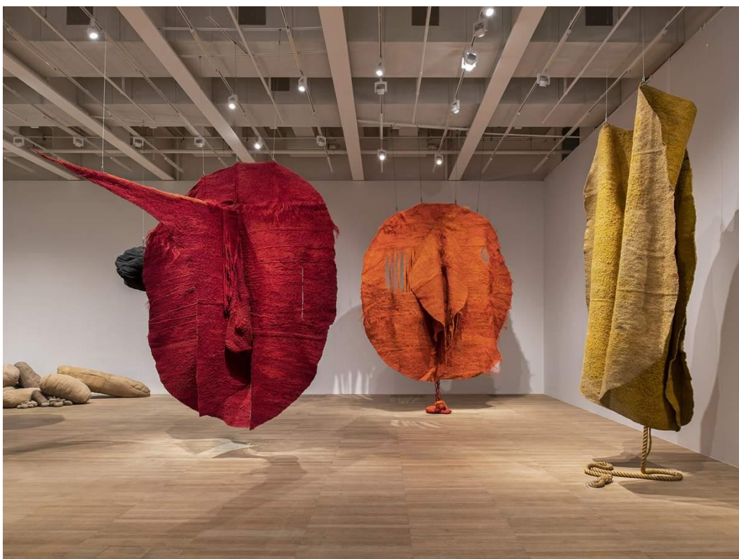
Slika 1. Magdalena Abakanowicz, Abakan Red, Orange, Yellow , 1968. - 1970.

materije povezane, ostvarena je u ovom djelu. Ovi kompleksni radovi su imponantni, puni tekstura i emocionalni. Oni su poput plovila koja nas pozivaju da uđemo i učahurimo se u njihovoj strukturi. Postavljeni u bliske formacije bacaju jezive sjene po zidu. Pomno osmišljeni aranžmani umjetnice, koje je nazivala i „okruženja“, počinju djelovati jezivo poznato. Pojedini komadi nalikuju na lica, umotana torza, strukturama oblika maternice. Glavne karakteristike koje ih odvajaju od nas, svjetovnih bića, njihovo je potpuno obojenje u crvene, narančaste i žute nijanse (onih izloženih u Tate Modern), koje im daju nadzemaljski izgled. Drugo što ih odvaja je snažni miris sisala i užadi, sastavnih dijelova njezine prakse 1970-ih godina.