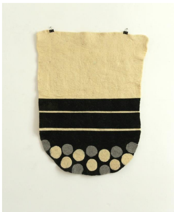
Slika 13. Dio zidnog postava (4)