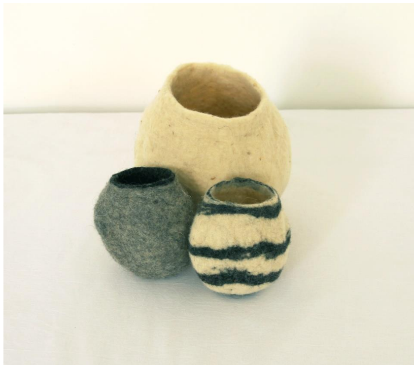
Slika 21. Drugi, središnji, podni dio postava