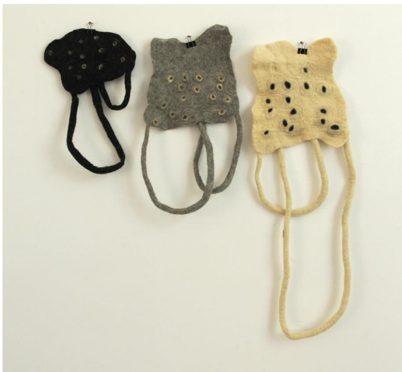
Slika 19. Dio zidnog postava (10)