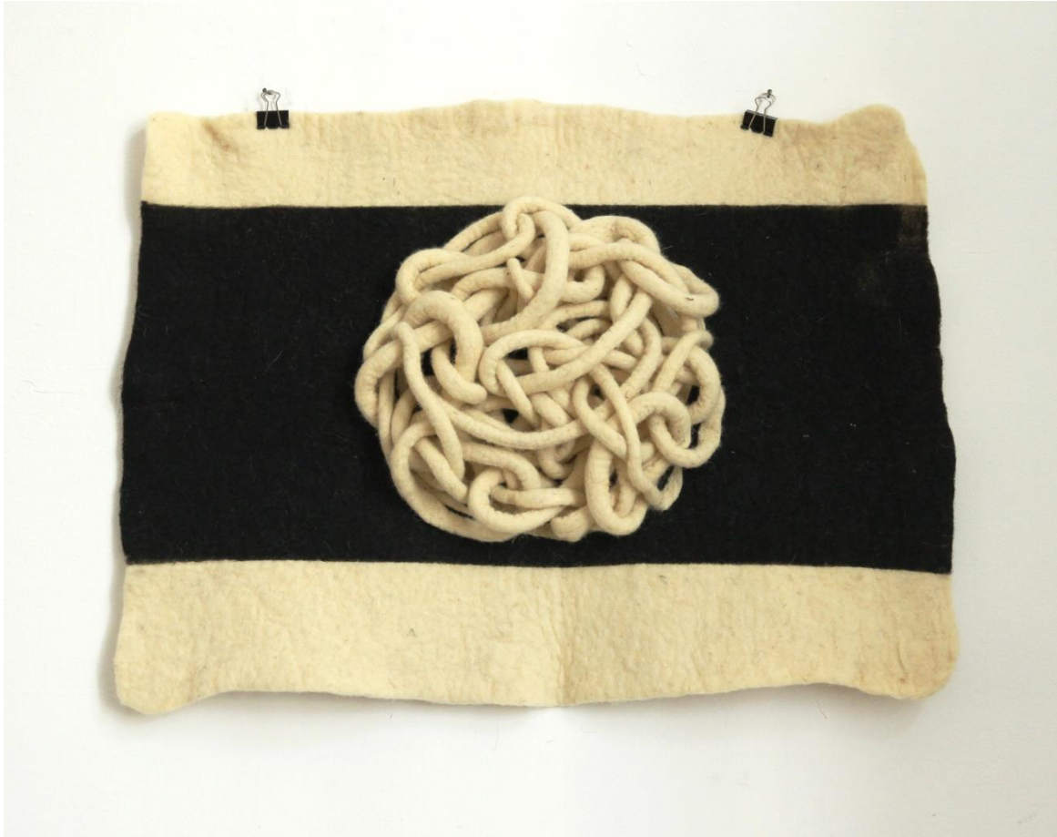
Slika 10. Dio zidnog postava (1)