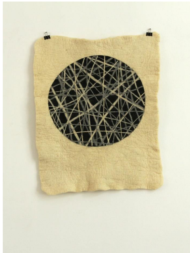
Slika 15. Dio zidnog postava (6)