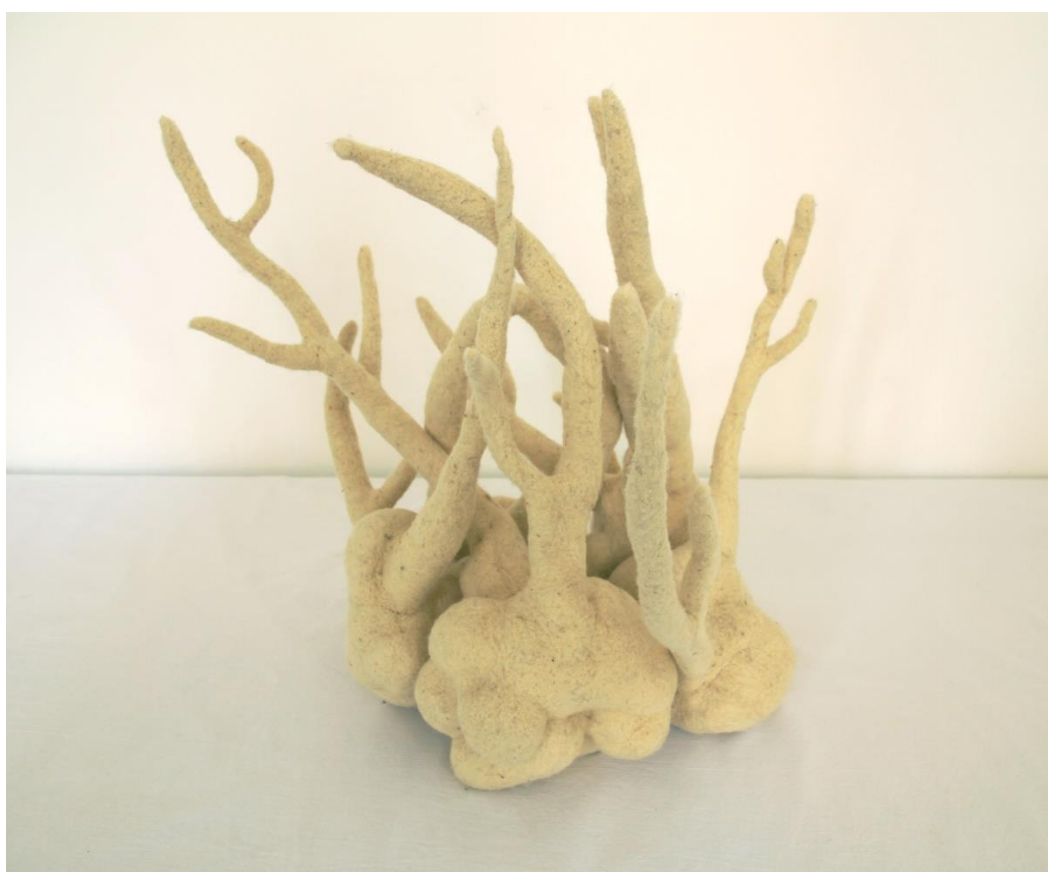
Slika 23. Četvrti, središnji, podni dio postava