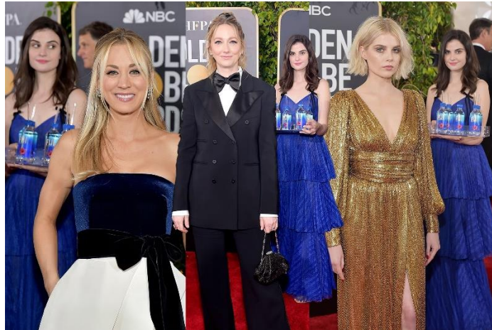
Slika 3. Fiji djevojka u pozadini poznatih glumica na crvenom tepihu Zlatnog globusa

glumaca. Slike su nakon događaja postale viralne te danima bile glavna tema internetskih šala, a hashtag #FijiGirl proširio se internetom (Coursera, 2024).