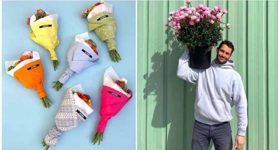
Slika 12. Buketi pop-up cvjećarne i začetnik ideje Simone Jacquemus s prepoznatljivim cvijećem

Ova je privremena trgovina nastala u vrijeme kada su brendovi tražili nove načine povezivanja s potrošačima, a Jacquemus je razmišljanjem izvan okvira nadvladao izvanrednu situaciju poput pandemije. Ranije je spomenuto kako je u sklopu poslovnog plana nužno postaviti pitanje ciljanog tržišta, no ono na što mnogi ne računaju je kako se odgovor koji je vrijedio pri nastanku poslovanja kasnije može znatno promijeniti. Neprestano se pojavljuju nova tržišta, a brojni marketinški gerila stručnjaci ostvaruju rekordne dobiti ciljajući baš na njih. Jedno od gerilskih pravila je da što se veći broj tržišta cilja, to se ostvaruje veća dobit; zato je bitno ne ograničavati marketing samo na jedno. U nesigurnim vremenima, kao što je, primjerice, globalna zdravstvena kriza, kada se poslovanje prisilno zaustavlja, a u pitanje dolaze kapital i materijalna sigurnost, u spas dolazi pravilno primijenjen gerilski marketing koji može omogućiti pozitivnu završnu bilancu (Levinson i sur., 2008).