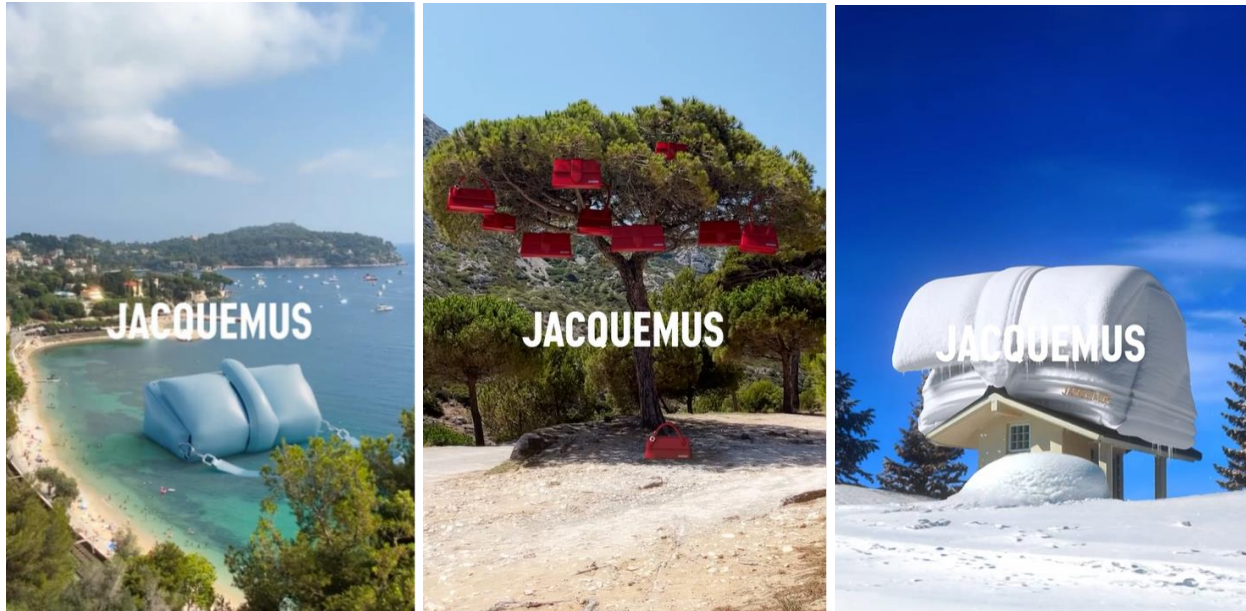
Slika 9. Scene videozapisa stvorene digitalnom 3D tehnikom prikazuju Bambino torbe u raznim situacijama

Digitalne tehnologije revolucionirale su način poslovanja poduzeća, od načina na koji komuniciraju s klijentima do načina na koji strukturiraju svoje interne operacije. Tvrtnice sada mogu iskoristiti digitalne tehnologije za stvaranje učinkovitijih i djelotvornijih procese kao i za stvaranje novih proizvoda i usluga koje ranije nisu bile moguće (Rathore, 2021). Jacquemusov marketinški tim pronašao je formulu uspješnih objava u obliku gerile, točnije 3D umjetnosti koja je zaintrigirala njihove pratitelje, ali i brojne druge. Zanimljive videosadržaje plasirali su umjereno u kombinaciji s ostalim objavama. Unatoč uspjehu takvog sadržaja, nisu ga koristili prekomjerno i zasitili publiku, već su ga dozirali povremenim objavljivanjem. Potaknuli su nagađanja i rasprave te nagomilali milijune pregleda i tisuće interakcija. Medium , Culted , Brand Insider , Hypebeast samo su neki od internetskih portala koji su pisali o uspjehu Jacquemus marketinga u svojim člancima. Uspješno su promovirali svoj brend i proizvode te postigli ono čemu svaka uspješna tvrtka teži – privući pažnju.