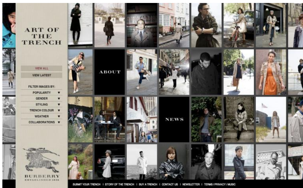
Slika 5. Burberry kampanja „Art of the Trench”

Primjerice, britanski luksuzni modni brend Burberry pokrenuo je gerilsku marketinšku kampanju pod nazivom „Art of the Trench” (hrv. Umjetnost balonera). Kampanja je pozvala ljude iz cijelog svijeta na slanje vlastitih fotografija u balonerima ove marke nakon čega su odabrane fotografije predstavljene na posebnoj mrežnoj stranici. Slike su prikazivale prepoznatljivi modni komad ovog brenda na njihovim kupcima svih uzrasta i raznih stilova nošen na brojne načine. Ova kampanja ne samo da je angažirala kupce već je stvorila i osjećaj zajednice i autentičnosti oko robne marke. Također je svojom uspješnom komunikacijom omogućila ljudima sudjelovanje u priči o Burberryju i prikazala svestranost njihovog proizvoda (Medium, pristup: 10. 5. 2024.)