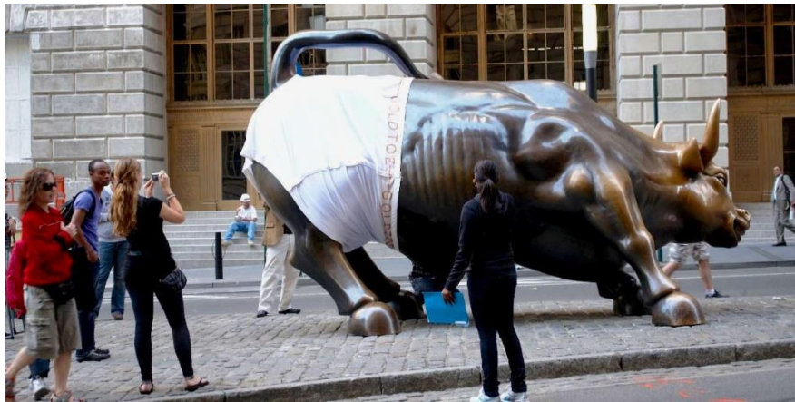
Slika 1. Bik na Wall Streetu u donjem rublju marke GOLDTOE kao primjer 'outdoor' gerila marketinga

Primjer ovakvog događaja lansiranje je nove kolekcije donjeg rublja marke GOLDTOE 2010. godine. Kako bi što zanimljivije predstavili novu liniju svojih proizvoda, poznati kip bika, koji je simbol njujorške burze i Wall Streeta, obukli su u ogroman par bokserica brenda. Taktika je bila vrlo jednostavna, ali svejedno učinkovita zbog očitog humora i uočljivosti. Financijska su ulaganja bila minimalna, a cijeli je događaj privukao medijsku pažnju kao i veliki broj zainteresiranih prolaznika (Coursera, 2024).