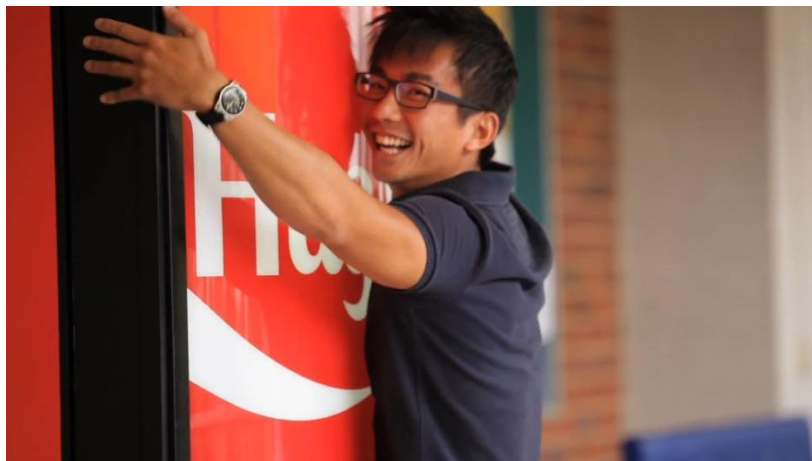
Slika 4. Coca-Cola automat u sklopu svoje gerila kampanje kao valutu prihvaća samo zagrljaje