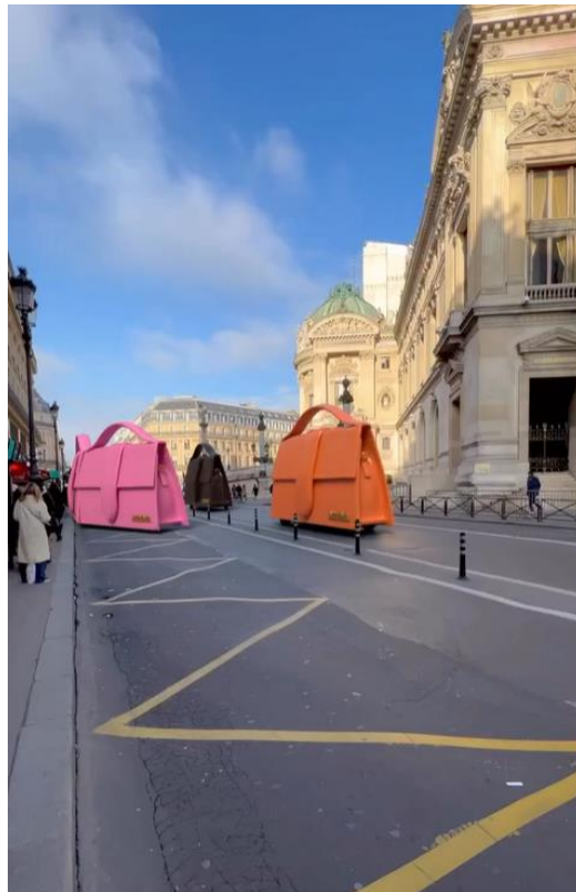
Slika 8. Prizor uvećanih verzija Jacquemus torbi u Parizu

U travnju 2023. godine brend je objavio video na svojim profilima društvenih mreža koji prikazuje njegove prepoznatljive modele torbi naziva „Bambino“ u iznimno uvećanoj verziji kako se voze ulicama Pariza. Prolaznici neometano hodaju pločnikom, a ostatak prometa odvija se bez ikakvih problema. Na jednom dijelu kolnika ispisane su riječi „BAMBINO“ i „JACQUEMUS“ u stilu prometnih oznaka. Ovaj video od samo sedam sekundi ubrzo je skupio milijune pregleda, ali je u isto vrijeme i zaintrigirao korisnike društvenih mreža. Dok se veliki dio publike divio ideji, mnoge je ova objava zbunila ne znajući radi li se o stvarnom događaju ili je sve inscenirano naprednom tehnologijom. Naime, snimka izgleda prilično realno pa se moglo pomisliti kako su autobusi ili neka slična vozila „obučena“ u torbe i tako se vozažu gradom u sklopu marketinške kampanje. S druge strane, pogledavši video bolje, očito je kako prednji dio „vozila“ nema stakla koje bi omogućilo preglednost i sudjelovanje u prometu. Zbog toga se počelo nagađati kako je cijela scena ipak proizvod računalno generirane grafike (CGI) ili umjetne inteligencije (AI). Ispod objave osim brojnih pohvala, mnogi su se pitali je li prizor stvaran, a neki su korisnici podijelili video sa svojim teorijama o istinitosti cijelog događaja.