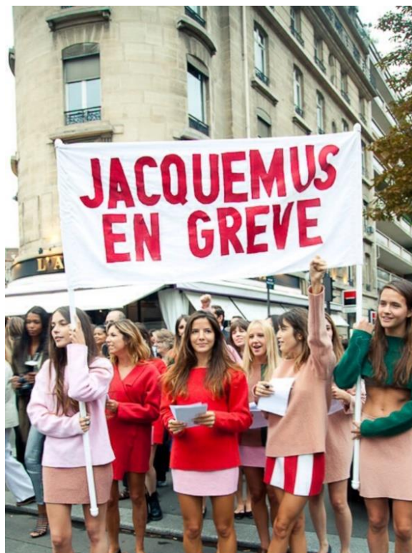
Slika 13. Prikaz Jacquemus gerilskog štrajka

Znajući kako je moda ono čime se želi baviti, Simone Porte Jacquemus kao mladi samouki kreator morao je stvoriti ime u luksuznom svijetu. Kako bi to postigao, potrebno je neizostavno obilježje svake gerilske tvrtke - brendiranje. Ono stvara svijest o tvrtki koja je iznimno vrijedna jer donosi ugled i vjerodostojnost. Svijest stvara povjerenje kod potrošača, a povjerenje je ključ prodaje. Jednom kada naziv tvrtke ostane zapamćen u glavi kupca, ostvarena je svijest o njoj. To se postiže neprestanim ponavljanjem naziva raznim marketinškim akcijama. To može biti nošenje velikog transparenta s imenom, stvaranje buke za privlačenje medija koji će potom izvještavati o vama, neprestano predstavljanje tvrtke i pričanje o njoj, pa čak i upoznavanje s ljudima na ulici te ostavljanje e-maila u nadi da će oni postati vaši potencijalni kupci – Simone je znao kako su mogućnosti nebrojene. Važno je biti stalno izložen klijentu kako bi mu se prodrlo u podsvijest gdje se donosi većina odluka o kupnji. Ime mladog dizajnera čut ćete možda prvi puta kada pročitate u novinama kako je izazvao pomutnju na ulici. Zatim ćete vidjeti na TV-u prizore tog događaja. Onda će jedan od medija prenijeti njegovo upoznavanje s poznatom urednicom uglednog modnog časopisa. Kada se za godinu dana pojavi kao novo lice na Tjednu mode, on za vas neće biti