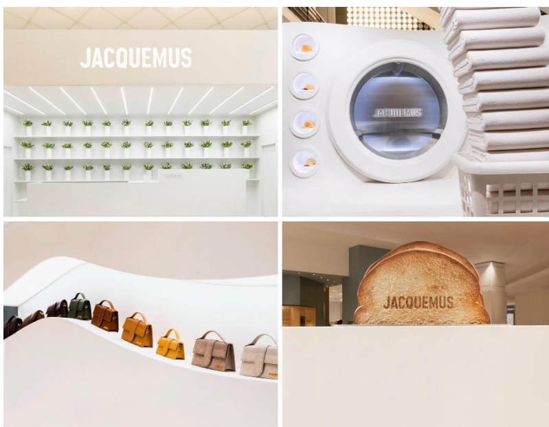
Slika 10. Dijelovi pop-up trgovine u Parizu

Nedugo nakon, otvorena je trgovina sličnog koncepta ljetnog mediteranskog stila na talijanskom jezeru Como (grad Cernobbio) što je najavljeno prethodno istaknutim videom digitalne 3D umjetnosti. Uslijedio je i pop-up butik u Portofinu, a zatim i u St. Tropezu gdje su otišli korak dalje započevši suradnju s kulturnim lokalnim restoranom Indie Beach. Smješten na dinama plaže Pampelonne, restoran je svojim gostima nudio boravak u privatnom odmaralištu dizajna s Jacquemusovim potpisom. Tako je brend po prvi puta dizajnirao opremu za plažu prenoseći svoj stil na ležaljke, suncobrane, jastuke i ukrasne daske za surfanje. U blizini je bila smještena i Jacquemusova pop-up trgovina odabranih ljetnih komada odjeće i modnih dodataka (The Spaces, 2024). Završetkom ljeta modna se kuća s mediteranskih destinacija u jesenjim danima preselila u Južnu Koreju, preciznije, popularnu četvrt Seongsu glavnog grada Seoula. Prateći ton digitalnog sadržaja društvenih mreža, kreirana je pop-up trgovina čije pročelje izvana izgleda poput prepoznatljive Bambino torbe. Unutar prostora koji je bio otvoren 10 dana nalazio se kafić s osam pića i cvjećarnica s bijelim buketima lizijantusa uz dodatke iz tada Jacquemusove posljednje kolekcije. Trešnje su bile uvelike zastupljene u kolekciji kao i u reklamnoj kampanji, a ostavile su svoj trag i u pićima s temom trešnje (WWD, 2023).