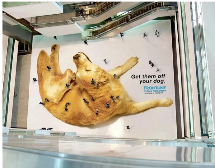
Slika 2. Tvrtka Frontline iskoristila je slučajne prolaznike kako bi oglasila svoj sprej protiv buha

Tvrtka Frontline iskoristila je ovakvu vrste gerile kada je odlučila predstaviti svoj sprej protiv buha kod pasa. Zakupili su dio trgovačkog centra te na njega zalijepili ogromnu sliku zlatnog retrievera koji se češe. Kupci u prolazu hodajući preko slike s kata iznad izgledali su poput buha koje smetaju psu te su tako nesvjesno pomogli Frontlineu u oglašavanju (Coursera, 2024).