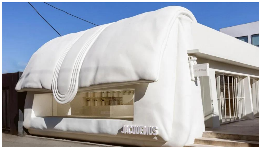
Slika 11. Jacquemus pop-up trgovina u Seoulu dizajnirana u obliku poznatog modela torbe brenda

Otvaranjem privremenih trgovina na dva kontinenta u istoj godini Jacquemus je ne samo postao svojevrsni pop-up majstor već je i proširio svoju prisutnost na globalnoj razini. Dao je primjer kako se imidž, poruka i identitet brenda mogu komunicirati sa širom publikom održavajući je zanimljivom i originalnom.