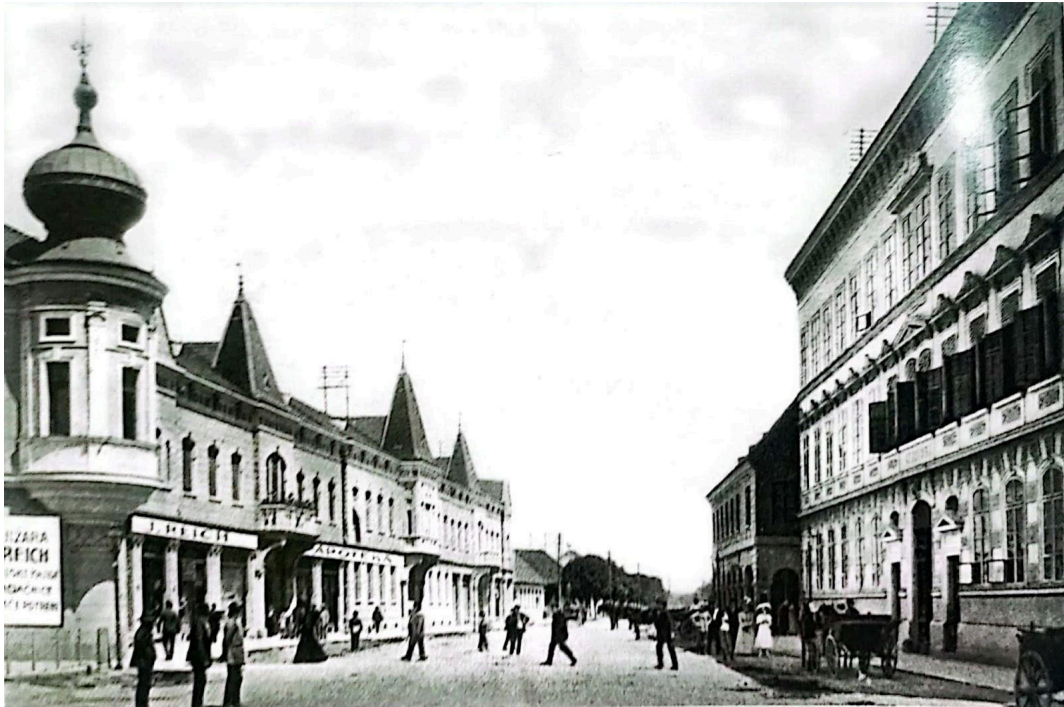
Slika 8. Vinkovačka gimnazija i korzo