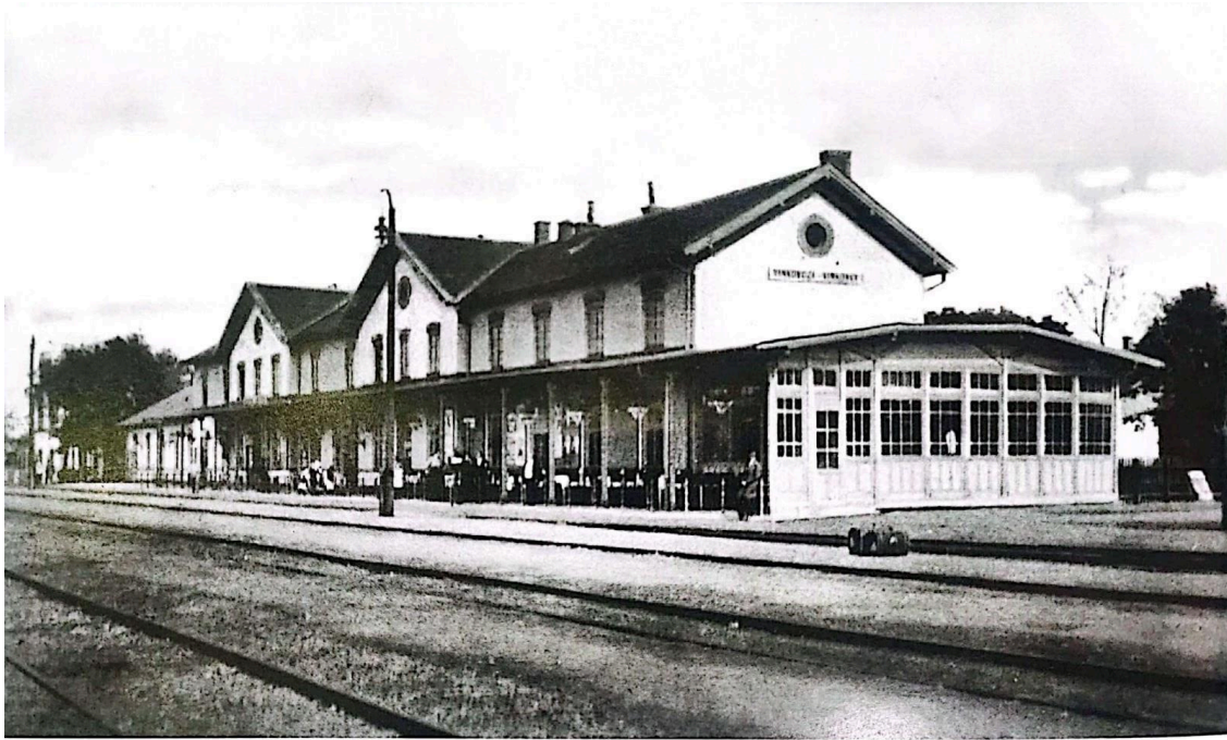
Slika 2. Željeznički kolodvor Vinkovci