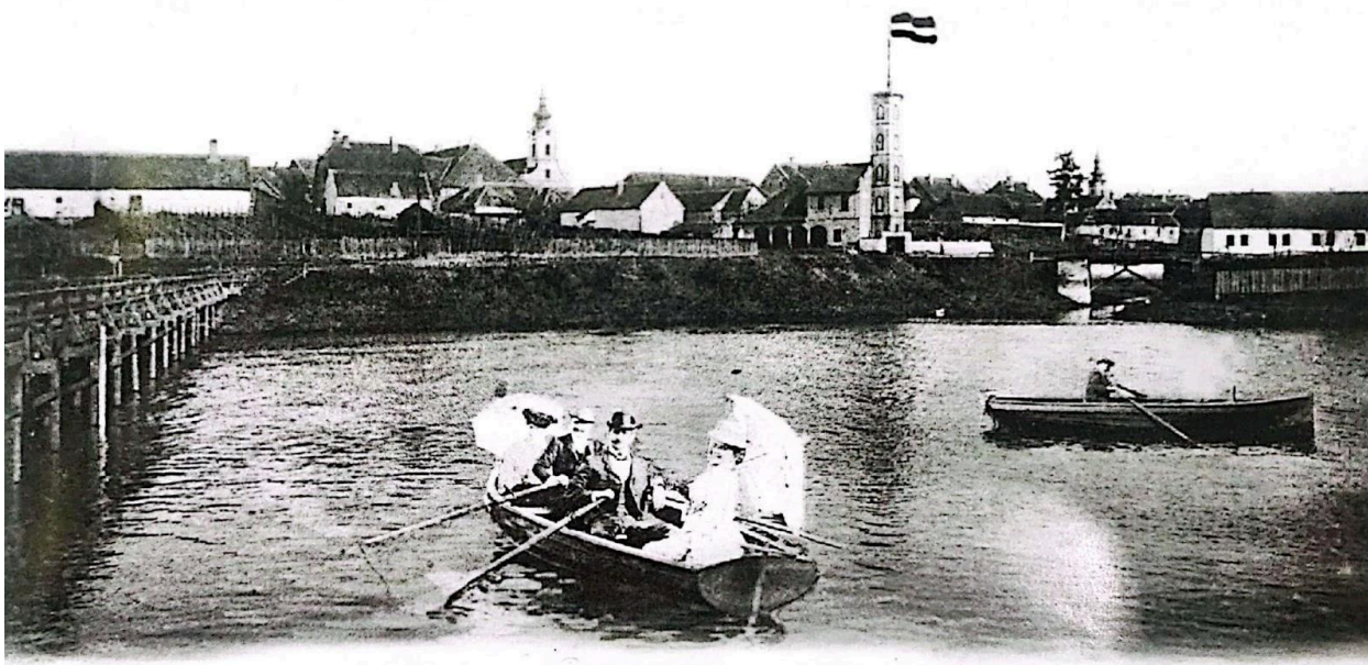
Slika 4. Rijeka Bosut