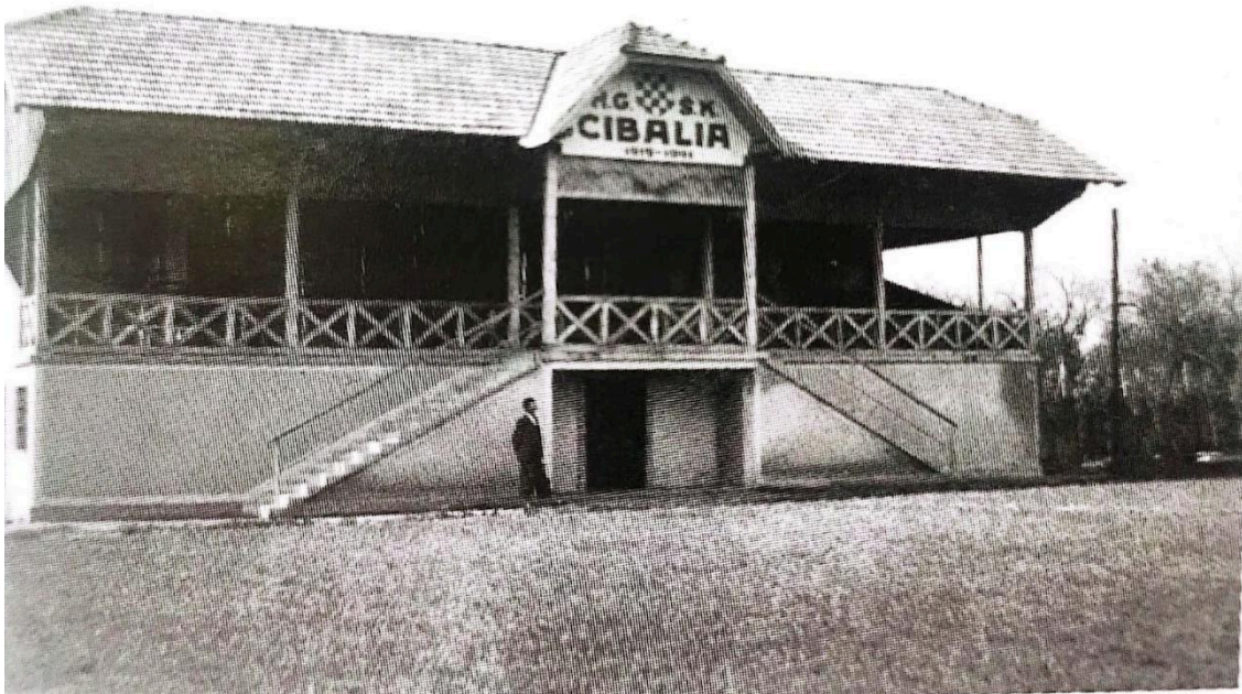
Slika 6. Prvi stadion HNK Cibaliije