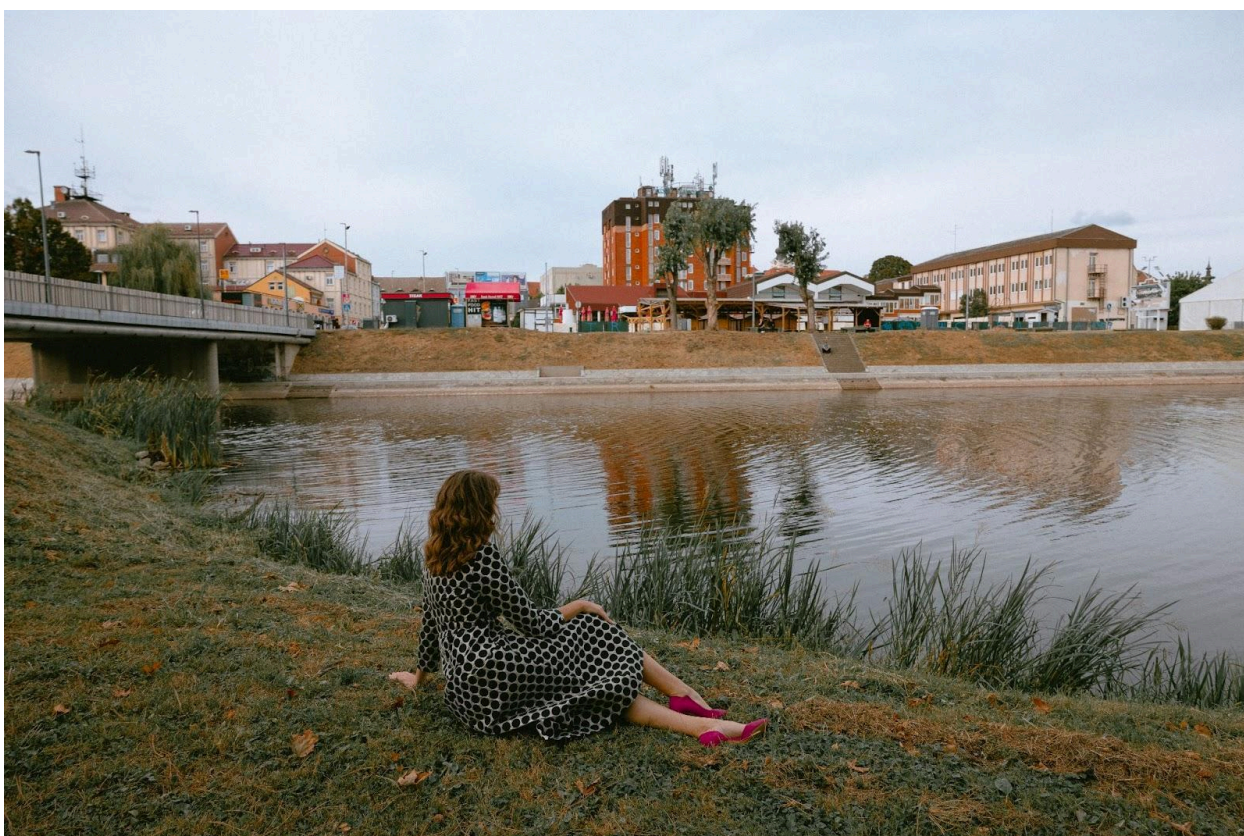
Slika 5. Rijeka Bosut danas