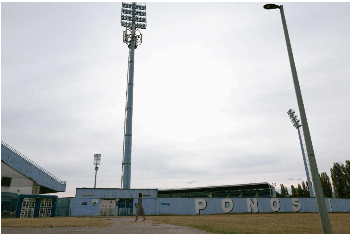
Slika 7. Sadašnji stadion HNK Cibaliije