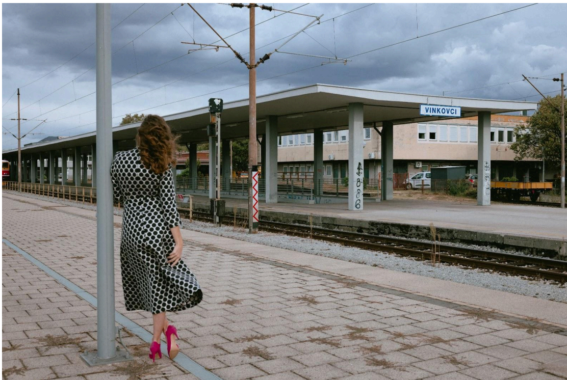
Slika 3. Željeznički kolodvor Vinkovci danas