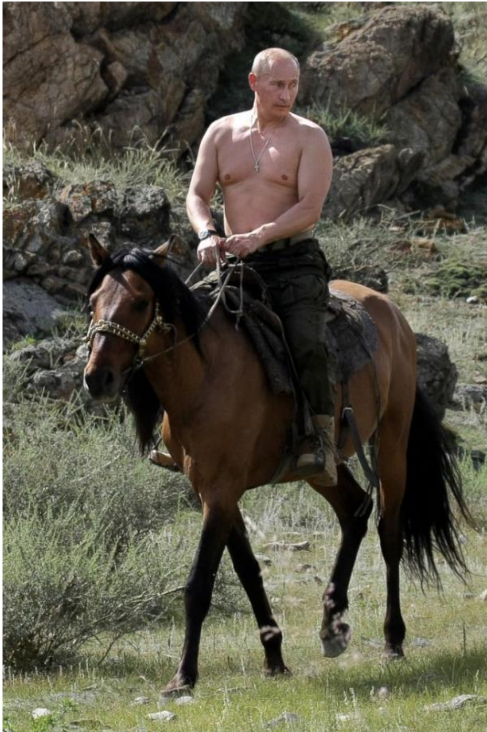
Slika 4. Vladimir Putin golog torza na konju 2009.