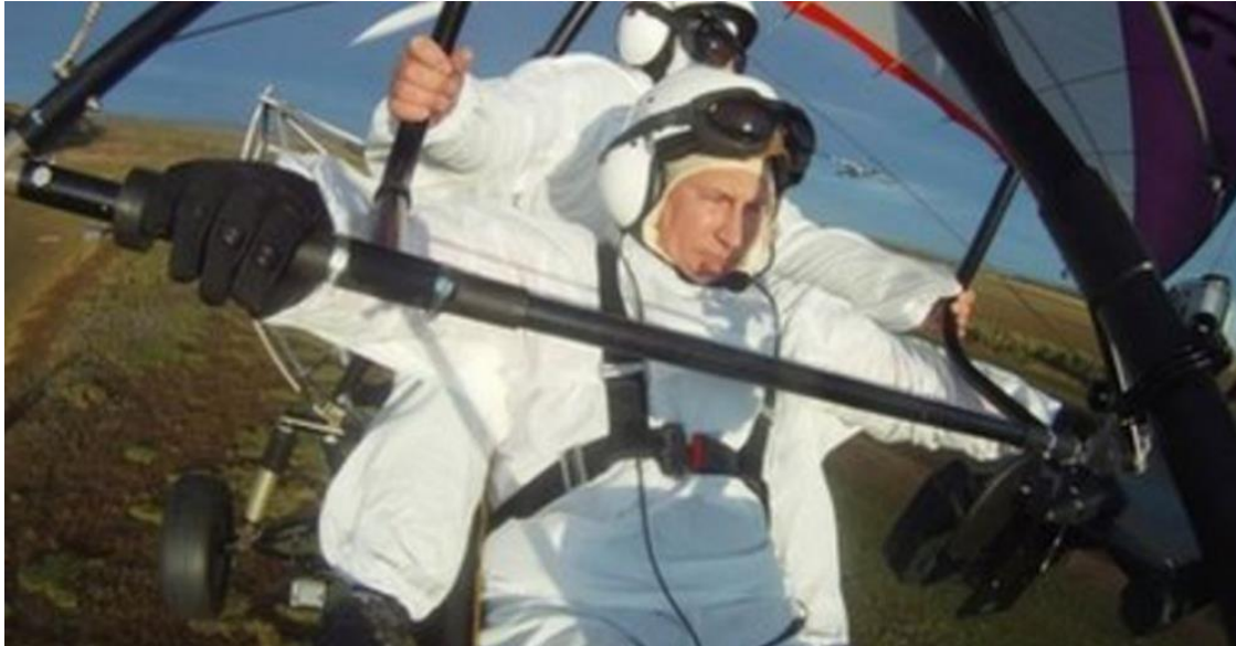
Slika 2. Vladimir Putin vozi letjelicu