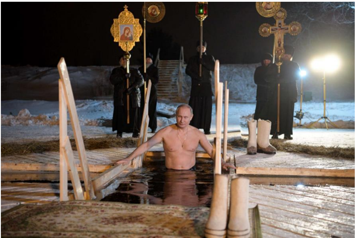
Slika 5. Vladimir Putin okupao se u ledenom jezeru uoči pravoslavne tradicije Bogojavljanja

Konkretna fotografija daje do znanja da je Putin snažan i odlučan lider. Kroz ovaj vizualni prikaz, on pokazuje svoju fizičku spremnost i sposobnost da se nosi s izazovima. Putinu je važno da se prikaže kao netko tko nije samo političar za uredskim stolom, već i kao fizički spreman i hrabar vođa. Ovakve slike služe da se Putin prikaže kao vođa koji je u kontaktu s prirodom i sposoban za fizičke izazove, što pomaže u izgradnji slike nacionalnog heroja. Pokušava zapravo svima pokazati da iza političke moći stoji i stvarna snaga.