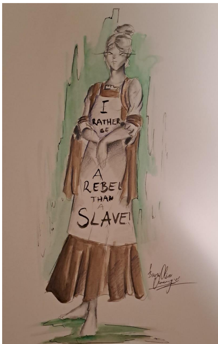
Slika 6: Skica Jenny.

Jenny – za ovog lika odabrana je smeđa boja. To je boja zemlje i jeseni, a prema nekim tumačenjima i umiranja. Označava boju mira i odmora, a mnoge je religije povezuju s propadanjem, umiranjem i truljenjem. Smeđa je boja bitna za ovog lika jer se radnja odvija u prostoru tamnice u kojoj Crni Čovjek muči junakinju koja se pridružila sufražetkinjama u otporu. U odnosu na Crnog Čovjeka koji ima plavu boju i koja označava sigurnost, pa je iz tog razloga policijski službenici nose, Jenny nosi smeđu boju otpora koju su koristili i neki vojnici tijekom Drugog svjetskog rata – odnos je takav da opravdava otpor koji policija pokušava ugasiti. To dobro služi priči jer pomaže poduprijeti povijesnu činjenicu da su sufražetkinje u zatvorima prisilno hranili i mučili, a sve zato što su htjele svoje pravo glasa.