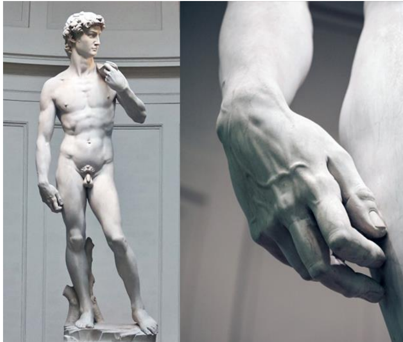
Slika 1. – Primjer skulpture izrađene u mramoru, Michelangelo, David , 1501.-1504., mramor

Kamen je prirodni materijal koji se sastoji od jednog ili više različitih minerala. Njegov sastav i podrijetlo određuju svojstva poput: tvrdoće, lomljivosti, poroznosti, otpornosti na razne utjecaje i sl.. Prema podrijetlu nastanka razlikujemo kamenje: vulkanskog, sedimentnoga i metamorfnoga podrijetla, a među najpoznatije vrste spadaju: mramor, vapnenac, granit, kvarc, bazalt, pješčenjak, škriljevac i dr. 2 U kiparstvu se kroz povijest najviše koristio i cijenio plemeniti mramor, vrsta vapnenca s određenim primjesama, od kojega su izrađena brojna remek djela svjetske umjetnosti (Slika 1).