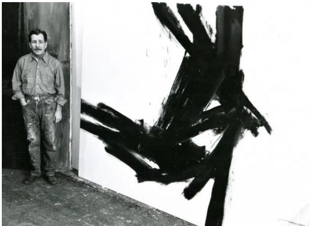
Franz Kline u ateljeu, New York, 1956.