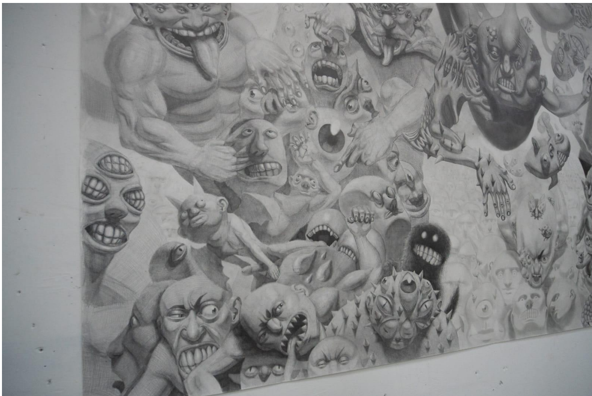
Slika 3. „Inferno”, detalj, lijeva strana rada