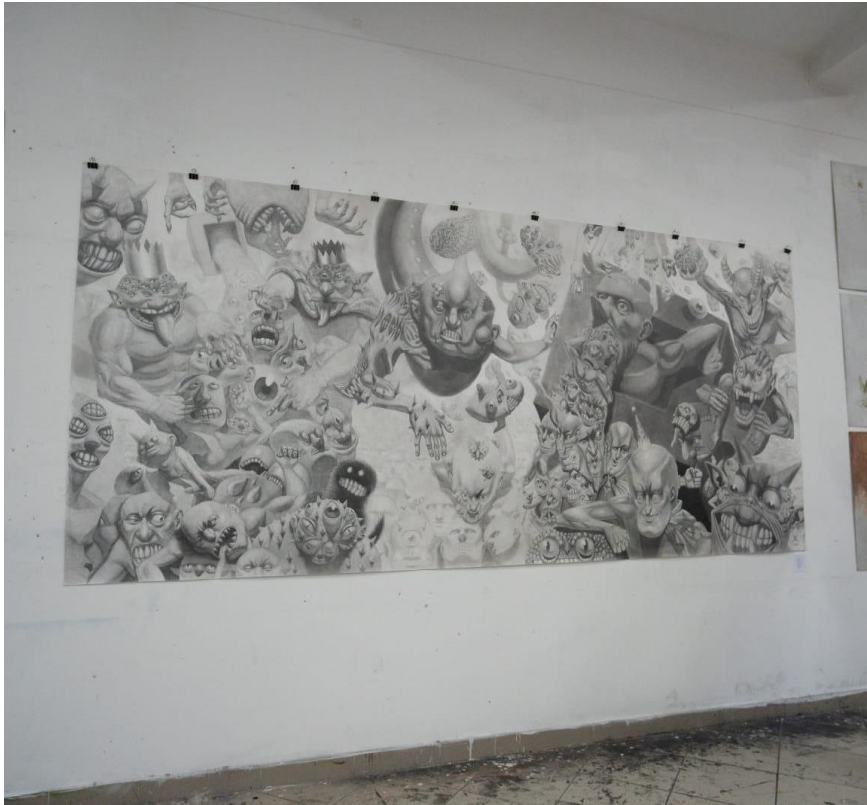
Slika 2. „Inferno” u galerijskom prostoru