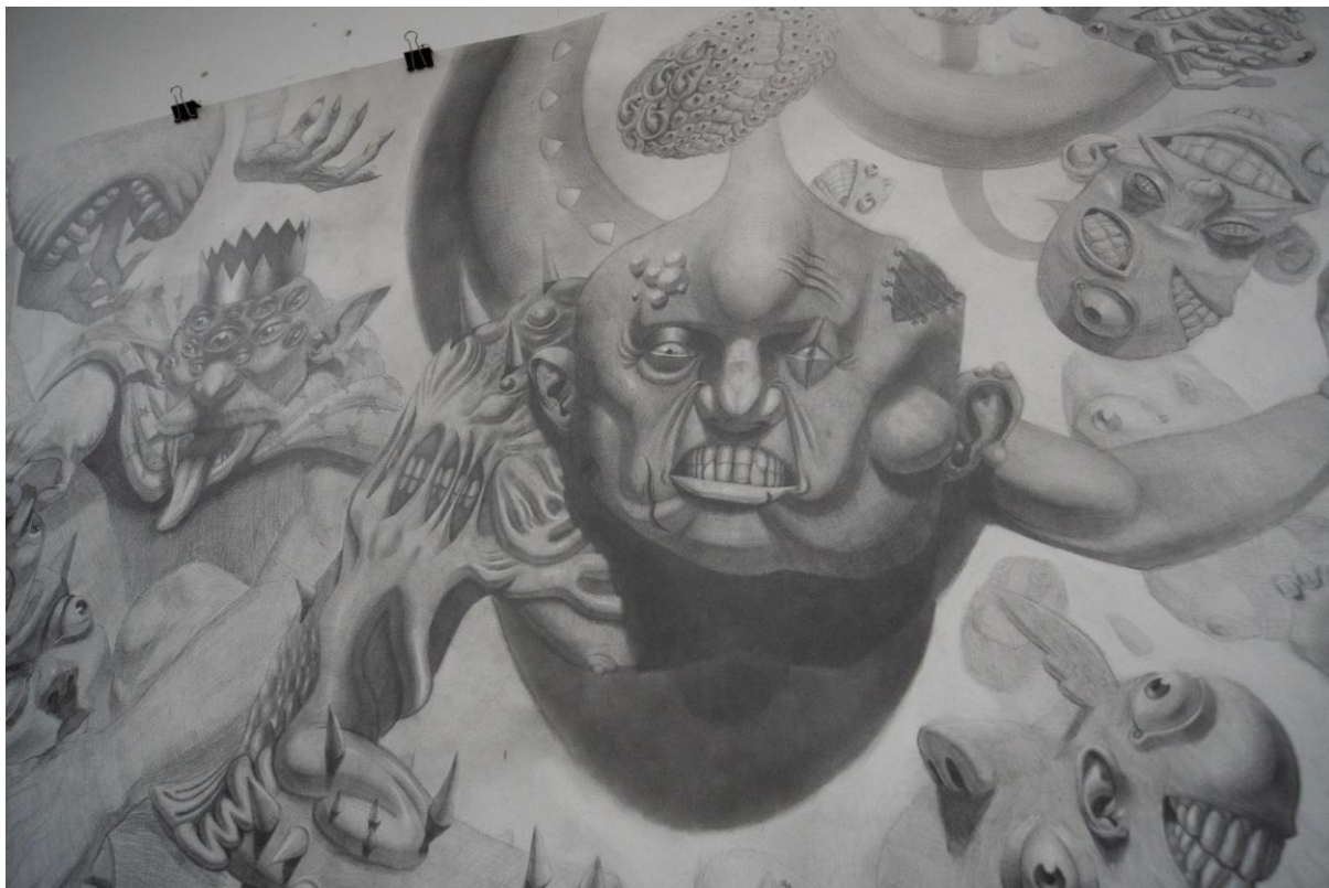
Slika 5. „Inferno”, detalj, sredina rada