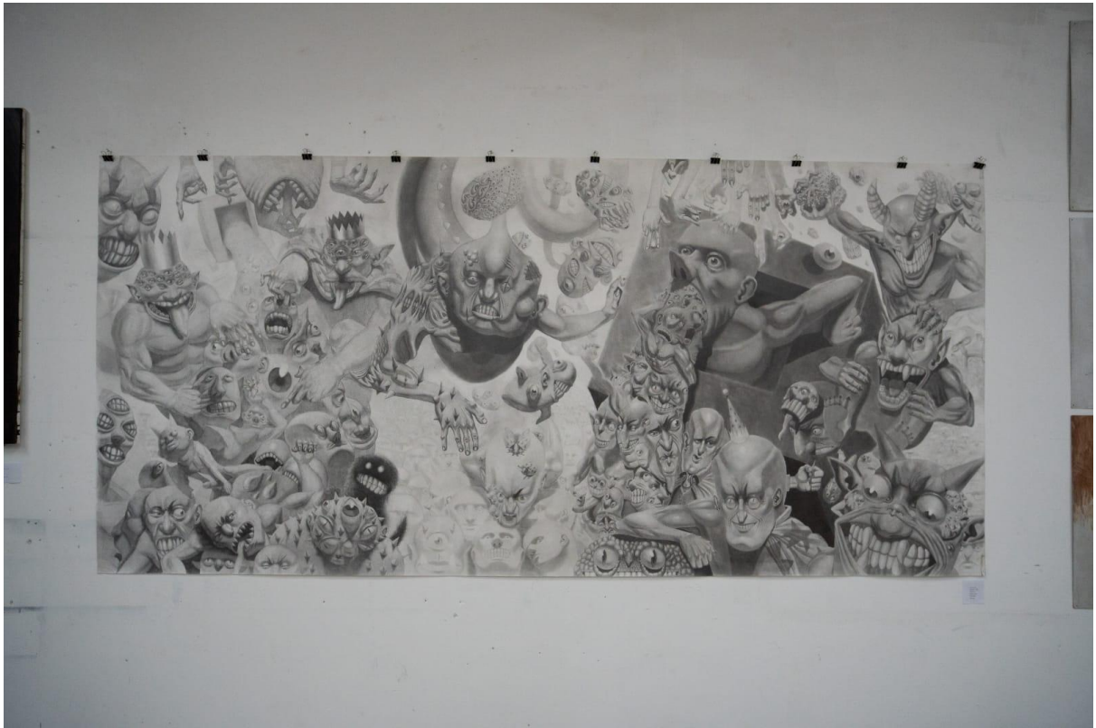
Slika 1. „Inferno”, završni rad