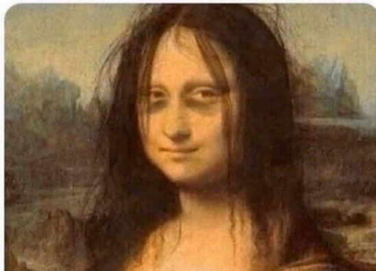
Slika 5.