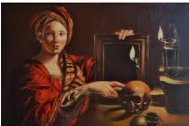
Slika 1.

When the sign in the museum tells you not to touch anything