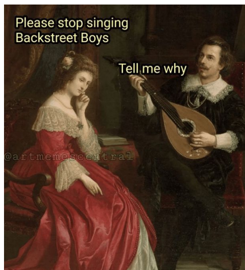
Slika 7.