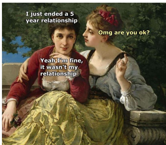
Slika 2.