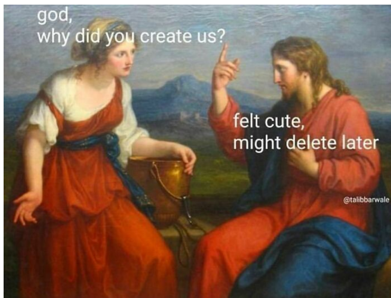
Slika 6.