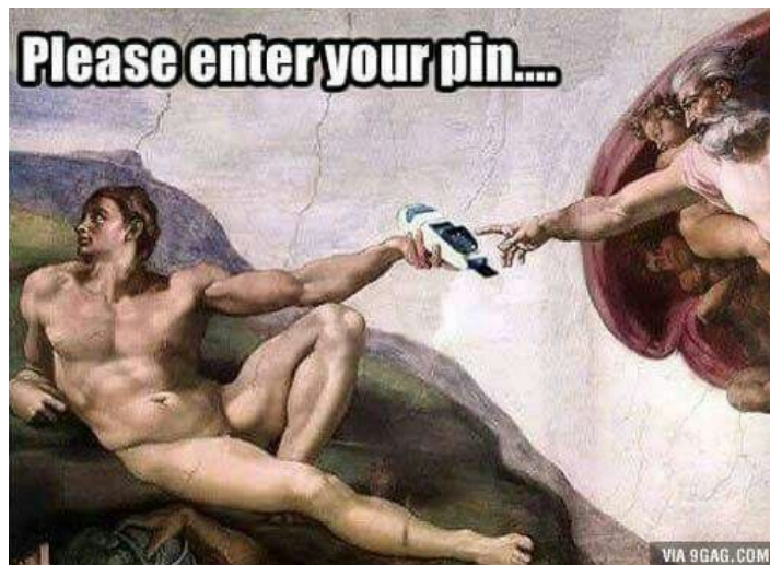
Slika 3. Preuzeto u cijelosti (Pinterest)