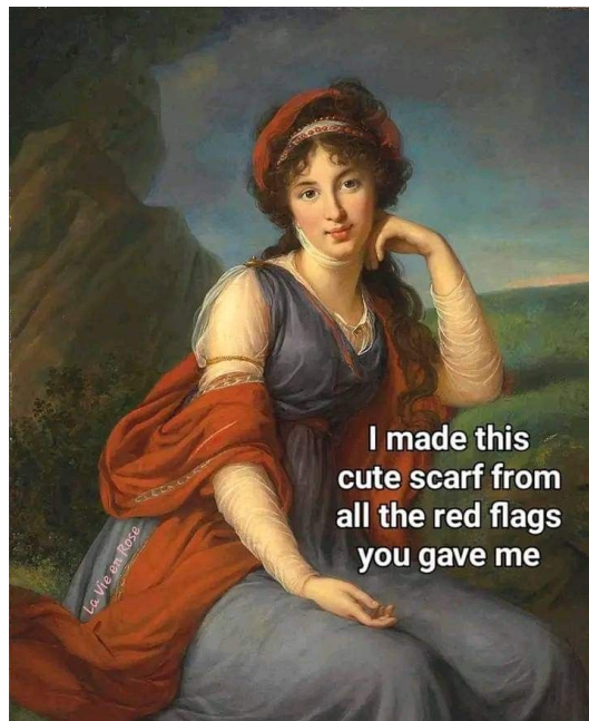
Slika 8.