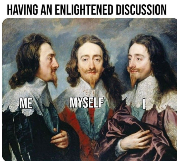
Slika 10.