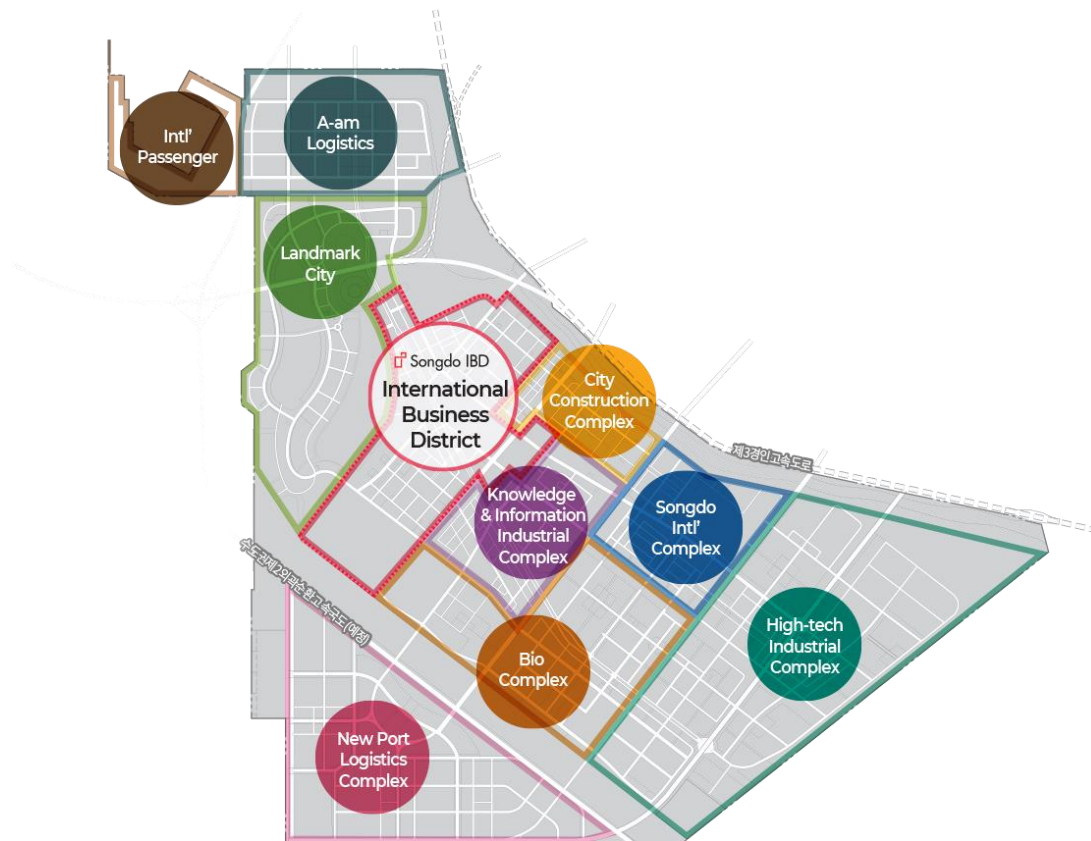
Slika 1. Kompleksi poslovnoga distrikta grada Songdo