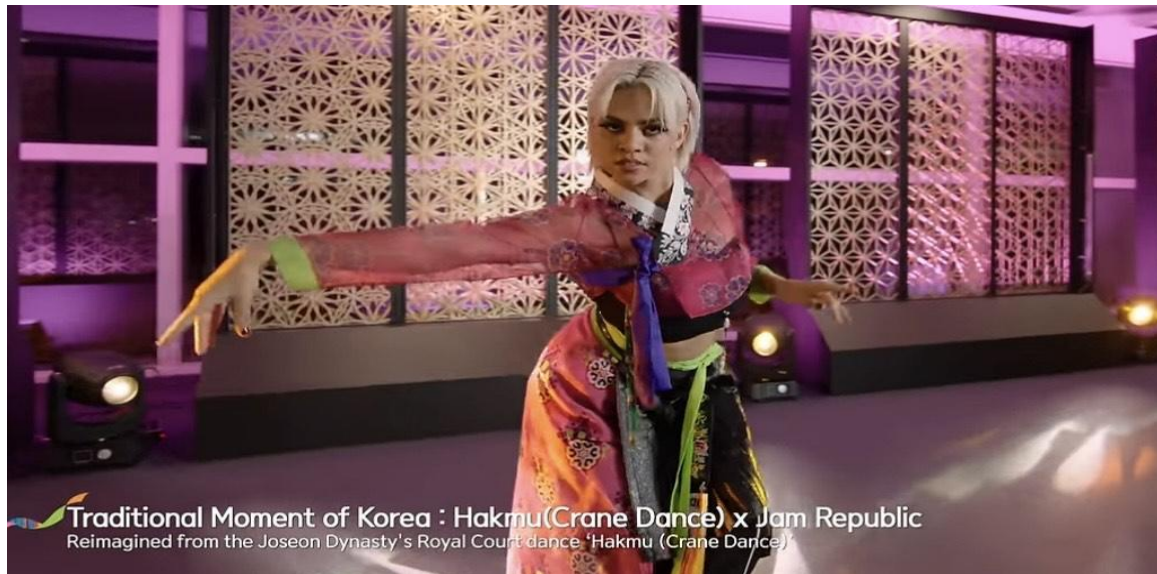
Slika 7. Isječak iz promotivnog videa suradnje Jam Republic i aerodroma Incheon

sučelje za simulaciju plesnih pokreta i omogućavaju korisniku da se i on „uključi“ u ples te dobije osjećaj pripadnosti.