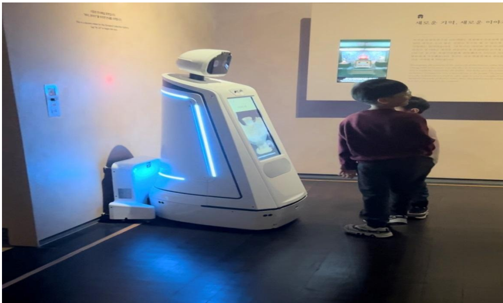
Slika 3. Robotski asistent u Nacionalnom muzeju u Seoulu

rabiti aplikacije proširene stvarnosti kako bi vidjeli rekonstrukcije povijesnih lokacija u njihovu izvornom obliku ili otkrili stranice s proširenom stvarnošću koje prikazuju dodatne značajke te informacije o povijesnim i kulturnim objektima. Osim toga, taj muzej svojim posjetiteljima nudi robotske asistente koji s njima mogu provesti cijeli dan razgledavajući građu, a gdje pojedinac može zatražiti pomoć na četirima različitim jezicima: engleskome, korejskom, kineskome te japanskome. Nadalje, muzej rabi i audiozapise kako bi što značajnije poboljšao iskustvo posjetitelja. Posjetitelji koji sami odluče istraživati muzej pomoću pametnih uređaja, mogu navigirati građom te dobiti dodatne informacije, videozapise ili interaktivne prikaze o povijesnom i kulturnom kontekstu predmeta. Uz to, VR aplikacije omogućavaju virtualne obilaske muzeja i galerija, što je posebno korisno za one koji zbog ograničenih mogućnosti putovanja ne mogu fizički posjetiti ta odredišta (web portal Nacionalnog muzej Koreje).