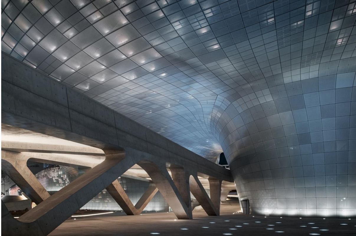
Slika 4. Vanjski noćni izgled Dongdaemun Design Plaze, Izvor: https://parametric-architecture.com/dongdaemun-design-plazas-curvaceous-parametric-facade-by-zha/ (30. studenoga 2022.)

modela, pikseli ranom i perforiranom. Time je osigurano da zgrada ima dinamičan vizualni efekt koji se mijenja ovisno o svjetlu. DDP ima karakter koji se mijenja u skladu s okolinom, pa tako u večernjim satima fasada odražava neonske reklame i LED svjetla svih zgrada oko same glavne zgrade (Serra Utkum Ikiz).