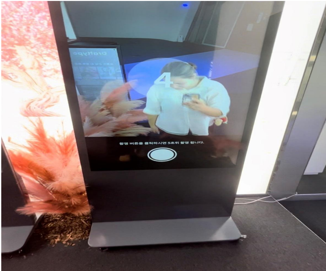
Slika 5. Navedena izložbu neposredno prije nego što je uređaj fotografirao osobu ispred zaslona

posjetiteljima svidio izgled koji vide na zaslonu, jednim klikom na odjeću dobili bi listu trgovina koje nude sličan proizvod i adrese gdje ih potencijalno mogu kupiti.