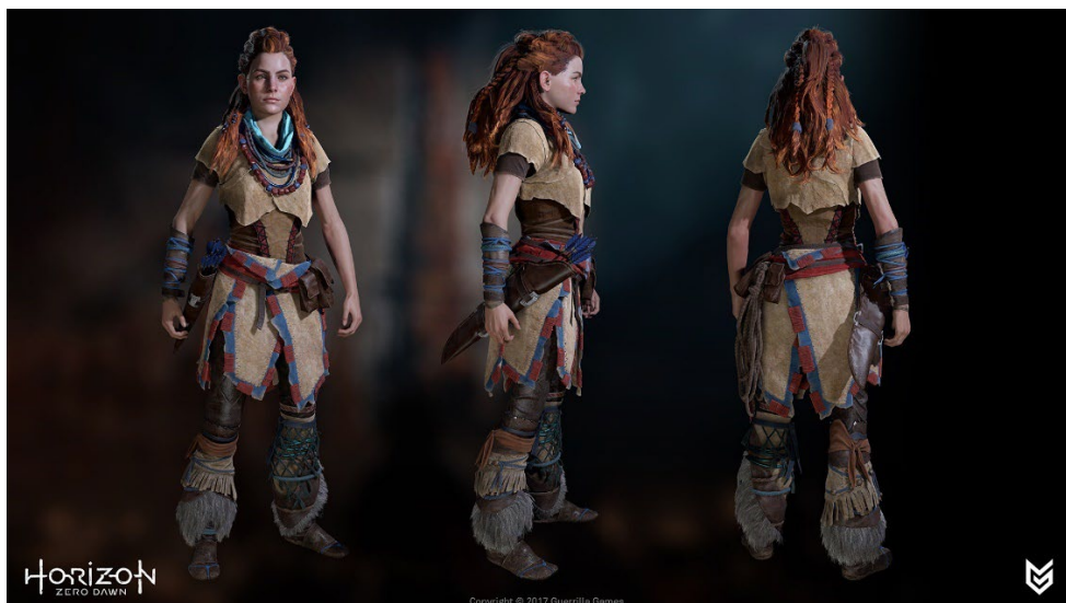
Slika 9 Aloy ingame model za igru Horizon Zero Dawn, Arno, 2017, ZBrushCentral, https://www.zbrushcentral.com/t/horizon-zero-dawn-art-dump/206487

Aloyin fizički izgled je ugodan oku, ona odgovara idealima ljepote koji se nalaze u drugim zapadnim masovnim medijima, ali ona nije objektivizirana i seksualizirana. Na primjer, njezina odjeća i oklop prilično su realistični i rijetko pokazuju njezino tijelo (Forni, 2020: 91). Beasley i Collins Standley tvrde kako je odjeća jedan od glavnih pokazatelja spolnih uloga u određenom društvu, što također vrijedi i u video igrama (2002: 283). Štoviše, Aloyin narativni luk usredotočen je na njezino djelovanje i autonomiju. Za razliku od mnogih ženskih likova koji su često definirani svojim odnosima s muškim likovima, njena priča vođena je njezinim vlastitim motivima, posebno njezinom potragom za identitetom i razumijevanjem svijeta. To je priča o prevladavanju nepovoljnih okolnosti, ne samo u smislu fizičkih izazova, već i onih društvenih. Prognana iz svog plemena, mora se kretati svijetom koji je često odbacuje ili podcjenjuje. Ipak, svojom ustrajnošću i vještinom, ona stječe poštovanje i priznanje, naposljetku postajući vođa i heroj. Ovaj narativ osnaživanja odjekuje i feminističkim idealima prevladavanja patrijarhalnih ograničenja i postizanja samospoznaje, čineći Aloy moćnim simbolom ženskog osnaživanja u videoigrama.