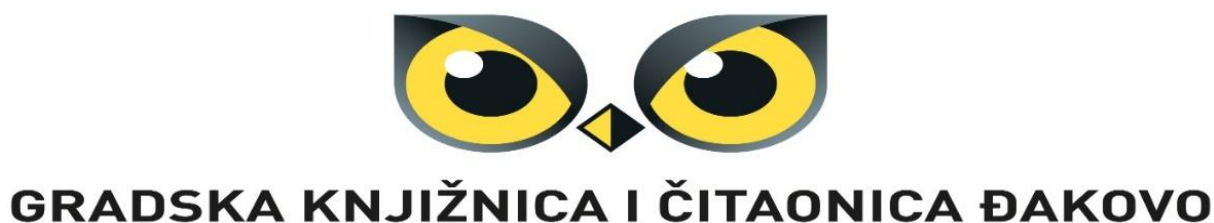
Slika 2. Logo Gradske knjižnice i čitaonice Đakovo