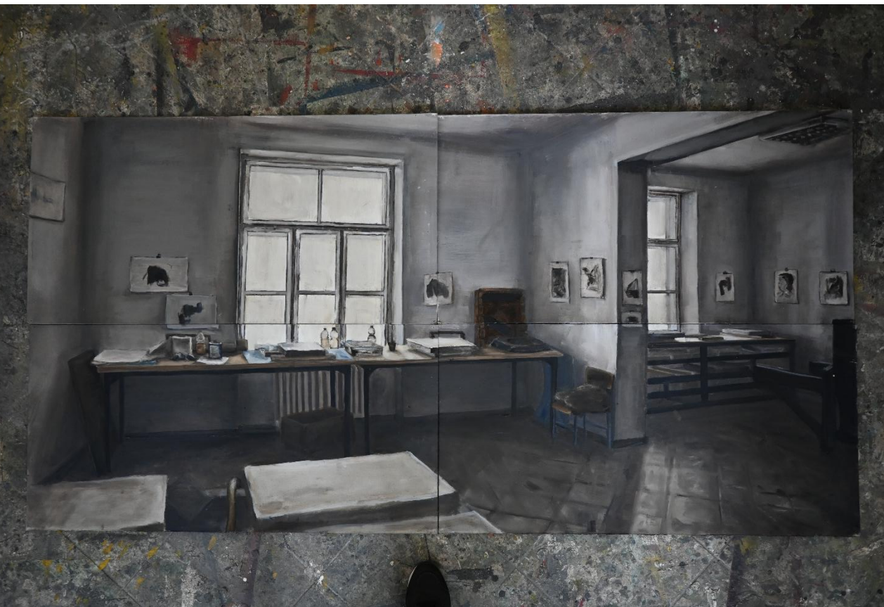
Slika 10. Prikaz gotove skice 3