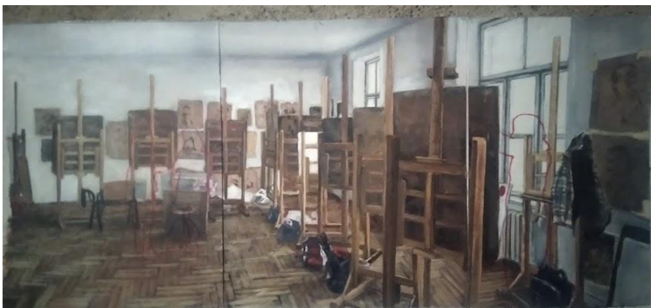
Slika 14. Prikaz gotove skice 2

Još jedan od izazova bio je postizanje ujednačenosti tonova. U početku, su slike bile tamnije nego što je planirano, pa je bilo potrebno prilagoditi paletu boja i svjetlinu kako bi radovi postigli željeni efekt. Ovaj je tehnički proces bio dugotrajan, ali kroz njega sam naučio mnogo o harmoniji boja i o tome kako različiti tonovi mogu stvoriti specifičnu atmosferu.