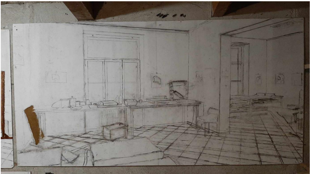
Slika 17. Prikaz 2. crteža završnog rada