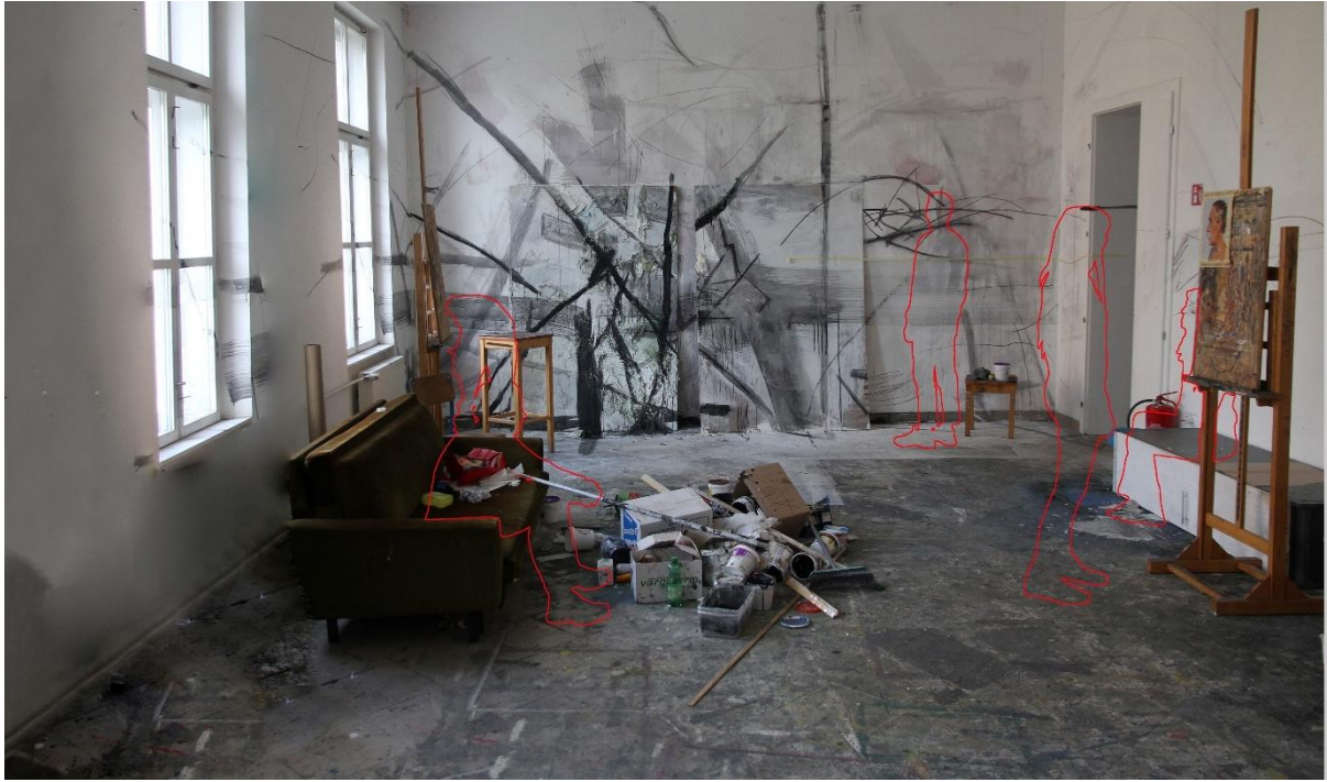
Slika 4. Izvedba fotografije za skicu 1