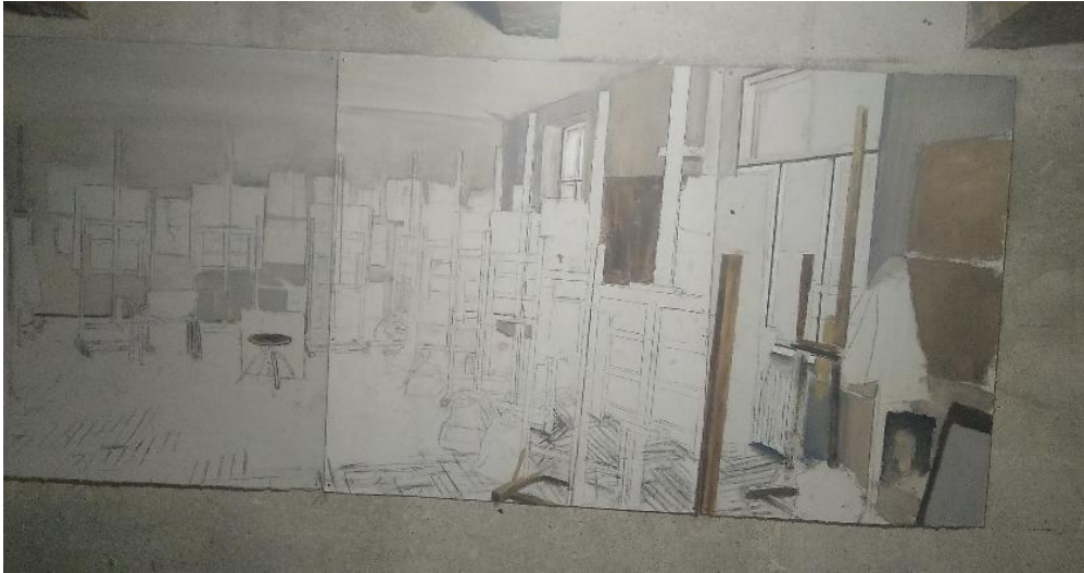
Slika 13. Prikaz izrade skice 2