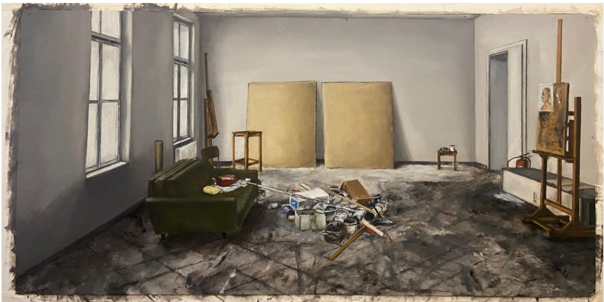
Slika 20. Prikaz gotove slike završnog rada