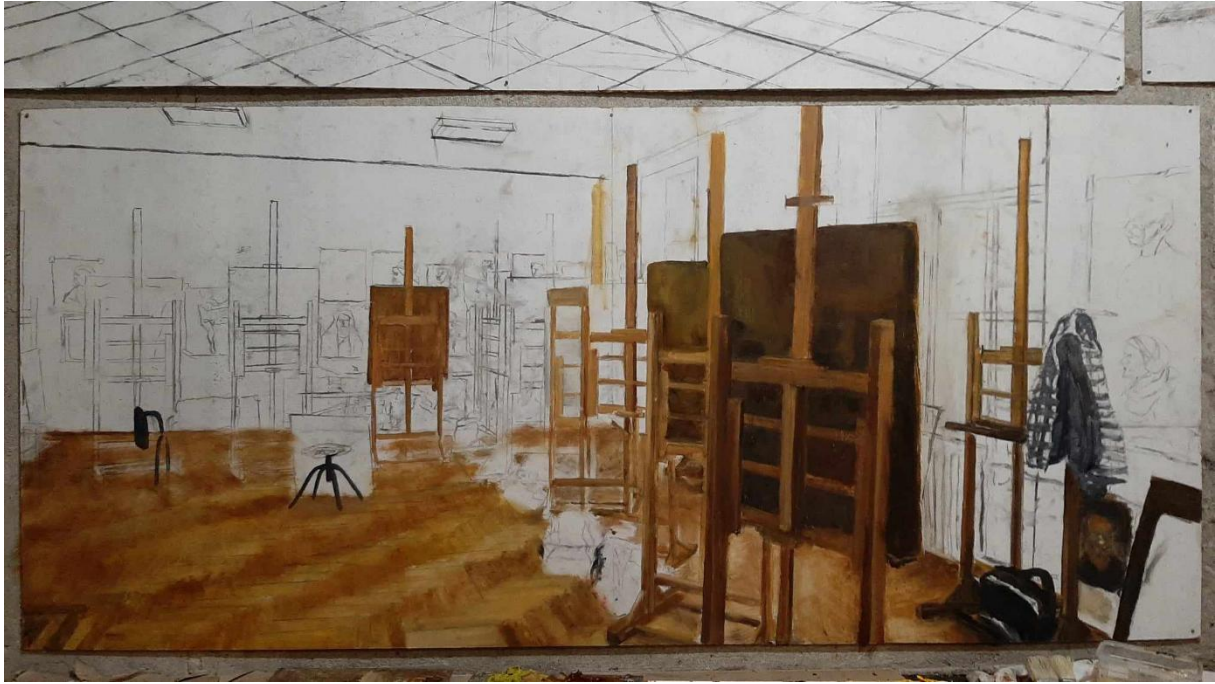
Slika 18. Prikaz 3. crteža završnog rada

Još jedan od izazova bio je postizanje ujednačenosti tonova. U početku, slike su bile tamnije nego što sam planirao, pa je bilo potrebno prilagoditi paletu boja i svjetlinu kako bi radovi postigli željeni efekt. Ovaj tehnički proces bio je dugotrajan, ali kroz njega sam naučio mnogo o harmoniji boja i o tome kako različiti tonovi mogu stvoriti specifičnu atmosferu.