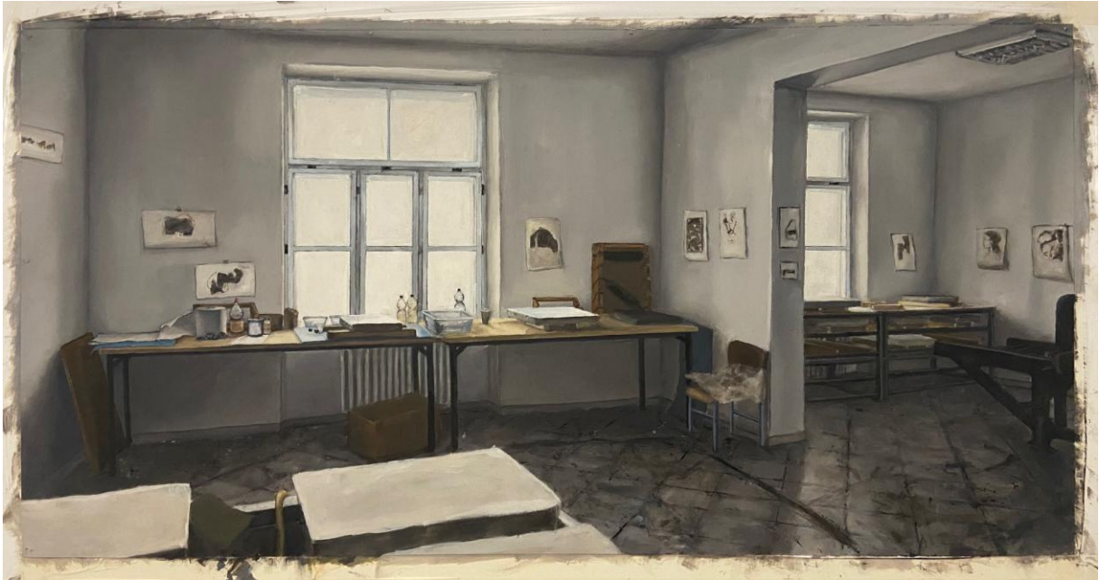
Slika 19. Prikaz gotove slike završnog rada