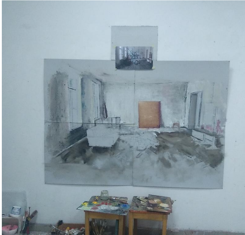
Slika 11. Prikaz gotove skice 1