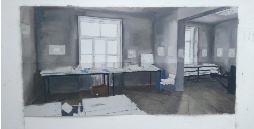
Slika 9. Prikaz postupka izrade skice 3