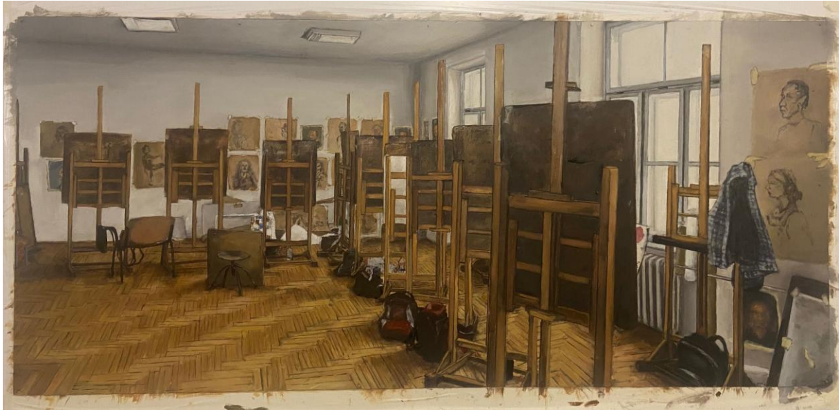
Slika 21. Prikaz gotove slike završnog rada

Izrada završnog rada donijela je brojne izazove, ali upravo su ti izazovi potaknuli na daljnje istraživanje i razvoj. Na primjer, problemi s perspektivom u početnim skicama – poput krivo postavljenih prozora ili pločica – pokazali su koliko je važno strpljenje i promišljanje u svakom koraku. Uz mentorovu pomoć, uspješno su ispravljene te greške i usklađene sve tri slike tako da budu dio jedinstvene cjeline.