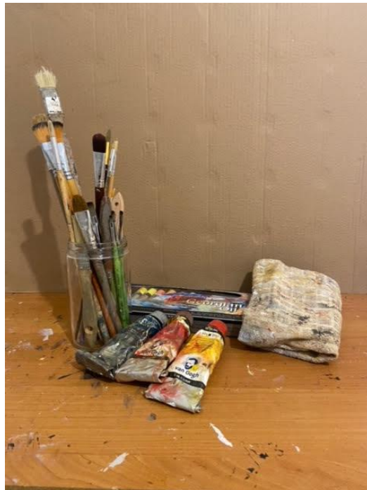
Slika 15. Prikaz fotografije uljanih boja, krpice za slikanje i kistova za slikarstvo

Ulje na platnu bilo je glavni medij, a upotrebljavane su uljane boje marke Van Gogh, Georgian i Art Creation.