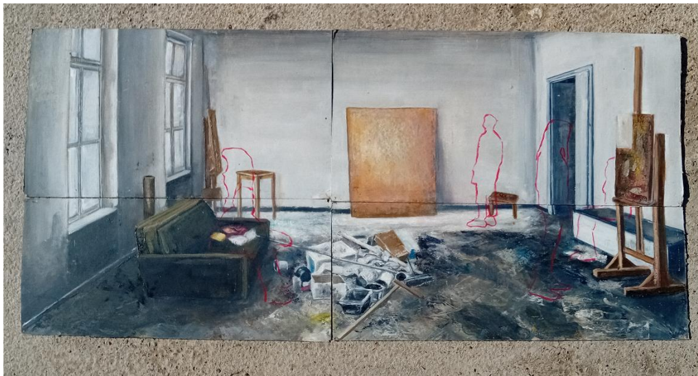
Slika 12. Prikaz gotove skice 1