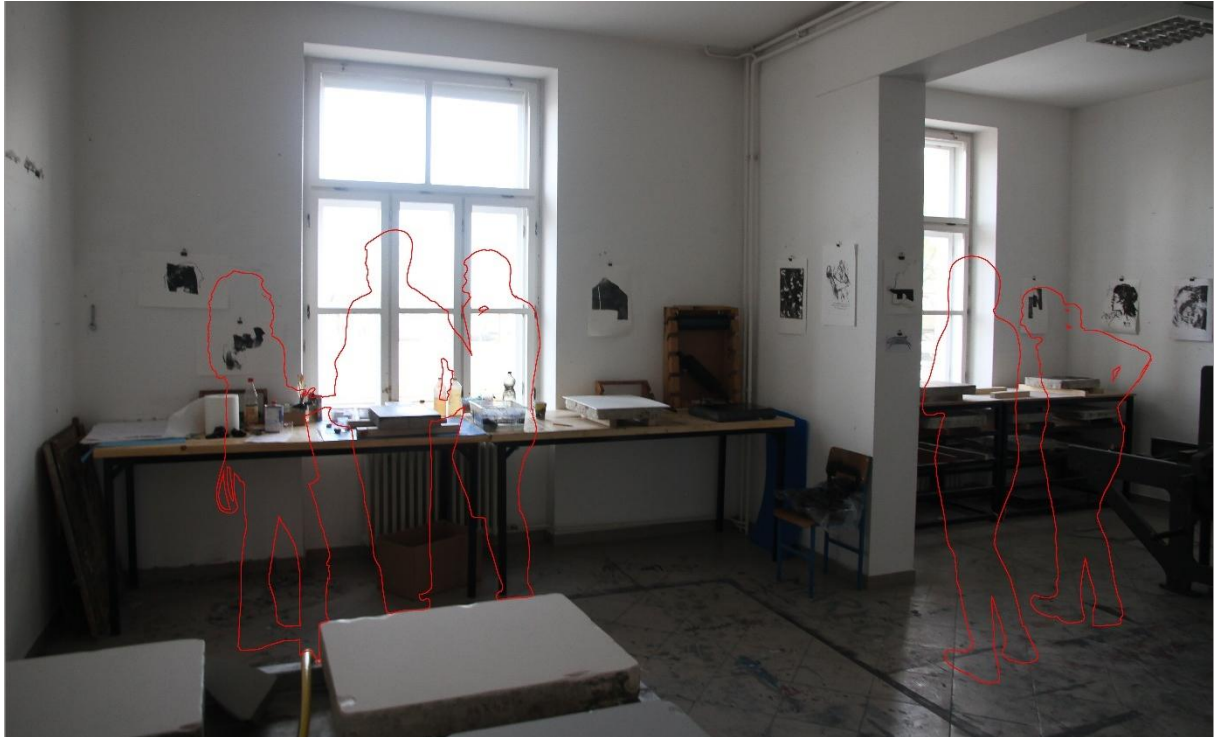
Slika 6. Izvedba fotografije za skicu 3