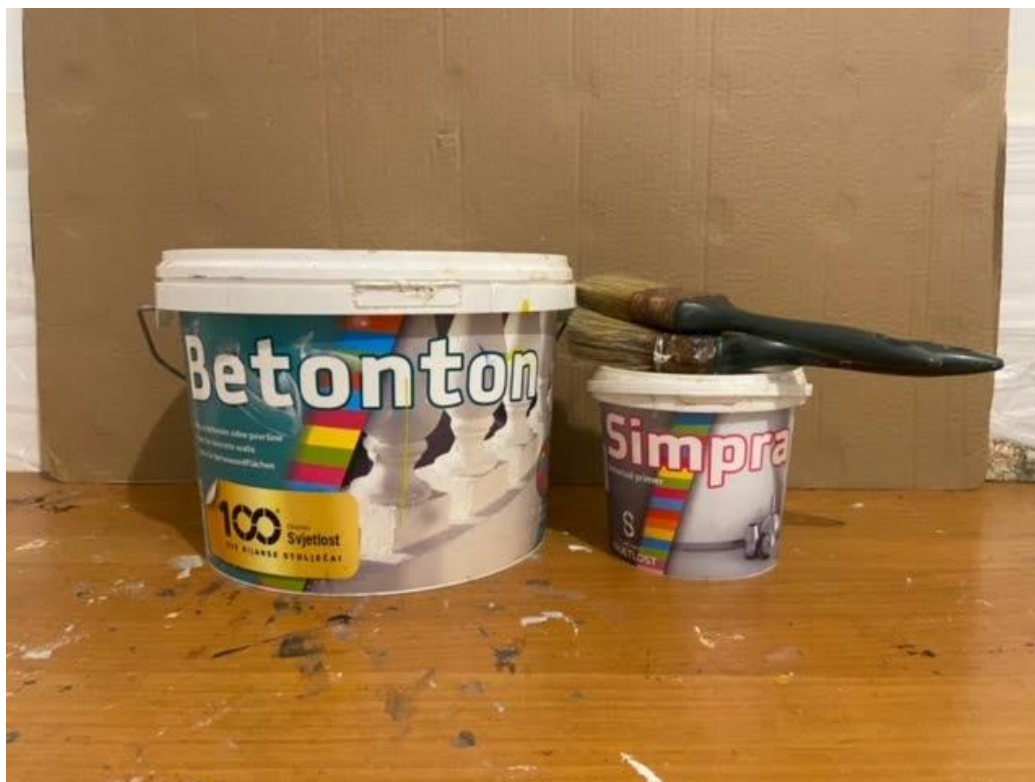
Slika 7. Prikaz bijele boje za beton, emulzije i dviju širokih četki za boje