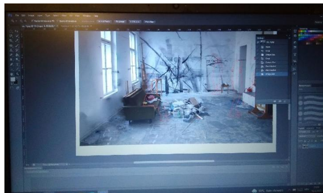
Slika 3. Prikaz uređivanja fotografije u photoshopu

U dogovoru s mentorom postojala je ideja za izradom obrisnih linija likova studenata prisutnih na Akademiji. Izrađene su nove skice u photoshopu. Ideja je bila da Likovi u obliku „duhova prošlosti“ dodaju specifičnu atmosferu te simboliziraju prolaznost vremena i kreativni proces koji se odvijao unutar tih zidova.