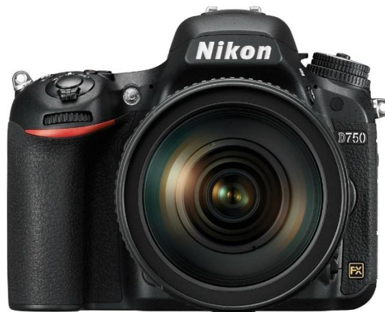
Slika 1. Prikaz digitalnog fotoaparata Nikon

U procesu izrade ovog rada, upotrebljavani su razni alati i materijali kako bi se postigao željeni efekt. Fotografije koje su snimljene unutar Akademije snimljene su pomoću digitalnog fotoaparata Nikon. Studenti su pomogli podesiti ekspoziciju kako bi se objektiv prilagodio snimanju ambijenta, hvatajući igru svjetla i sjene koja je bila ključna za atmosferu mojih fotografija.