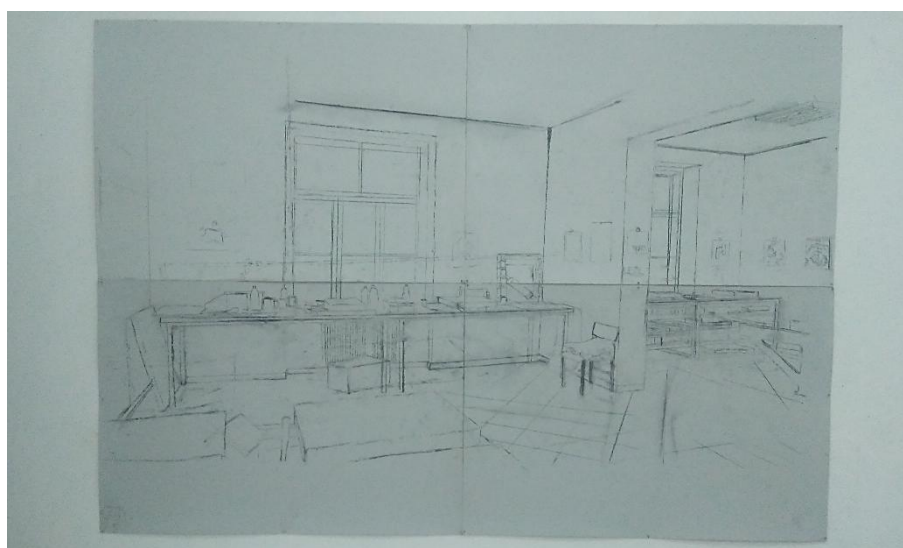
Slika 8. Prikaz skice 3