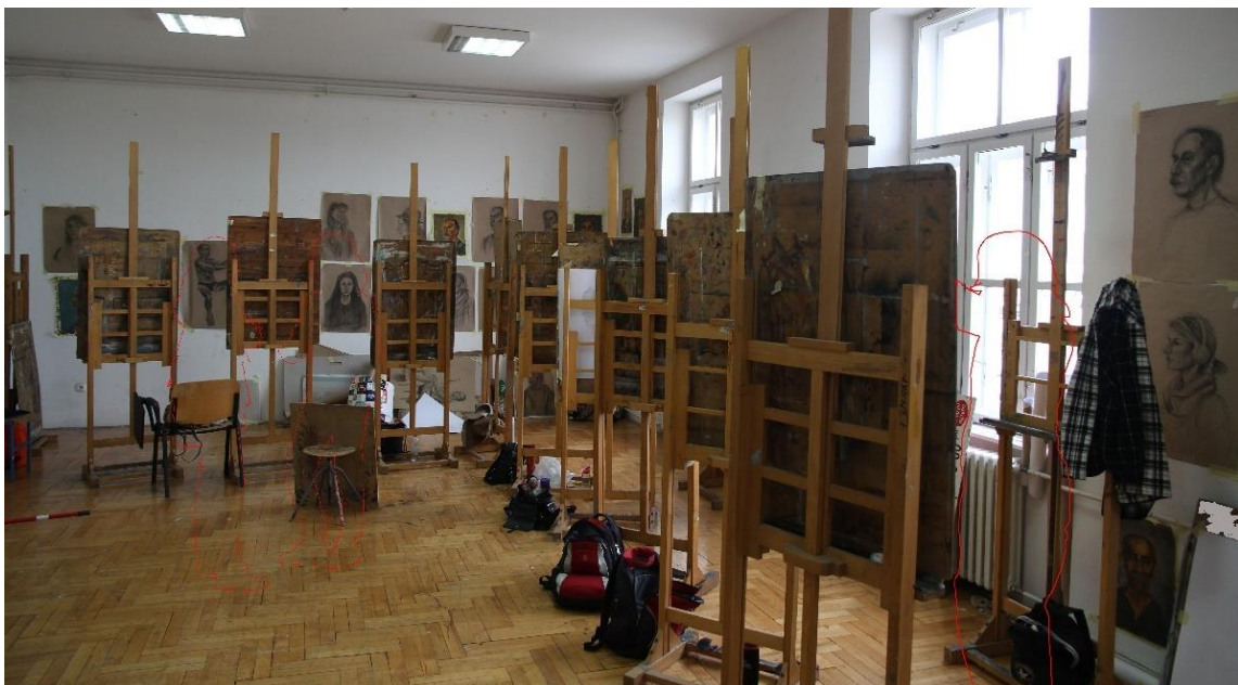
Slika 5. Izvedba fotografije za skicu 2