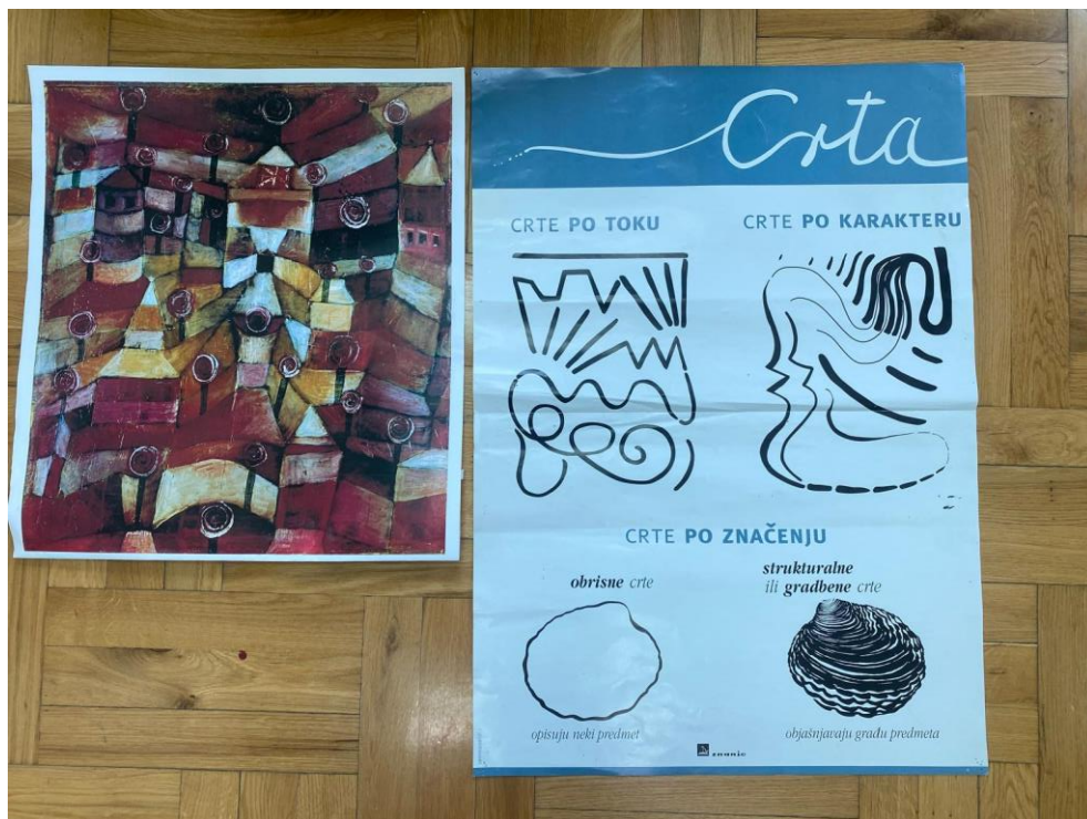
Slika 3. Paul Klee, Vrt ruža , 1920. godina, likovni element: crta