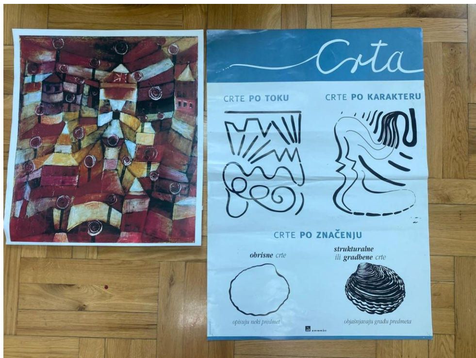
Slika 3. Paul Klee, Vrt ruža , 1920. godina, likovni element: crta