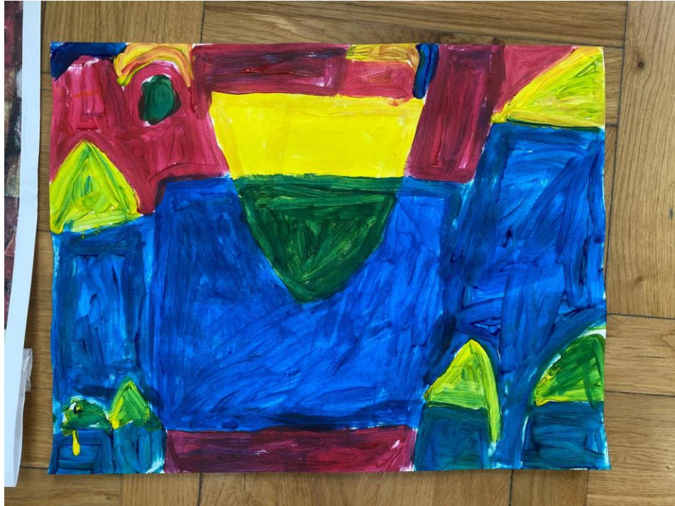
Slika 13. Lukin rad

Učiteljica je često postavljala Luki pitanja poput: „Što si danas radio, možeš li mi ponoviti?“, „Što misliš, čiji su radovi uspješno odrađeni?“, „Imaju li svi prikazane čiste boje na radovima?“. Luka je uspijevaio odgovoriti na pitanja i zamijetio uspjeh na radovima. Učiteljica je kontinuirano napominjala kako je potrebno iza sebe ostaviti uredan i čist prostor pa su učenici sa zadovoljstvom pospremili svoj radni prostor nakon završenog sata. Učenike treba poticati na rad i pospremanje jer im to stvara samopouzdanje. Ako im se kaže da su „umjetnici“ i da je to njihov umjetnički rad, time im podižemo samopouzdanje i stvaramo osjećaj ugone i zadovoljstva.