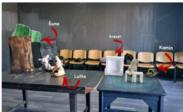
Slika 5. Improvizirana scenografija

Naša ideja pop-up knjige nije bila izvediva kako smo zamislili pa smo došli do varijante u kojoj su i rekvizite i scenografija izrađeni u više dijelova. U kući se nalazio krevet, blagovaonski stol i kamin, a u šumi pojedinačno drveće. Jedini problem predstavljao je kamin koji je trebao biti prostor gdje se kroz rupu u njemu pojavljuju Malik i Domaći kao lutka-rukavica. Prostor za animatorovu ruku bio je preuzak te lutka nije mogla uspravno stajati. Zato smo Malika premjestili na kamin, a Domaće u dimnjak pri tom odvojivši svaki prst zasebno čime smo dobili prstne lutke. Komunikacija između tehnologa i animatora ključna je za kvalitetan ishod predstave. Na našu sreću, djevojke su bile susretljive i vrlo smo brzo došli do rješenja na obostrano zadovoljstvo. Iz toga možemo naučiti cijeniti tuđe vrijeme i trud, ne požurivati i naći zajednički jezik.