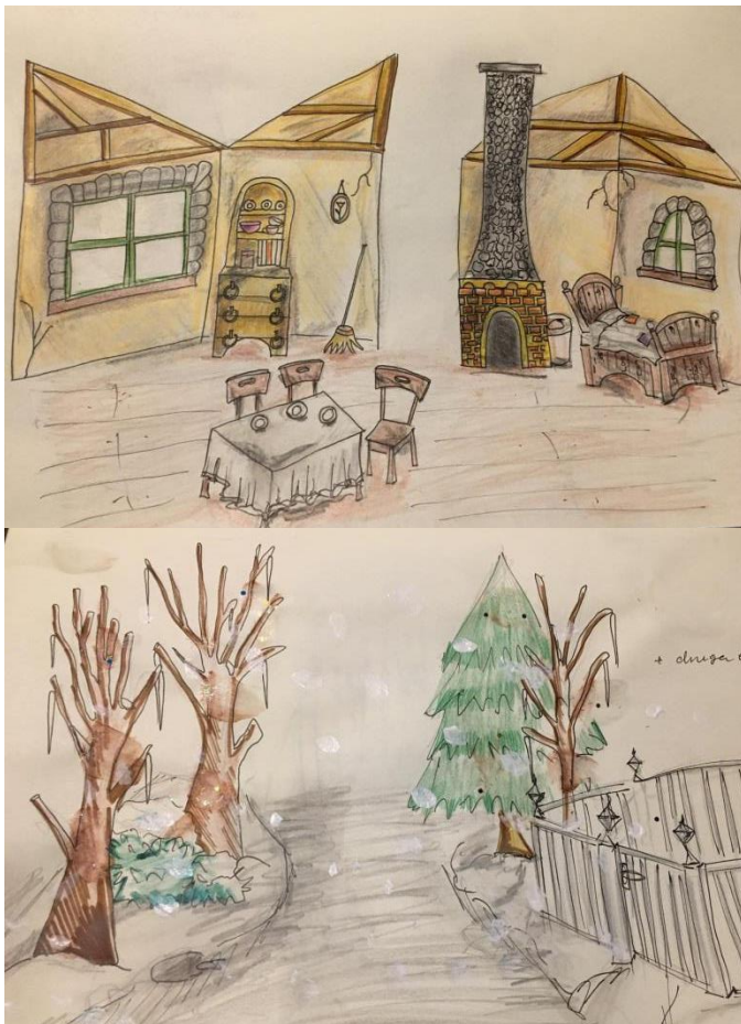
Slike 3 i 4. Prve skice interijera i eksterijera

Sa scenografkinjom Petrom Burić oformili smo tim koji će raditi na predstavi. Naša početna ideja scenografije bila je pop-up knjiga, poput onih knjiga koje smo čitali kao djeca kada dinosauri, sobe i lutke od papira 3D iskaču kako se knjige listaju. To smo željeli zbog kompaktnosti, mobilnosti i mijenjanja na sceni. Htjeli smo interijer skromne kućice s kaminom, stolićem i ležajima za Majku i Sina, a eksterijer listopadne šume zimi.