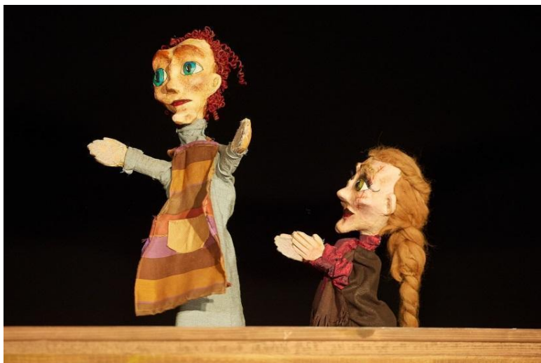
Slika 8. Spomenuta predstava Divljeg zapada zov

da je to bilo iz straha od tehnike koja mi isprva nije odgovarala, ali da sam taj dan tupila po starome, odbijala lutku, danas ta predstava ne bi bila tamo gdje je. Napravili smo odličnu predstavu Divljeg zapada zov koju je nakon ispita na svoj repertoar preuzelo Gradsko kazalište Zorin dom u Karlovcu i sada već treću sezonu ta predstava uveseljava klince i one malo starije.