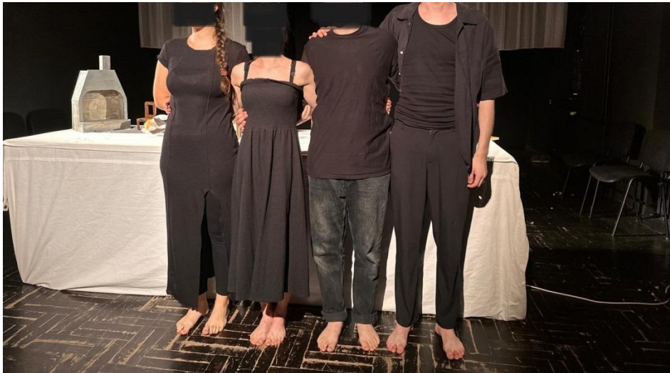
Slika 7. Kostimi za predstavu Šuma Striborova

Prvotna ideja kostima su bile bijele lanene košulje s izvezenim pleterom. Smatrali smo kako će idealno odgovarati vizualnosti predstave, ali smo odlučili da to ipak nije dobro rješenje zbog kombinacije s lutakama koje su filcane bijelom vunom te, zbog naših bijelih košulja, ne bi došle do izražaja. Tako smo počeli razmišljati o varijanti crne tehnike pod uvjetom da nam se kostimi ne pretvore u „crne nindže” jer ipak smo vidljivi i prisutni kao glumci u predstavi. Na jednoj od proba, kao dio crne tehnike, na sebi sam imala crnu haljinu koja se kolegama svidjela jer je, iako crna, krojem davala etno moment koji smo isprva željeli. Tako smo odlučili kao finalni kostim kombinirati to dvoje: crne haljine za glumice i crne košulje/majice za glumce.