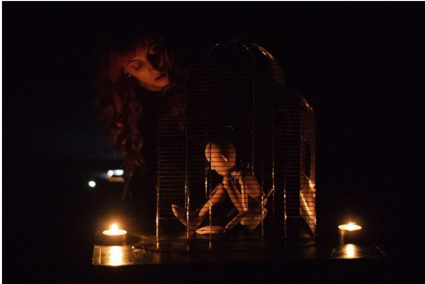
Slika 8. Spomenuta etida Antigona

temom Antigone, to sam okrenula u svoju korist. Radila sam i učila o animaciji atmosfere i prostora te su ideje jednostavno dolazile prirodno i stvarno mogu reći da sam ponosna na tu etidu.